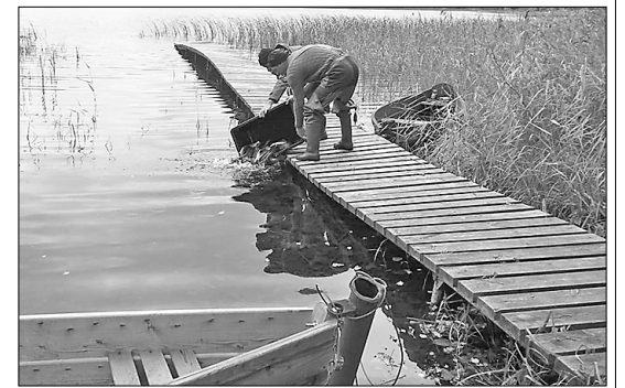
В озёра Салмея и Каучерс запущены 14 000 мальков щуки.

В результате проекта увеличены запасы рыбы в озёрах Салмея и Каучерс, тем самым, созданы благоприятные обстоятельства для рекреации рыболовства и развития туризма в Риебиньском крае. Проект способствует развитию хозяйства на озёрах Салмея и Каучерс. Пополняя запасы ресурсов рыбы в озёрах Риебиньского края, созданы благоприятные обстоятельства для естественного воспроизводства и долгосрочного использования рыбных ресурсов. Проект соответствует рекомендациям Научного института безопасности питания,