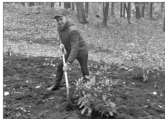
Председатель думы Рибебиньского края Петерис Рожинскис вместе с другими руководителями самоуправлений посадил рододендрон, создавая на территории Большой эстрады Межапарка сад рододендронов.

Руководители самоуправлений сажали свой куст рододендрона в соответствии с местом на-