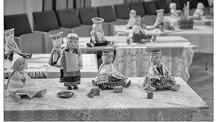
Латышские ценности можно представить и так – созданные в своё время на фабрике «Страуме» куклы одеты в национальные костюмы.