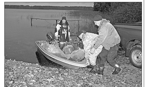
Инспекторы порядка, ответственные за контроль рыбных ресурсов в озёрах края, участвуют в запуске мальков судака.

Озёра очень важны для развития среды туризма в Риебиньском крае. Увеличение ресурсов рыбы –