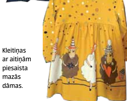
Kleitīņas ar aitiņām piesaista mazās dāmas.