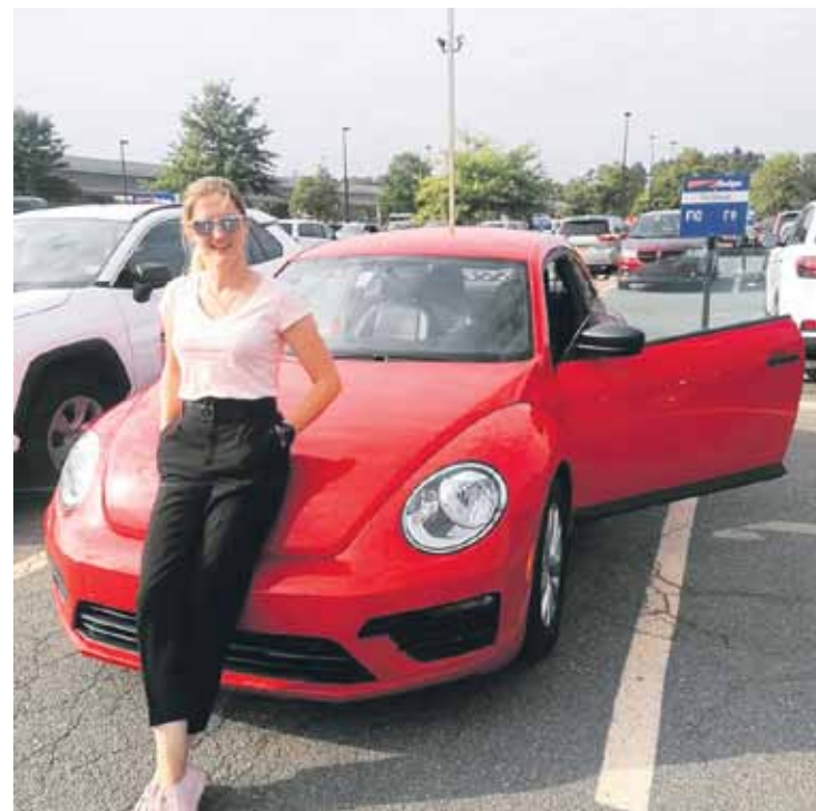
Mūsu ceļojuma biedrene visu nedēļu – VW Beetle .

iespaidīgi, visapkārt dažāda izmēra lielgabali, tikai žēl, ka neesam ieradusies uz laiku, kad notiek arī senās artilērijas demonstrācija. Izstaigājam barakas, kas izskatās kā tikai nupat pamestas: vēl arvien uz lāvu dēļiem guļ salmu maisi, stāv ūdens mucas un mazas krāsniņas. Pārņem