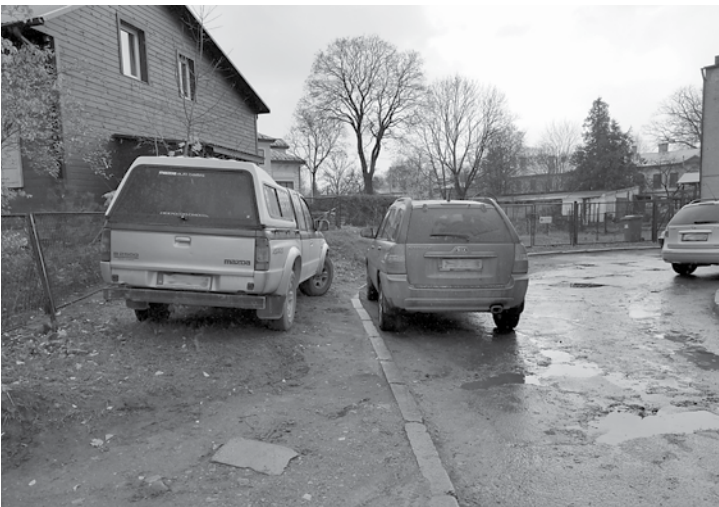
Rīga, Meža iela. Jo lielāka mašīna, jo lielāka nekaunība. Auto atstāts zaļajā zonā.

likās tas, ka, ie braucot pilsētā, pirms vecā Ventas tilta brauktuve ir ļoti šaura, ja abās malās atstāti auto.”