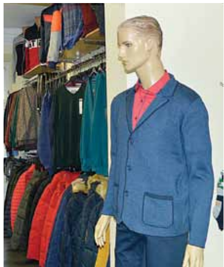
Tuvojoties žetonu vakaru un Ziemassvētku laikam, veikalā Hīts tiek meklētas žaketes un uzvalki.