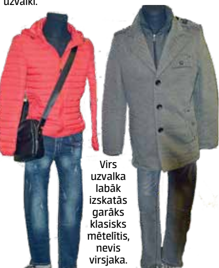
Virš uzvalka labāk izskatās garāks klasisks mētelītis, nevis virsjaka.

Una atzīst, ka Kuldīgā cilvēku aizvien mazāk, bet veikaliņš pie veikaliņa. Tomēr izskatoties, ka visiem pircēju pietiek: „Vasarā pie mums nāk daudzi tūristi. Īpaši vācieši ir sajūsmā par lina izstrādājumiem. Viņiem tādu lietu neesot.”