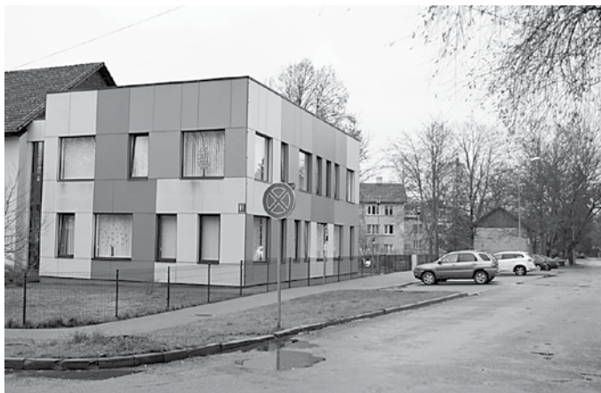
Mazās Pļavas ielas posms Kuldīgā, kur pie bērnu dārza Cīrulītis bieži mēdz grēkot autovadītāji vecāki.

„Es bieži apmeklēju dažādas Latvijas pilsētas, šovasar Kuldīgā biju pat divas reizes,” saka Rīgas pašvaldības policijas priekšnieks Kaspars Šabāns. „Visur izbūvēti varēji, tikai jāskatās uz zīmēm. Man visraucējošākais