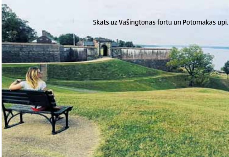
Skats uz Vašingtonas fortu un Potomakas upi.

Tā kā Amerikā datu viesabonēšana ir dārgs prieks, pirmais uzdevums ir atrast tuvāko mobilo sakaru tīkla veikalu. Stāvvietā kādam puisim pajautājam aptuveno ceļu un braucam. Pēc trešā neveiksmīgā mēģinājuma atrast pareizo virzienu lielceļu un nobrauktuvju labirintā esam nonākušas pie maksas ceļa būdiņas – pietājam pie tās darbinieka un vēlreiz pārjautājam, kur