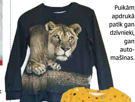
Puikām apdrukā patīk gan dzīvnieki, gan automašīnas.