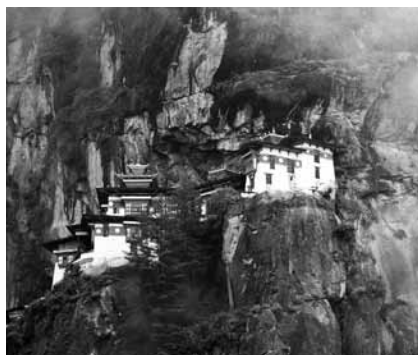
Atbildi gaidām līdz 27. novembrim 11.00; to sūtīt konkursam Pasaules pazinējs, Kurzemniekam 1905. gada ielā 19, Kuldīgā, LV-3301, vai e-pastā redakcija@kurzemnieks.lv vai iemest redakcijas durvju pastkastē!

Viena no ievērojamām budistu svētvietām, tempļu komplekss, kas ir īpašs ar to, ka atrodas uz klints. Komplekss 1692. gadā uzcelts vietā, kur, kā tiek uzskatīts, 8. gadsimtā Guru Padmasambhava medītejis trīs gadus, trīs mēnešus, trīs nedēļas, trīs dienas un trīs stundas. Šī vieta kļuvusi par valsts kultūras ikonu.