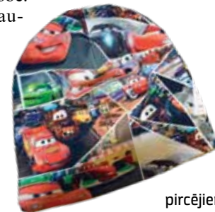
Ja cepuri vai šalli rotā iemīļotie animācijas filmu varoņi, mazajiem pircējiem jautājumu nav, bet vecāki grib iebilst.