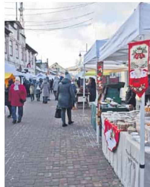
Tirdziņš gājēju ielā.

Pirmajā Adventē Kuldīgā bija sarīkoti raibu raibie pasākumi. Dzestrais, bet saulainais laiks pulcēja gan vietējos, gan pilsētas viesus. Liepājas ielā bija bagātīgs dāvanu tirgus, kurā varēja iegādāties apģērbu, rotaslietas, sveces, piparkūkas, saldumus, sieru, kūpinājumus, zivis, dzērienus utt. Liepājas ielā bērni varēja braukt ar Ziemassvētku vilcieniņu. Rātslaukumā jauno sezonu sākuši stikla namiņi, kuros līdz pat svētkiem nedēļas nogalēs var iegādāties dāvanas un citus labumus. Baznīcas ielā ar performanci Laternas skatītājus iepriecināja Nīderlandes ielu teātris Tukkers Connexion . Pirms egles iedegšanas uz īpašas platformas apkārt tai slidēja rūķi un četras simboliskas Adventes sveces. Baltā limuzīnā jeb sapņu kariatē ieradās Ziemassvētku vecītis – tādu modernu transporta līdzekļi rīkotāji noskatījuši un nomājuši Rīgā. Vakarā svinīgi iedegti arī Kuldīgas galvenās egles rotājumi.