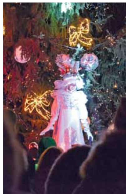
Viena no simboliskajām Adventes svecēm.