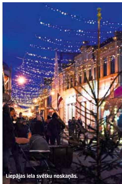
Liepājas iela svētku noskaņās.