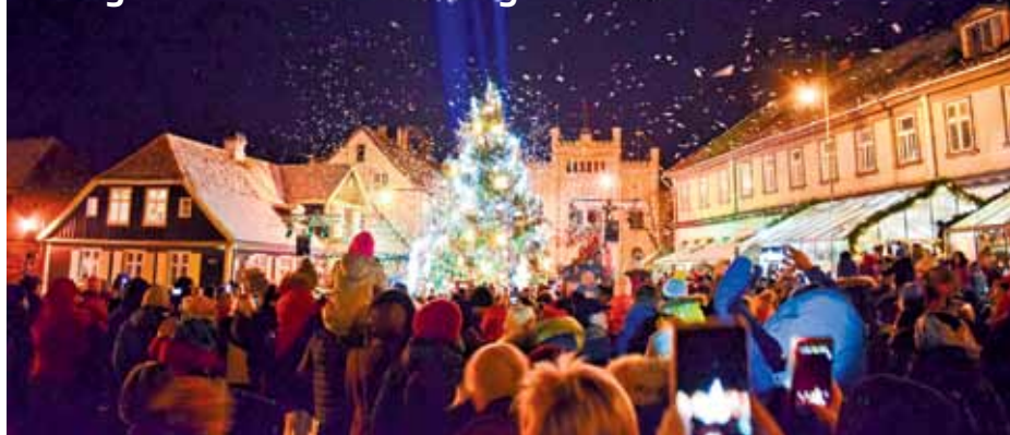
Ar konfeti salūtu iedegta svētku egle Kuldīgā.

Ar 16. festivālu Notici brīnumam! 1. decembrī Kuldīgā sācies Ziemassvētku gaidīšanas laiks.