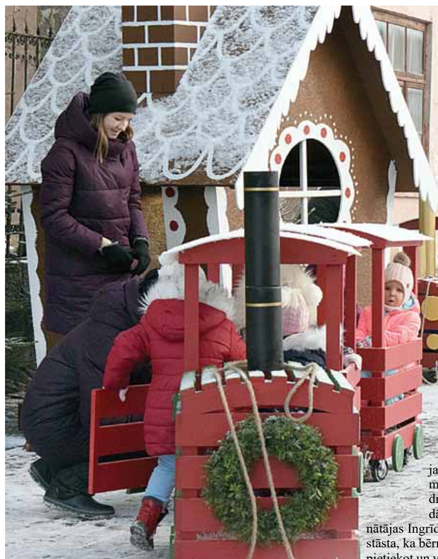
Kuldīgas Ābelītes audzinātājas pastaigas laikā audzēkņus izvzina ar Ziemassvētku vilcieniņu.

Ar rūķu darbnīcām, egles iedegšanu un interesantiem pasākumiem sācies Ziemassvētku gaidīšanas laiks.