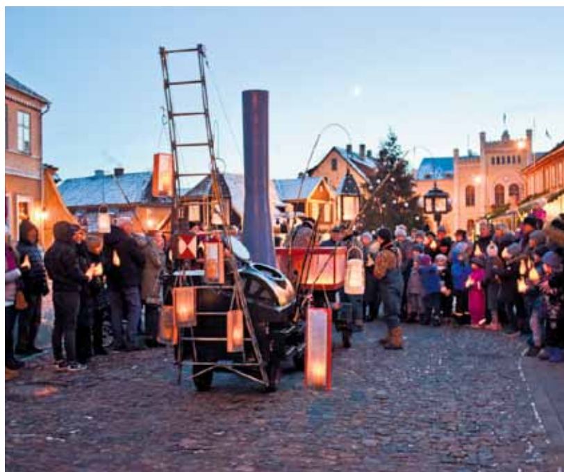
Baznīcas ielā uzstājas Nīderlandes ielu teātris Tukkers Connexion .