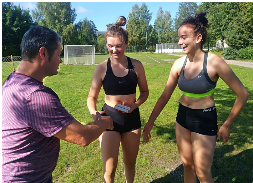
Sacensībām pieteicās sešas komandas – četras komandas no Ilūkstes novada, starp kurām bija arī viena dāmu komanda