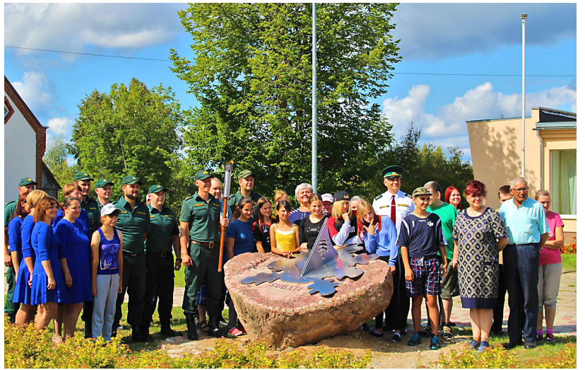
22.augustā arī Ilūkstes novada Subates pilsētā tika nogādāta viena no ceļojošām lāpām, kur to sagaidīja novada, pilsētas iedzīvotāji ar vokālo ansambli “Sonāte”