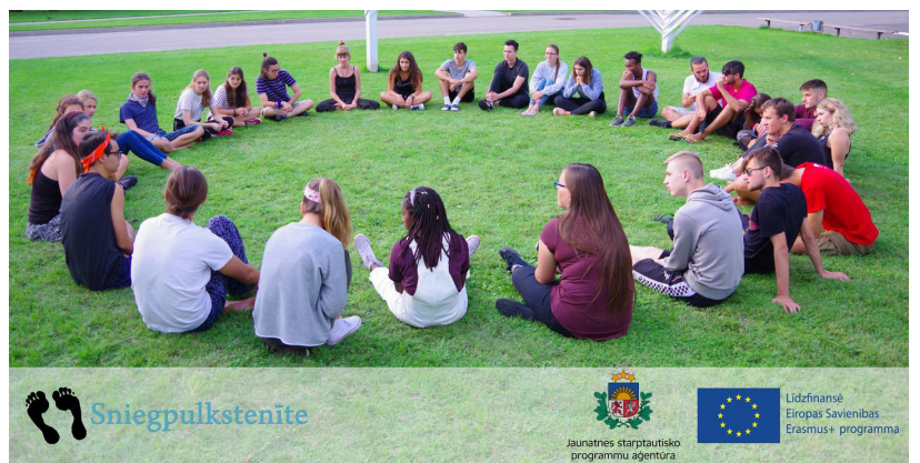
Projekta ietvaros pulcējās 30 aktīvi jaunieši no Spānijas, Grieķijas, Polijas, Itālijas un Latvijas. Baudot Ilūkstes viesmīlību, jaunieši guva zināšanas par jauniešu mobilitātes iespējām, ko piedāvā Erasmus+ programma, citām kultūrām, un Eiropas iniciatīvām

Ilūkstes un Daugavpils novada invalidu biedrība “Ildra” pateicas Ņujorkas Latviešu evanģēliski luteriskajai draudzei par ziedojumu 1500 USD (1305,48EUR) apmērā cilvēku ar īpašām vajadzībām atbalstam. Par saziņotajiem līdzekļiem tika iegādāta veļas mašīna un matracis aprūpes gultai ar ūdenscaurlaidīgu pārvalku pakalpojumu nodrošināšanai aprūpes mājā Kalupē, pārvietojamā, saliekamā rampa vides pieejamības nodrošinā-