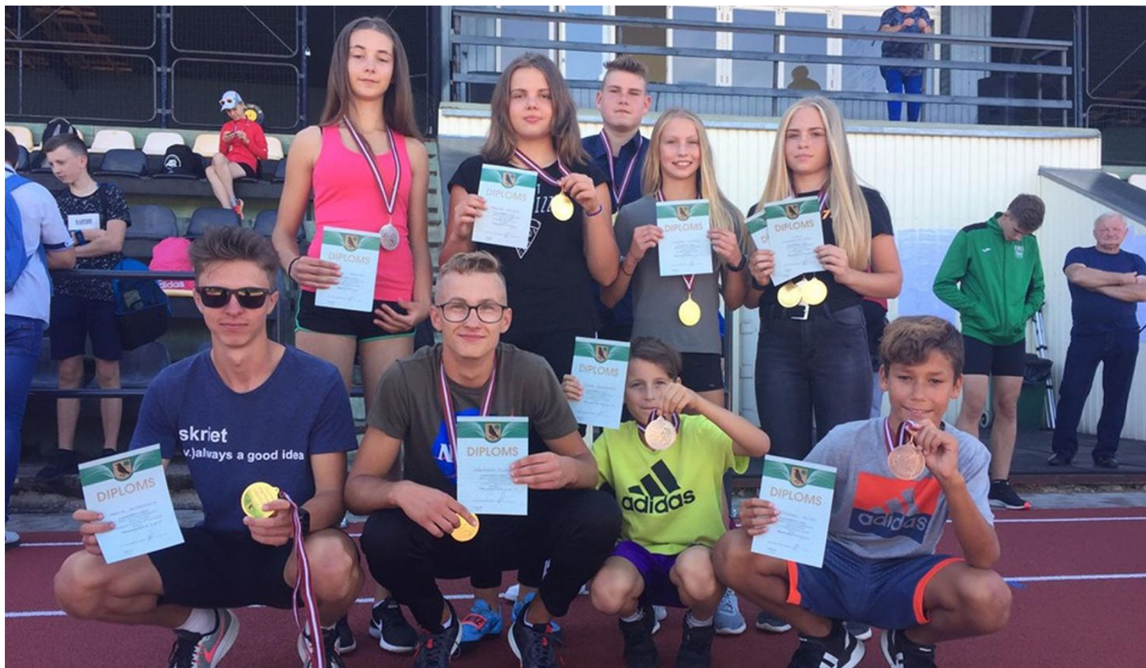
Pilnveidojot un attīstot savas prasmes Ilūkstes novada sporta skolā, jaunie sportisti regulāri priecē ar izcilēm sasniegumiem daudzās, augsta ranga sacensībās