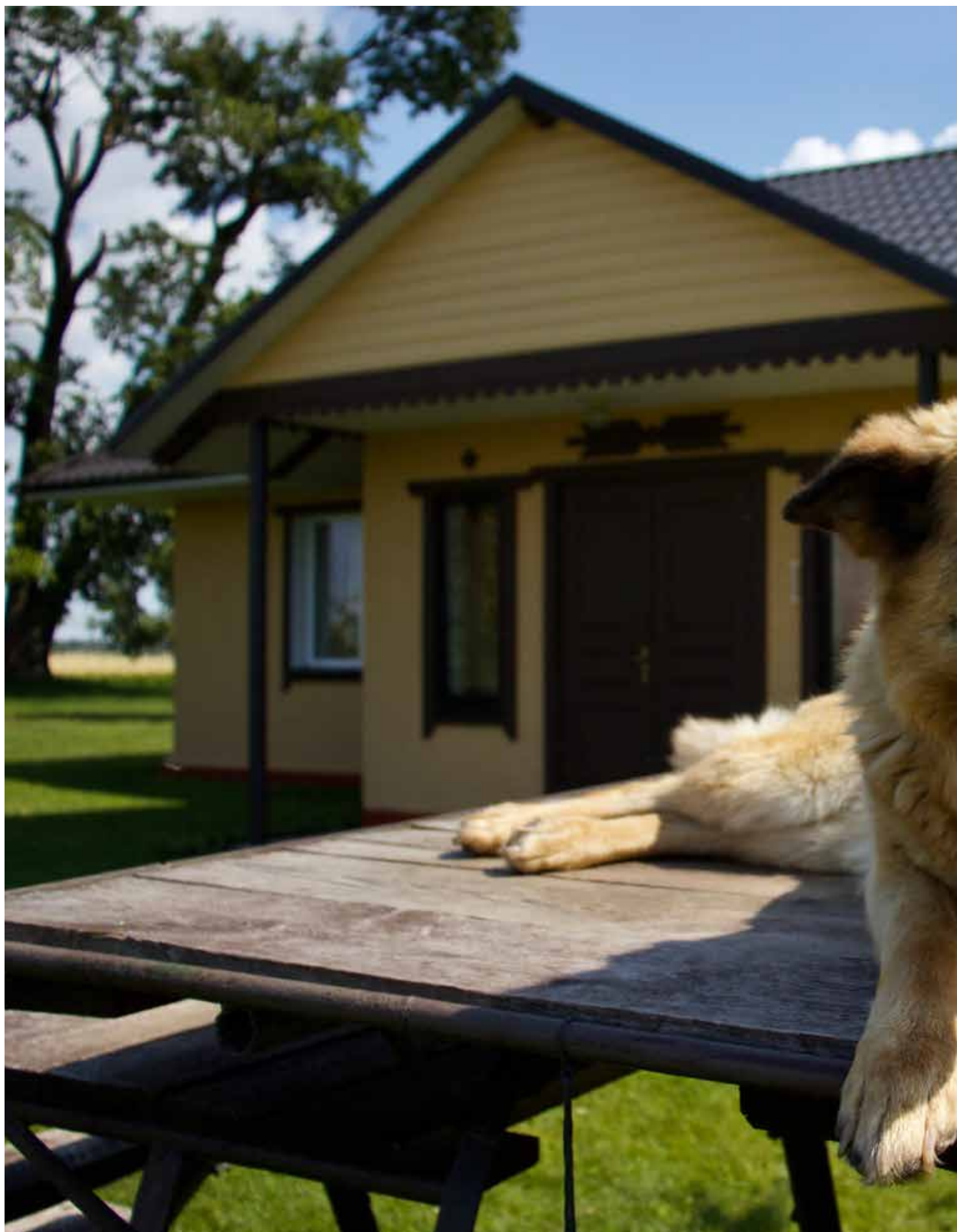
“ZARINKI” Dvietes pagastā