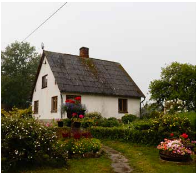
“AIZUPES” Eglaines pagastā