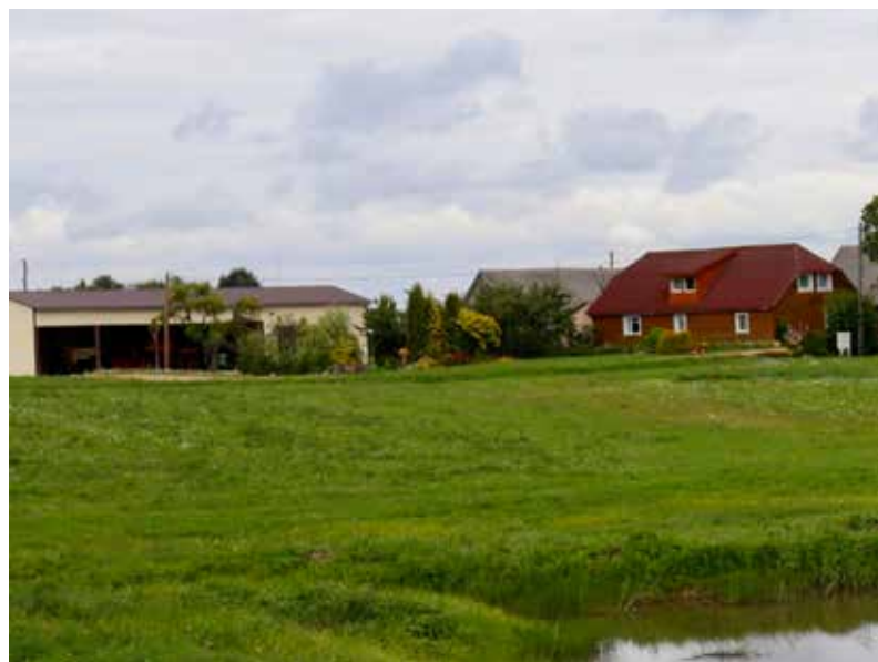
"UZKALNIŅI" Pilskalnes pagastā