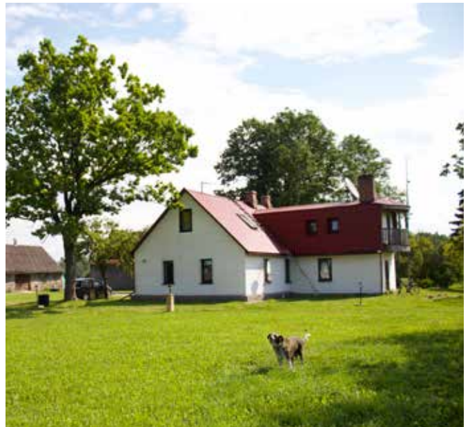
"DRAUDZIŅI" Bebrenes pagastā