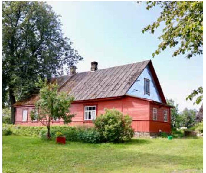
"SALDUMI" Bebrenes pagastā