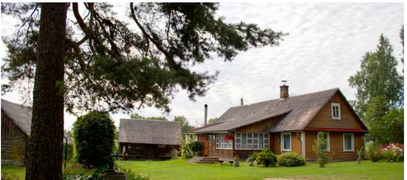
“MEŽVIDI” Bebreņu pagastā