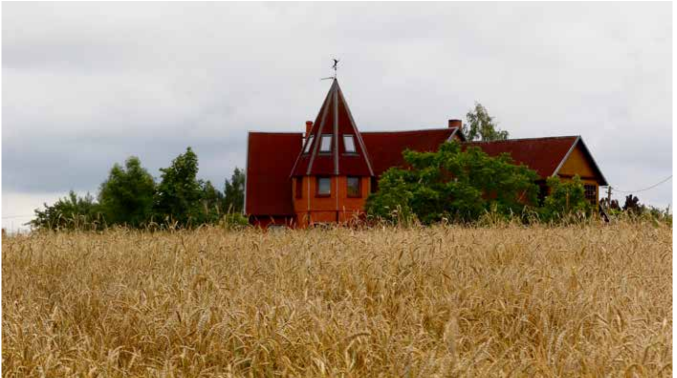
“ĀBOLKALNI” Pilskalnes pagastā

“Lai spētu dzīvē noturēt vietu, dvēselē jābūt avotam”