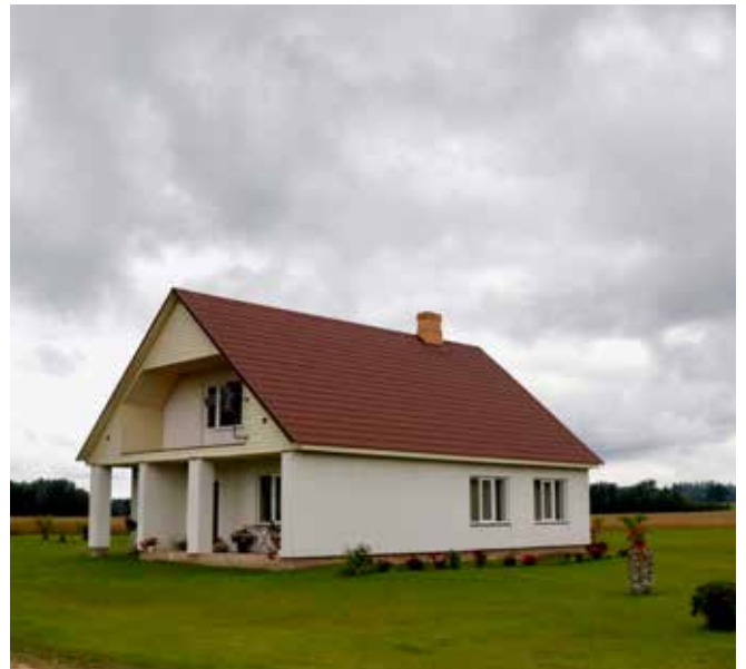
“LĪCĪŠI” Pilskalnes pagastā