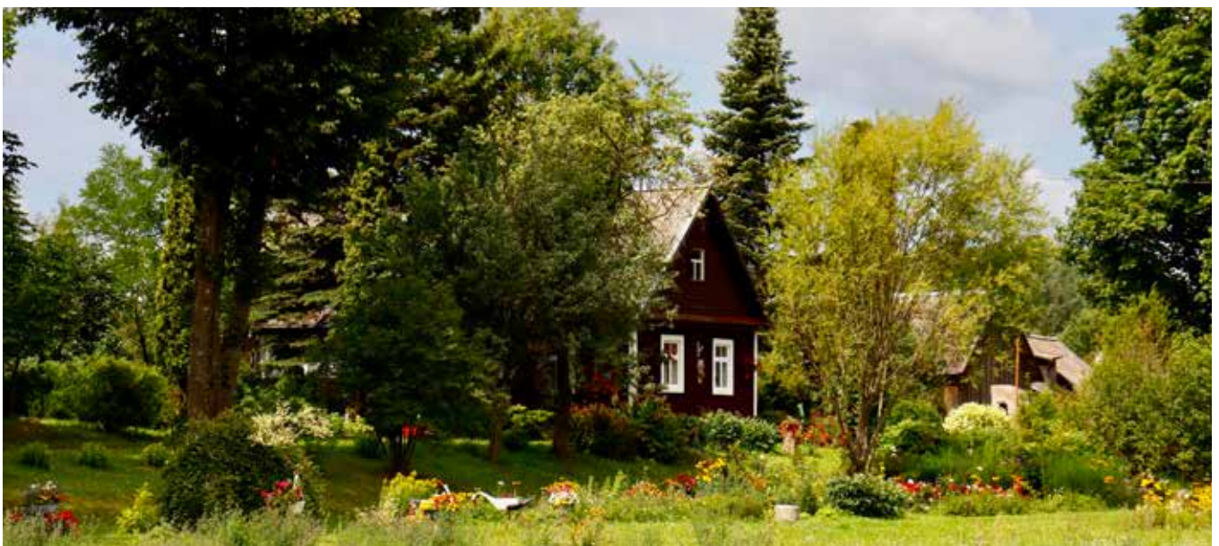
“LĪČUPES” Bebrenes pagastā