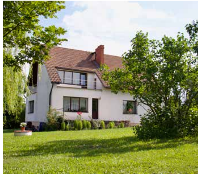
“STRAUMĒNI” Bebreņu pagastā

“Vai arī tā nav laime - sēdēt laukā un skatīties kā pāri laukiem rit saule”