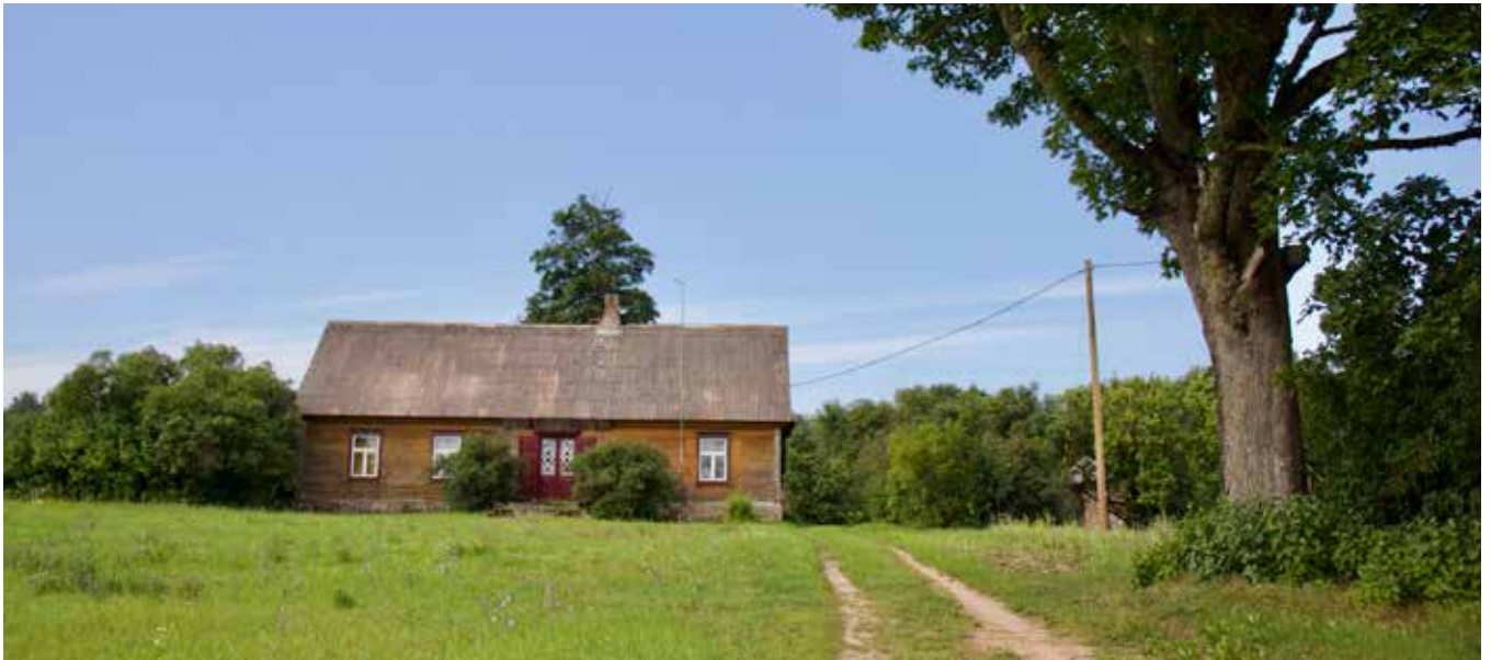
“VIRSAIŠI -2” Bebreņu pagastā