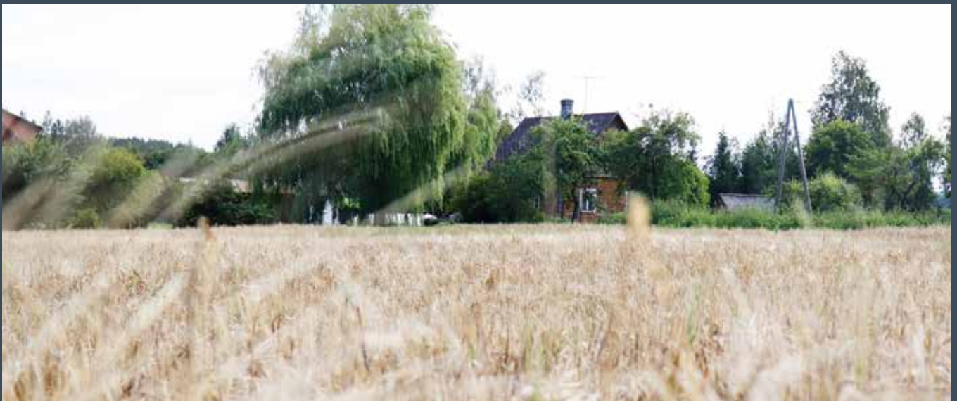
“ŪDRI” Bebrenes pagastā