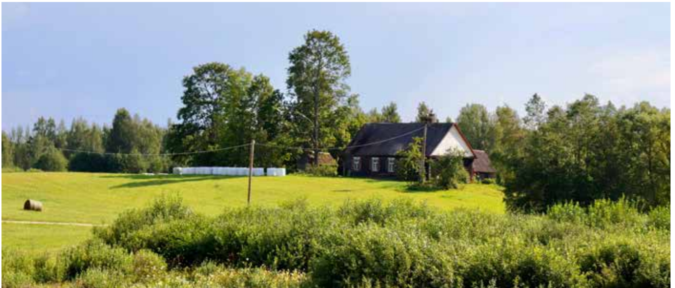
"IRBES" Prodes pagastā