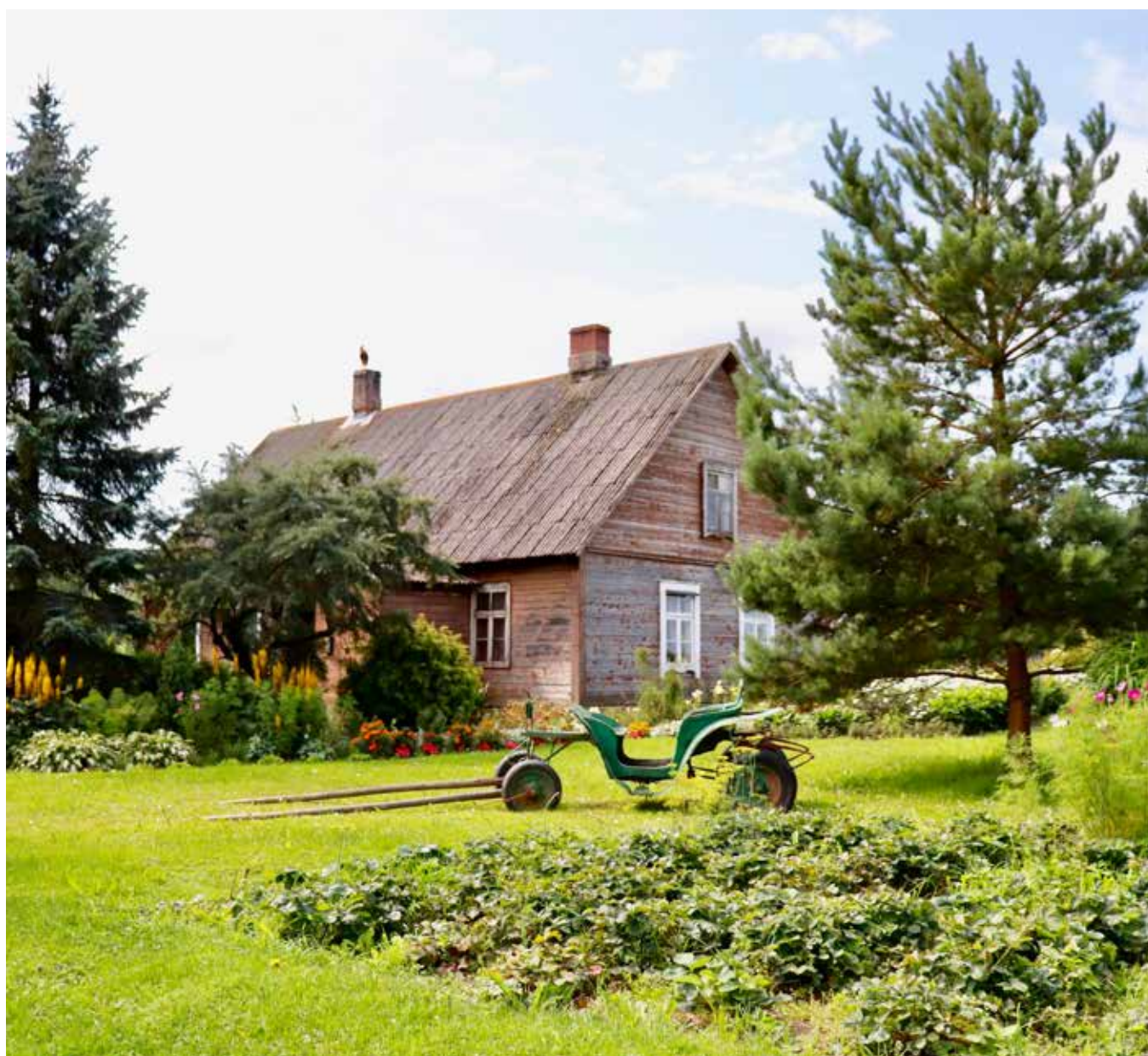
“BIRZTALAS” Bebrenes pagastā

..... “Ja tu spēj saskatīt skaistumu, tad tikai tāpēc, ka skaistums ir tevī pašā. Jo pasaule ir kā spogulis, kurā katrs redz sevi pašu.”