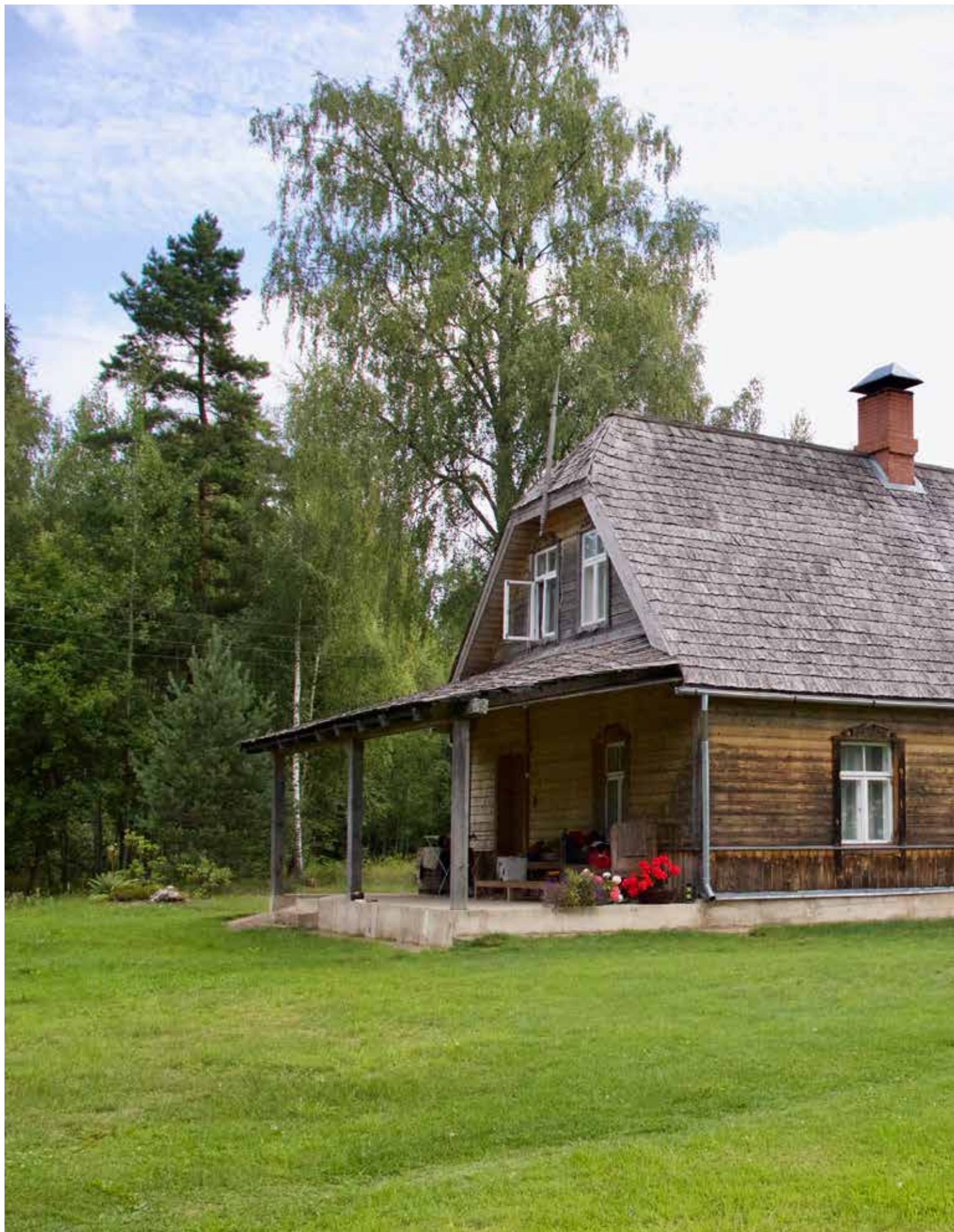
"KADIĶI" Bēbrenes pagastā