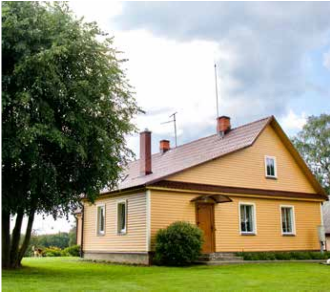
“LĪDAKAS” Dvietes pagastā