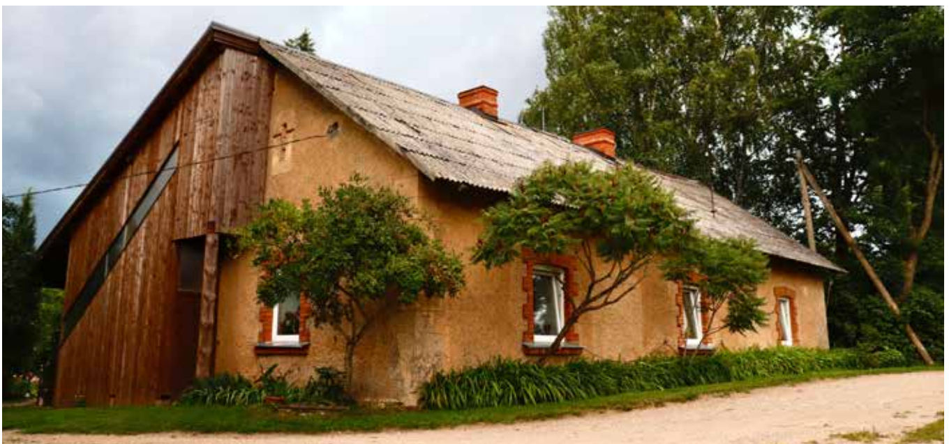
“DARBMĪĻI” Eglaines pagastā

“Prieks ir izstarot un izdalīt, izdalīt to, kas mums pieder, vienalga vai tā būtu maize, vai māja, doma vai sapnis, un zināt, ka ir kāds, kas to saņem”