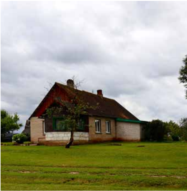
“SĪLI” Šēderes pagastā