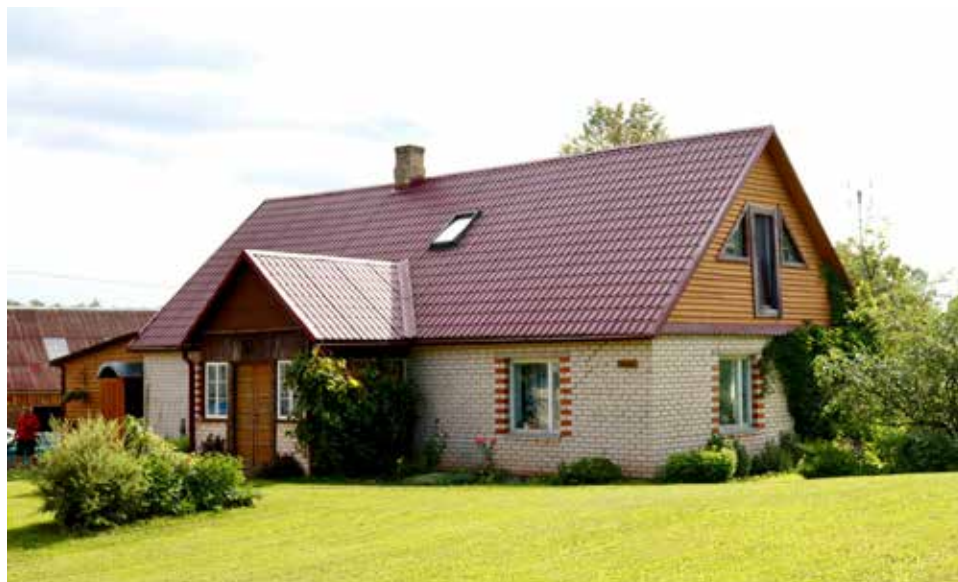
“SAUSIŅI” Bebreņu pagastā