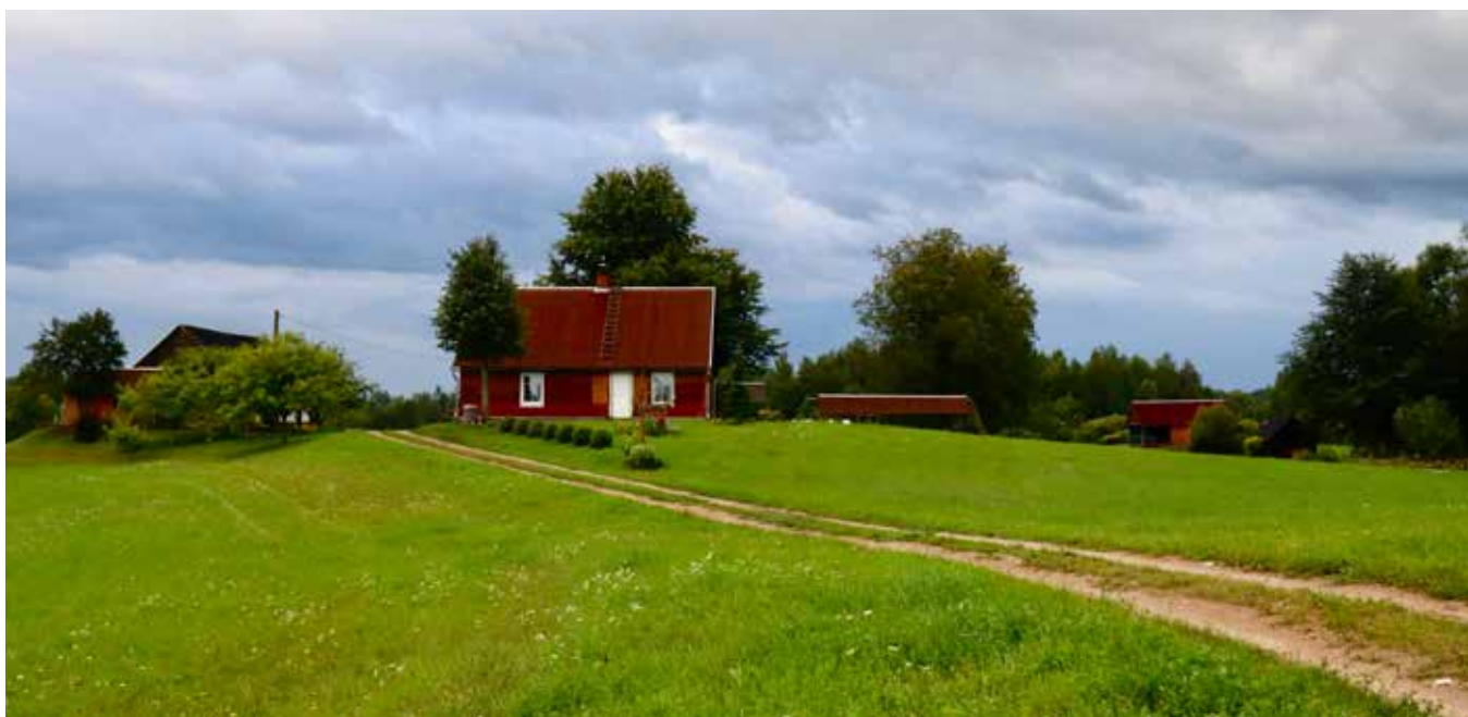
"KRASŅIŅI" Šēderes pagastā