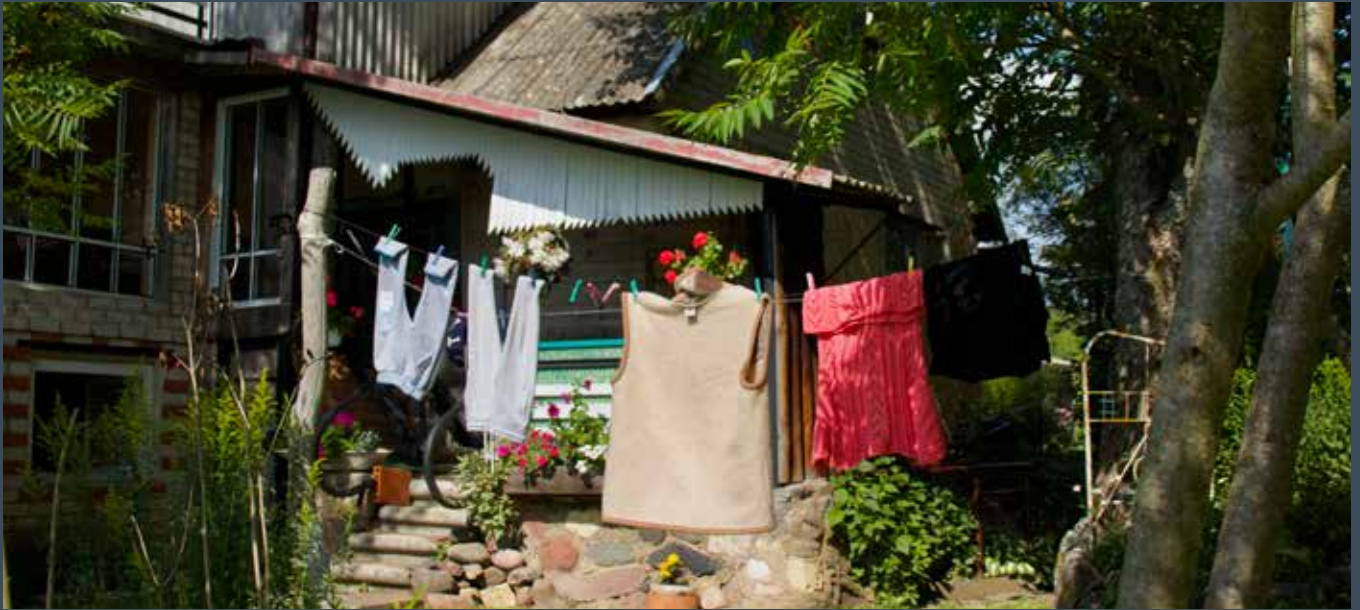
“SUDRABIŅI” Prodes pagastā