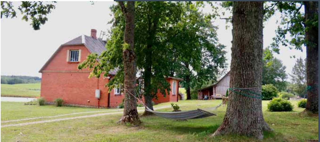
"STRAZDIŅI-1" Bebreņu pagastā