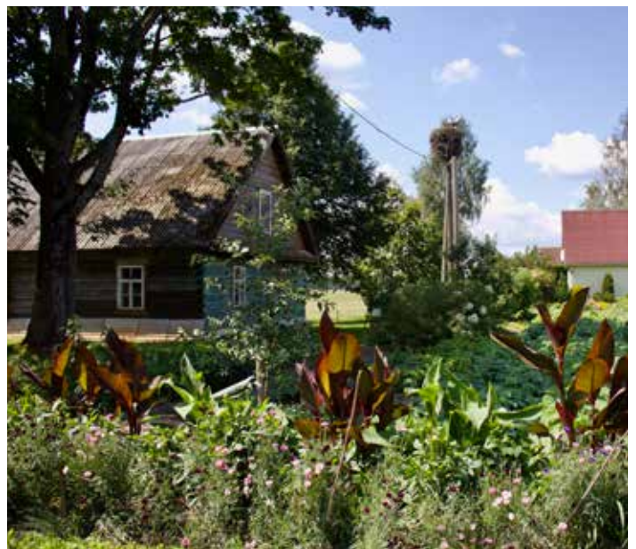
"BUNDZINIEKI UN OZOLĀJI" Dvietes pagastā