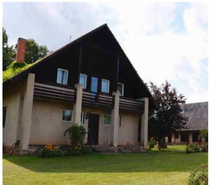
"DRUVĒNI" Bebrenes pagastā