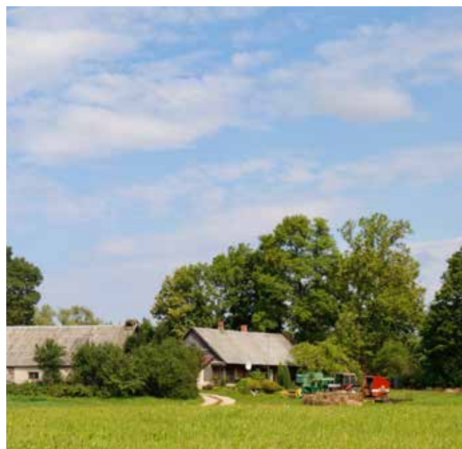
"DAĢI" Bebreņu pagastā