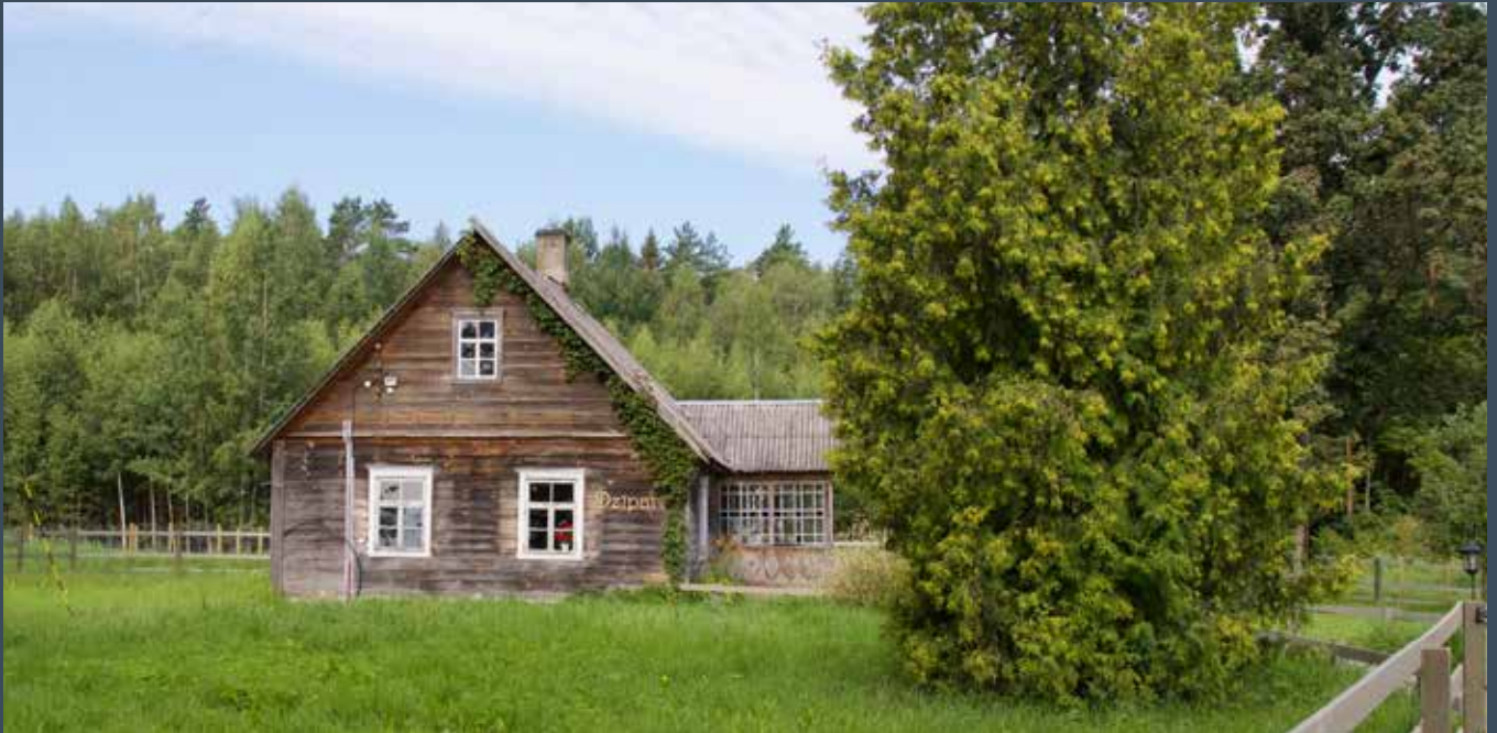
"DZĪPARI" Bebreņu pagastā