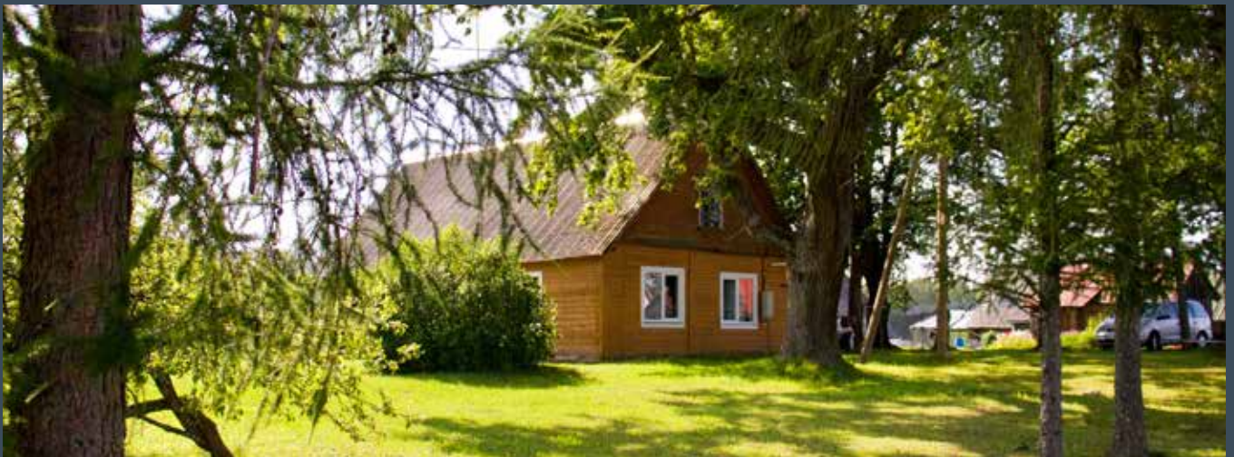
"PUTEKĻI" Prodes pagastā