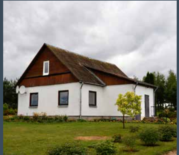
"DZINTARI" Šēderes pagastā