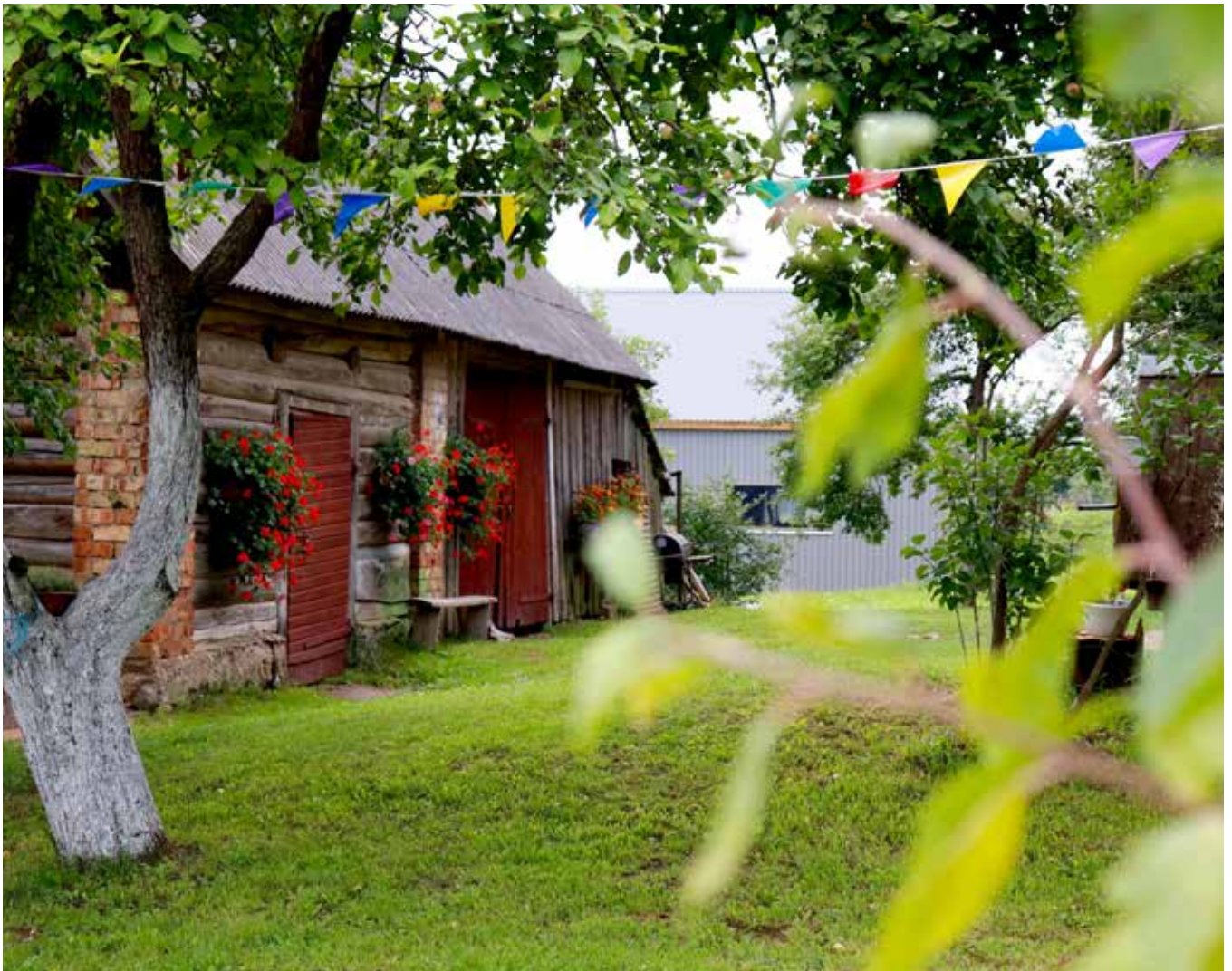
"SENLEJAS" Pilskalnes pagastā