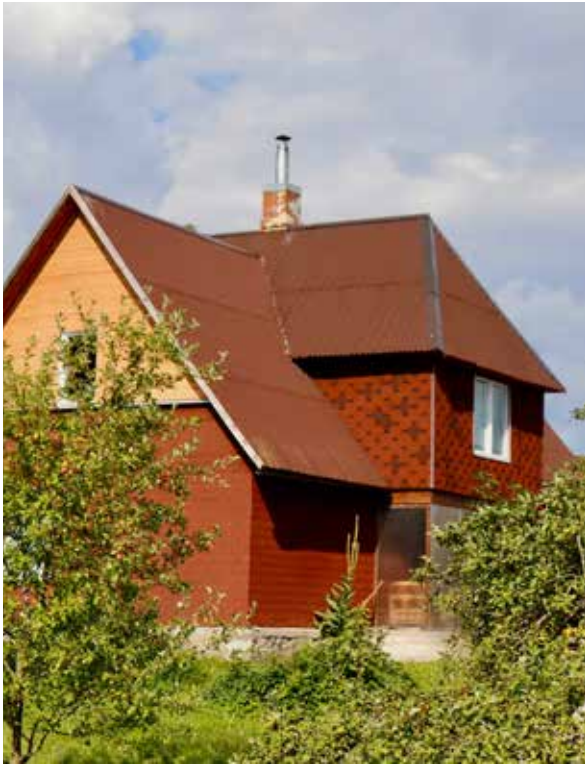
"LAPSIŅAS" Prodes pagastā