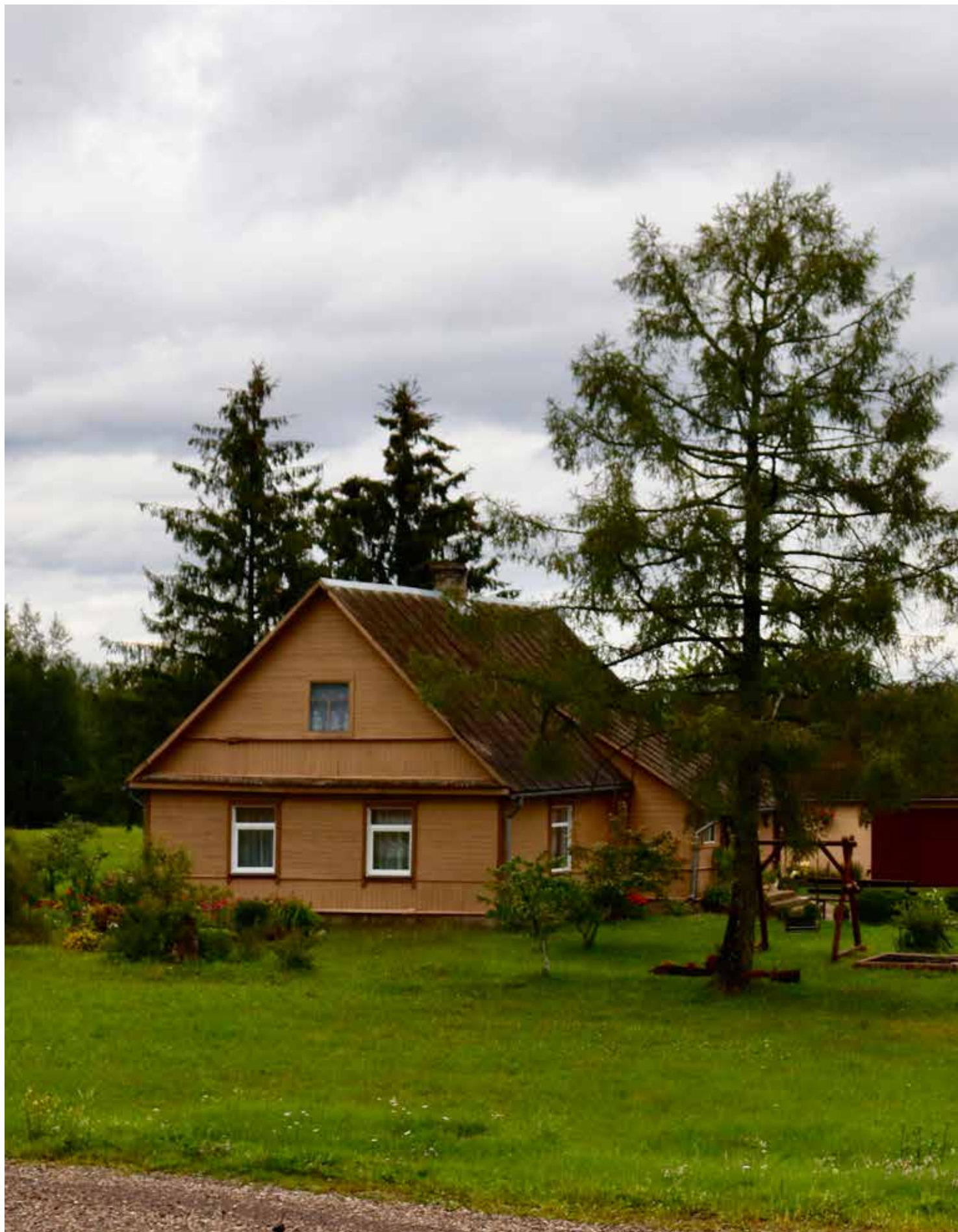
“DZEGUZES” Šēderes pagastā