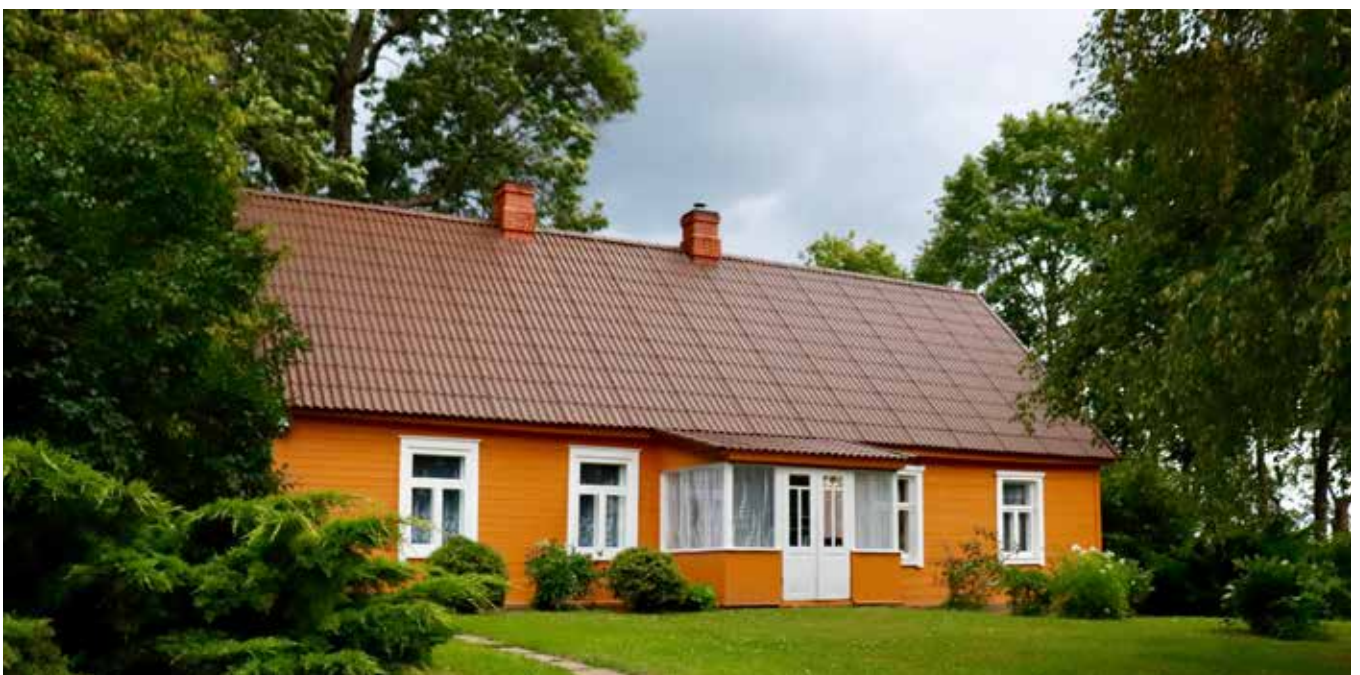
"TOMĀNI" Eglaines pagastā

“Pastiepsim pretim viens otram roku, ne lai ko ņemtu vai dotu, bet cits citu, lai justu, lai mēs turētos kopā”