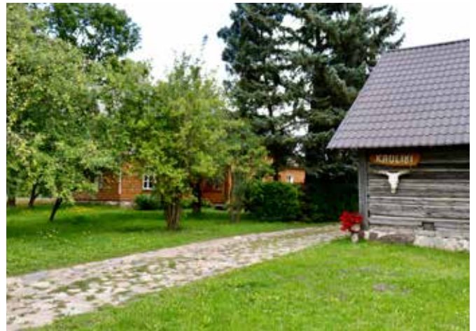
“KAULIŅI” Bebrenes pagastā