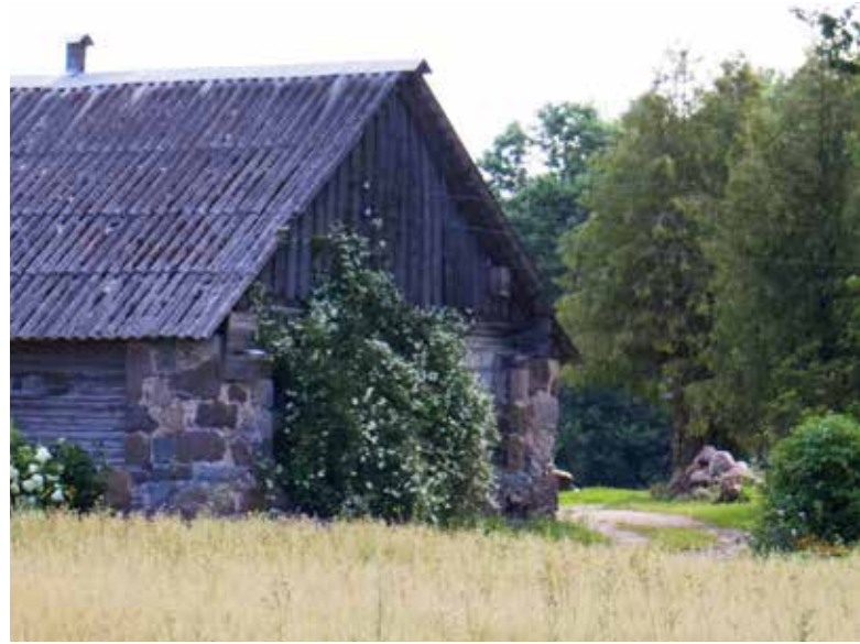
"VIRSAIŠI" Bebreņu pagastā

“Pastiepsim pretim viens otram roku, ne lai ko ņemtu vai dotu, bet cits citu, lai justu, lai mēs turētos kopā”