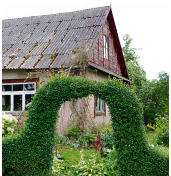
“ZĪPERI” Pilskalnes pagastā