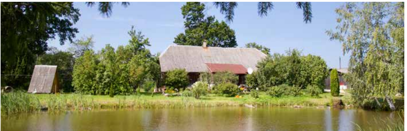
“CERĪBAS” Bebreņu pagastā