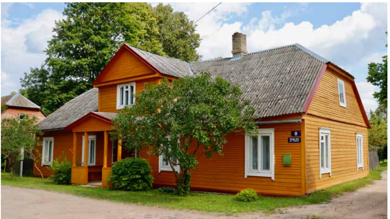
SUBATE Skolas iela 2

“Lai spētu dzīvē noturēt vietu, dvēselē jābūt avotam”