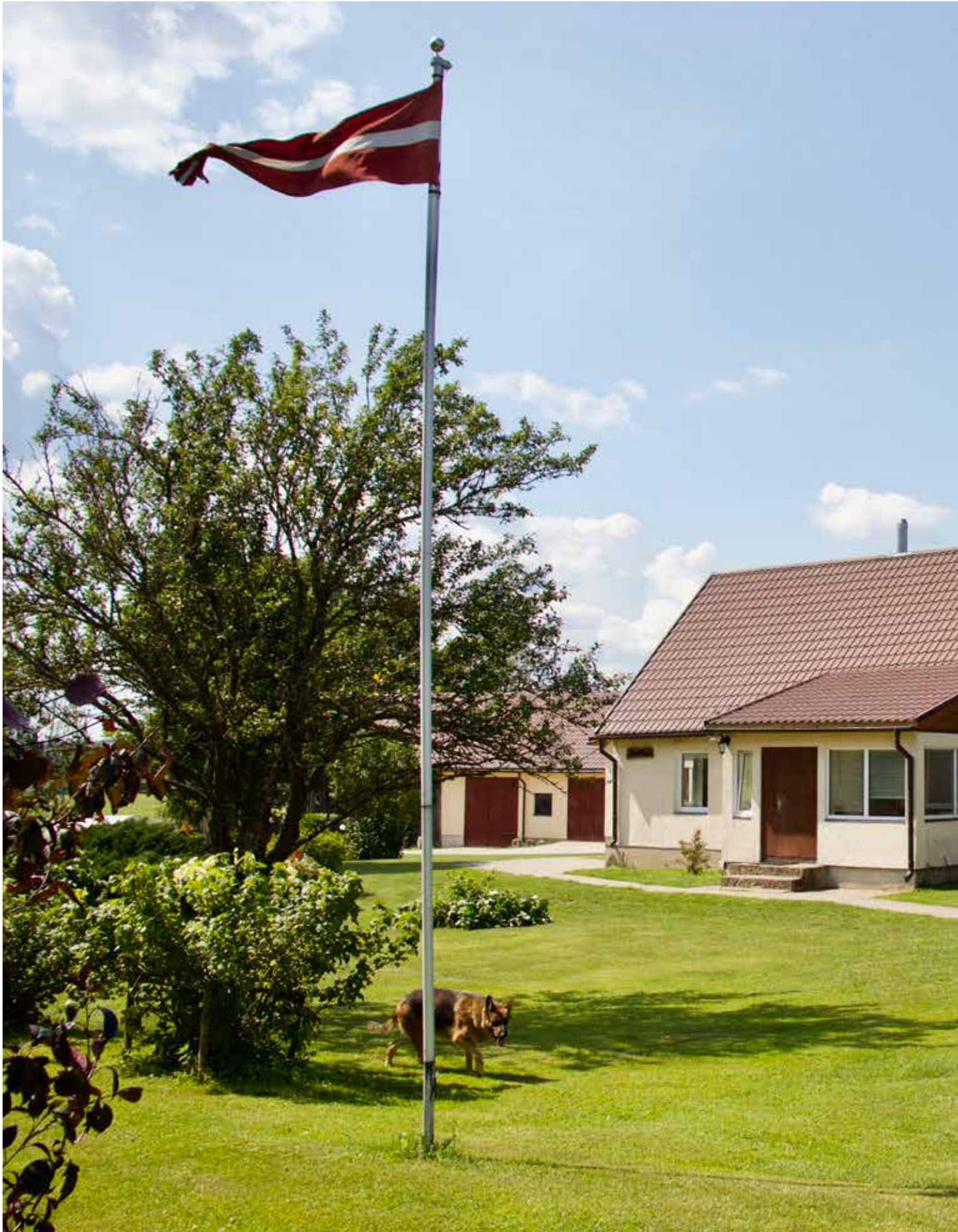
“OZOLIŅI” Dvietes pagastā