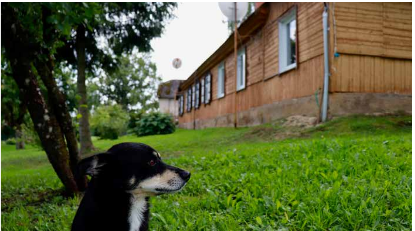
“LIEPKALNI” Pilskalnes pagastā

“Dažkārt var apceļoti visu pasauli, lai saprastu, ka dārgumu lāde ir aprakta pie mājas durvīm...”