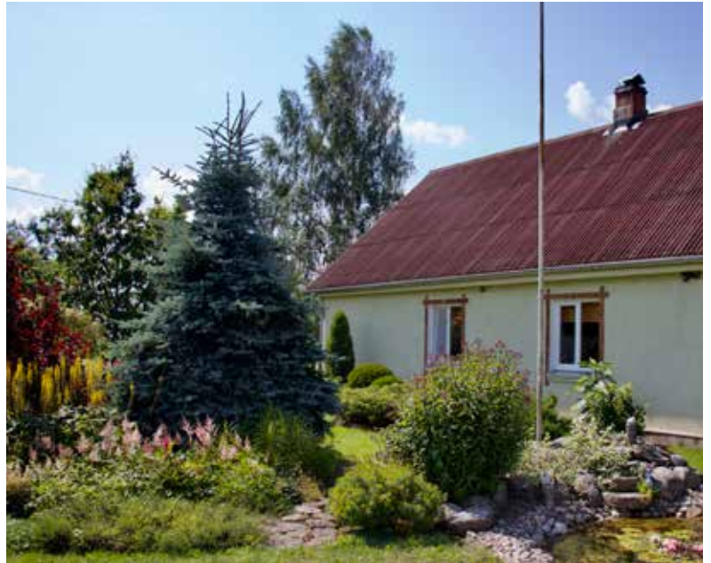
"BUNDZINIEKI" Dvietes pagastā