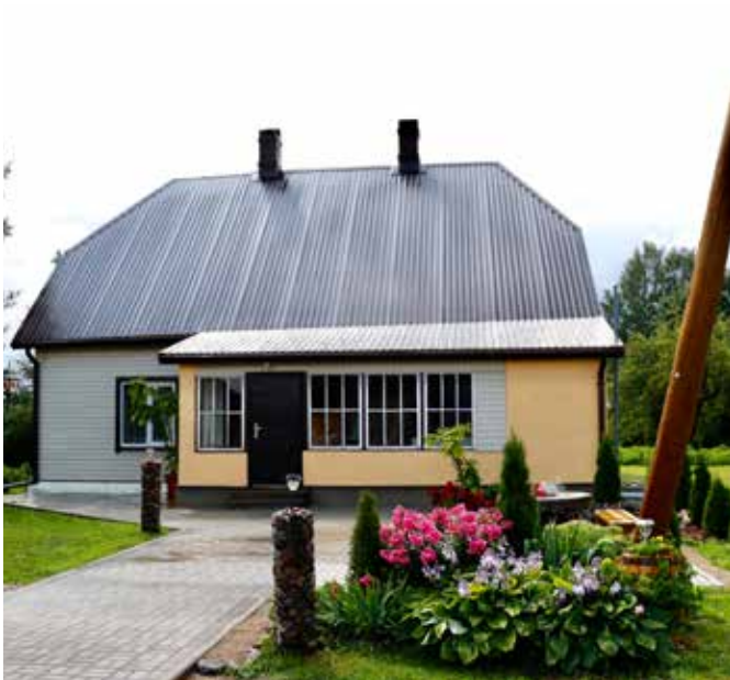
"AIZKALŅI" Eglaines pagastā