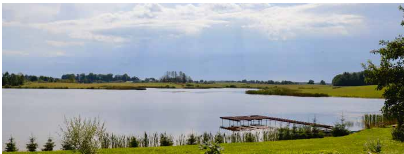
“KALNĀJI” Eglaines pagastā