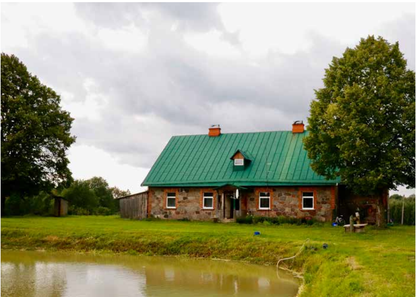
“NEIGŪTE” Eglaines pagastā