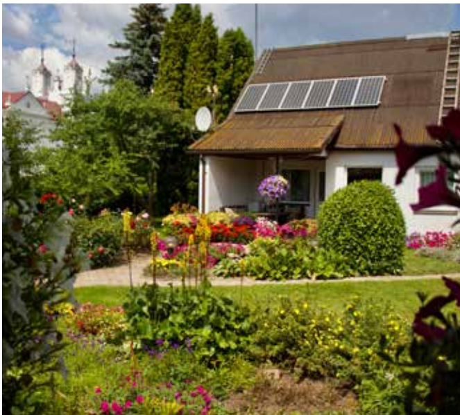
"RŪKĪŠI" Dvietes pagastā