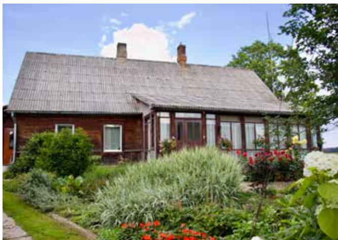
"PŪPOLI" Dvietes pagastā