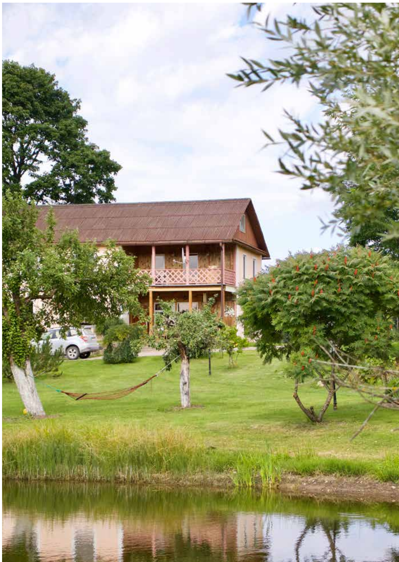
“TEIKAS” Bebrenes pagastā