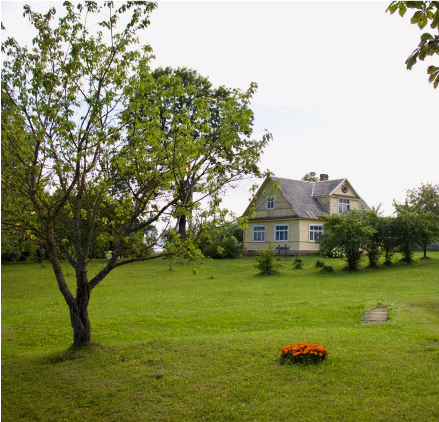
“IESALNIEKI” Bebrenes pagastā

“Ne tikai mēs atstājam pēdas ceļā, arī ceļš mūsos”