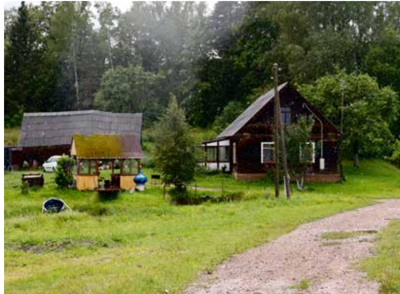
"UPESKALNI" Eglaines pagastā