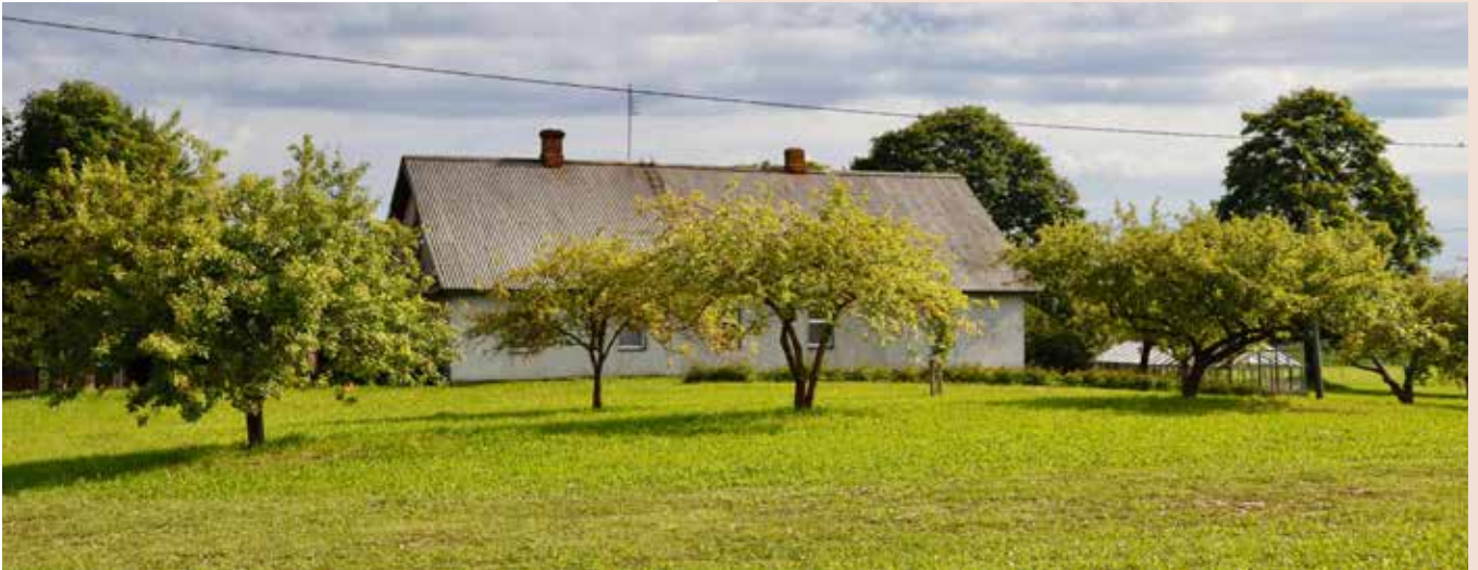
“VIRPOTĀJI” Bēbrenes pagastā