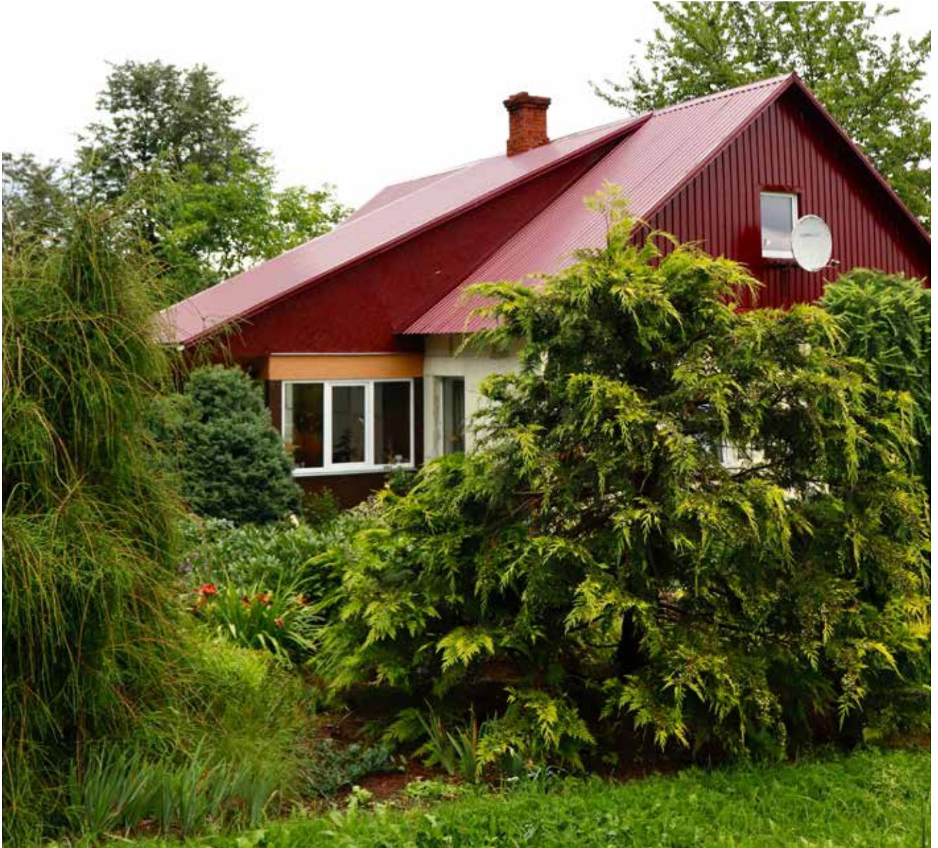
“LĪGOTŅI” Šēderes pagastā