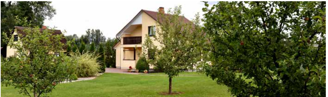
“STRAUMES” Šēderes pagastā

“Vai arī tā nav laime - sēdēt laukā un skatīties kā pāri laukiem rit saule”