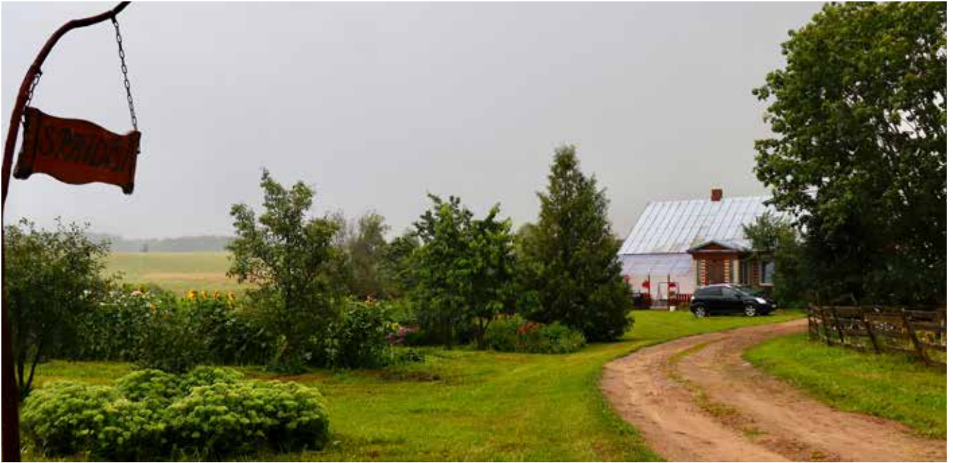
“SPRĪDĪŠI” Eglaines pagastā

“Dažkārt var apceļoti visu pasauli, lai saprastu, ka dārgumu lāde ir aprakta pie mājas durvīm...”