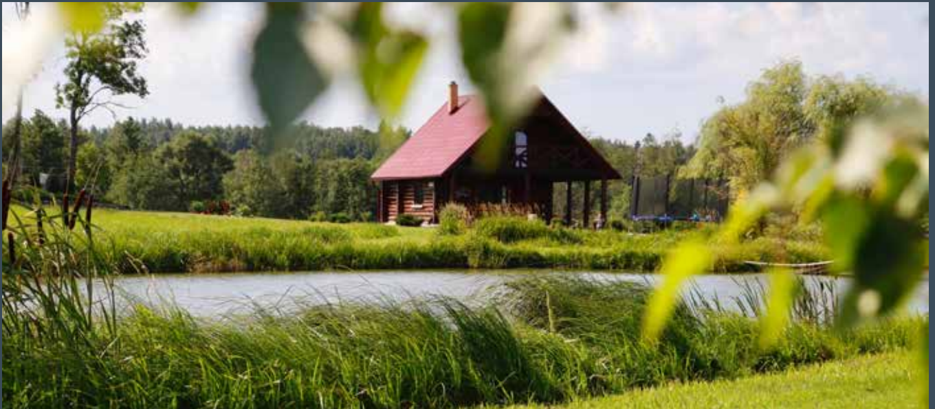
“RĪTI” Bebrenes pagastā