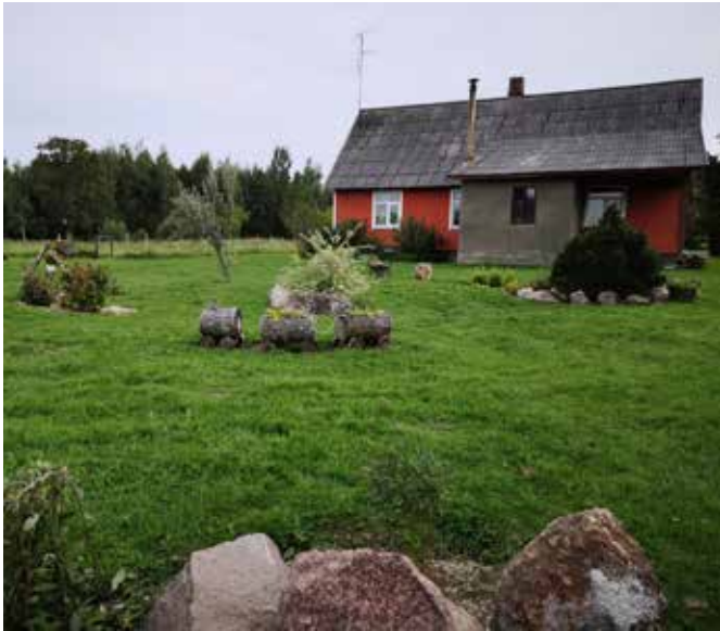
"ATMODAS" Bebrenes pagastā