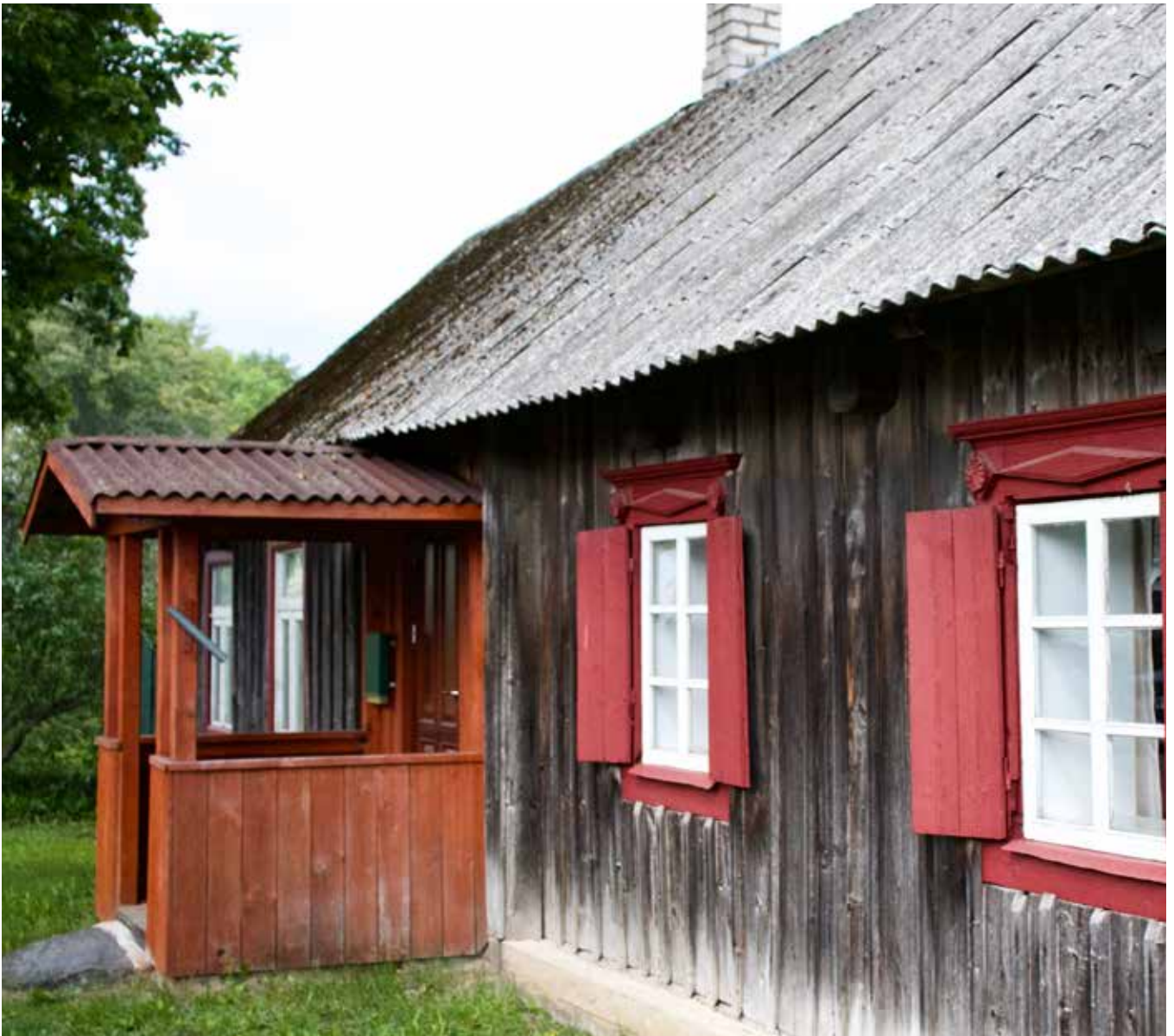
SUBATE Domes iela 36