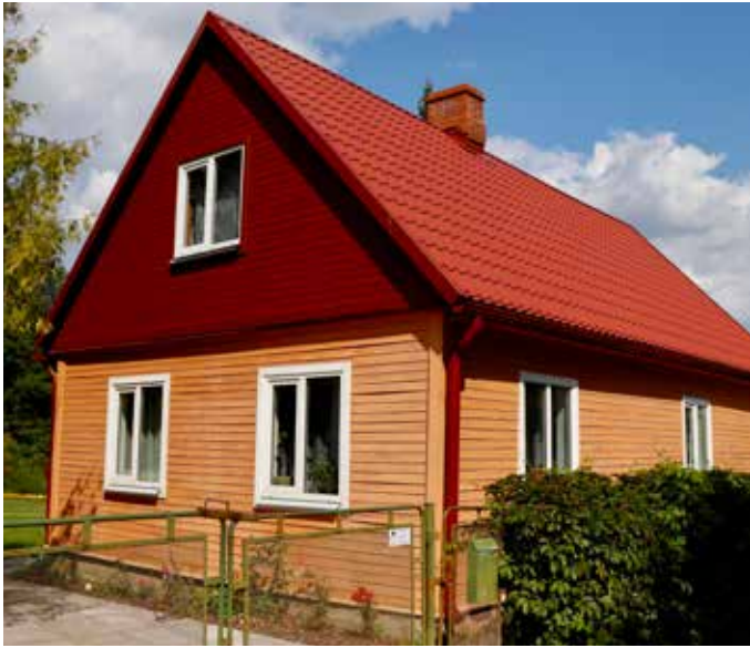
SUBATE Smilšu iela 5