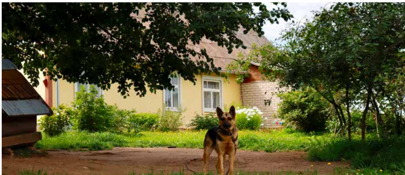
“MELDRI” Bebreņu pagastā