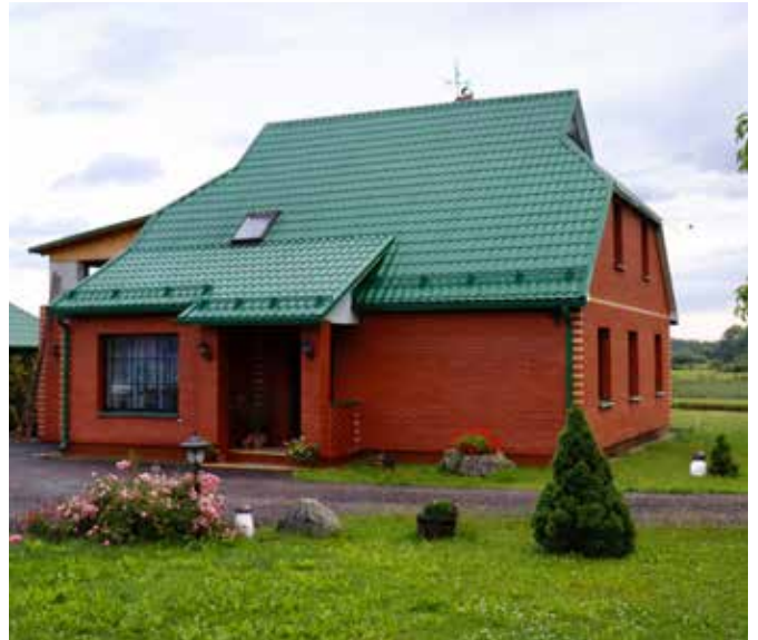
"OZOLIŅI" Šēderes pagastā