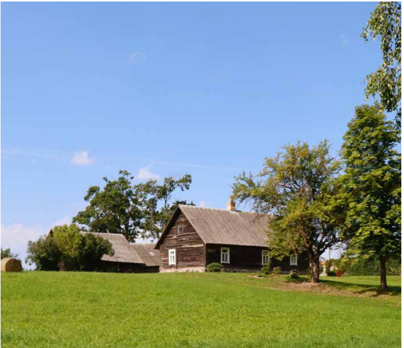
“GUĻĀNI” Bebrenes pagastā