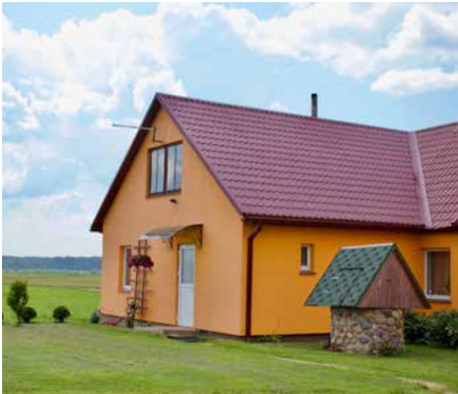
"LAURI" Dvietes pagastā