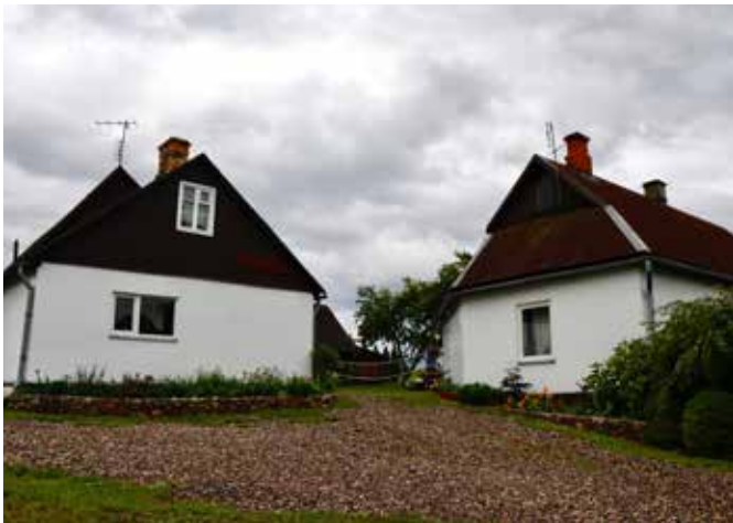
“CIEMATS” Šēderes pagastā