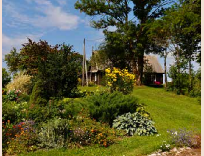
“UPENES” Bēbrenes pagastā

“Katram ir vajadzīgs savs sapnis, sava dvēseles svētdiena”