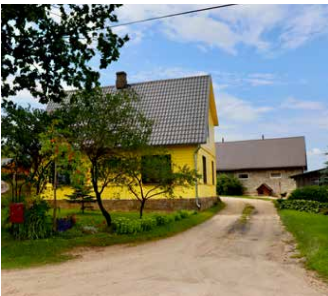
"SAULES" Bebrenes pagastā