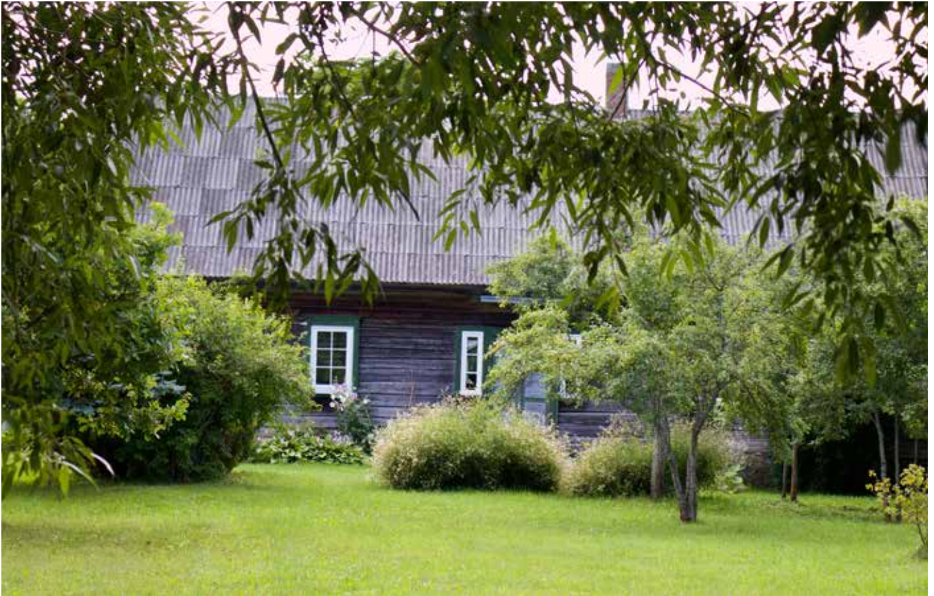
“ATĀLI” Bebreņes pagastā