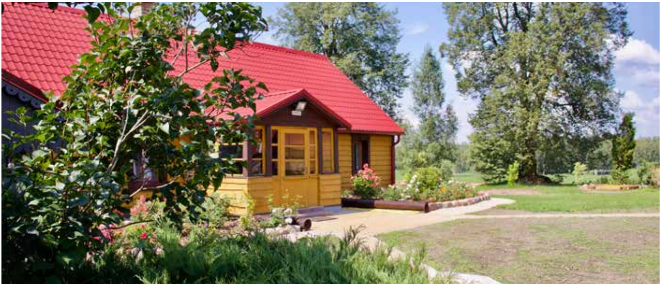
“SKAISTKALNI” Dvietes pagastā