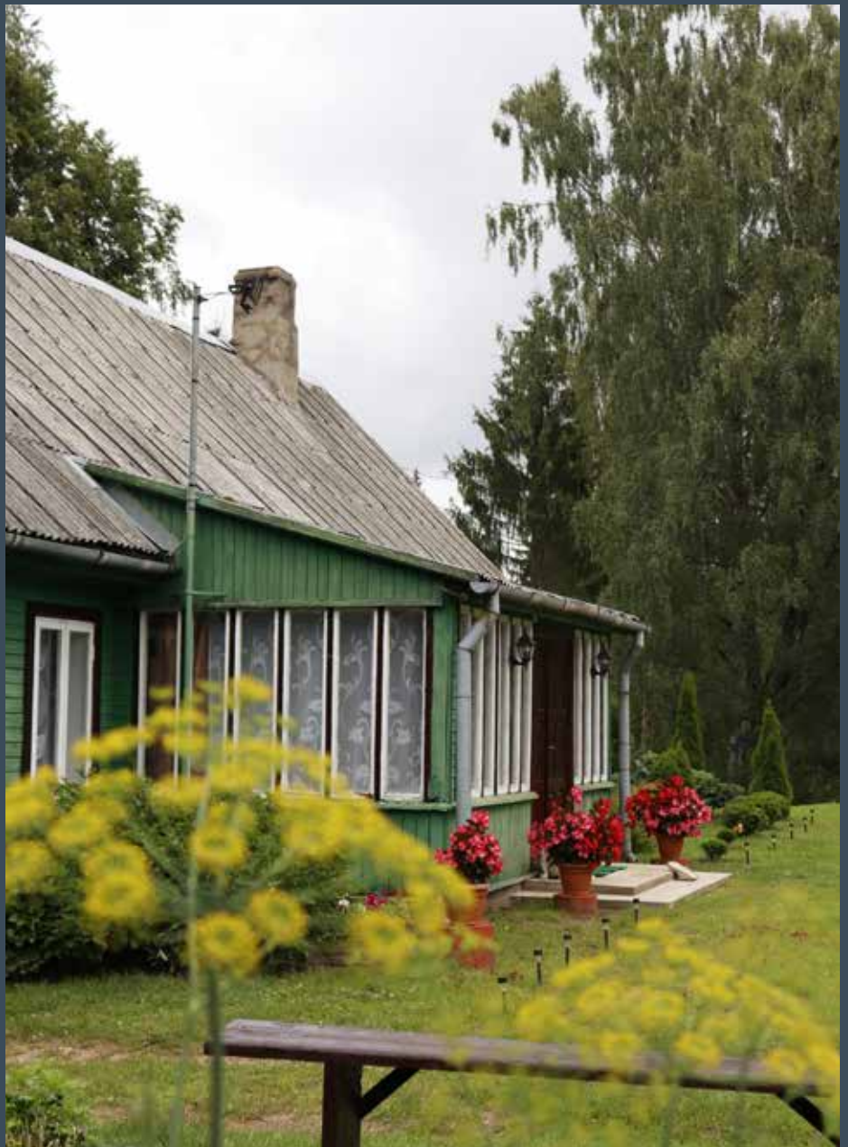
“CELMI” Pilskalnes pagastā