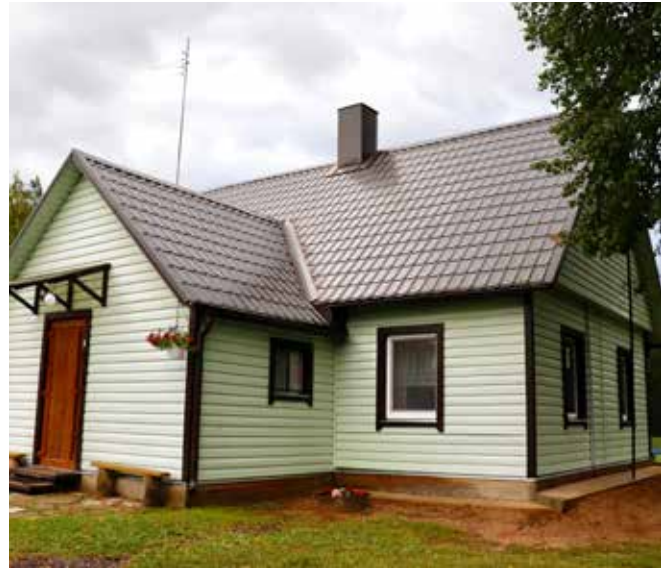
“DĀBOLIŅI” Šēderes pagastā