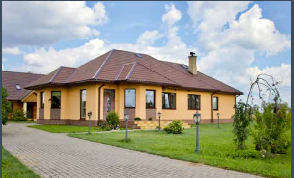
“ZAĶĪŠI” Dvietes pagastā