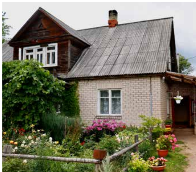
"SALNAS" Eglaines pagastā