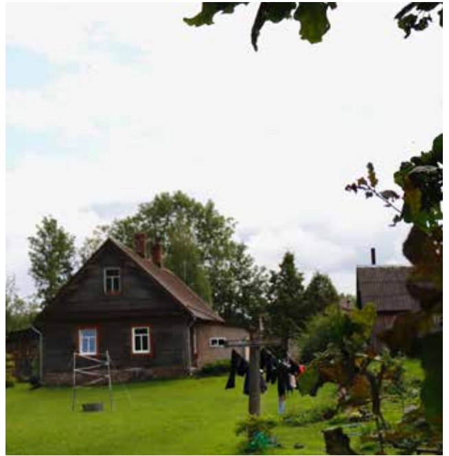
“ROŽLAUKI” Pilskalnes pagastā

“Prieks ir izstarot un izdalīt, izdalīt to, kas mums pieder, vienalga vai tā būtu maize, vai māja, doma vai sapnis, un zināt, ka ir kāds, kas to saņem”