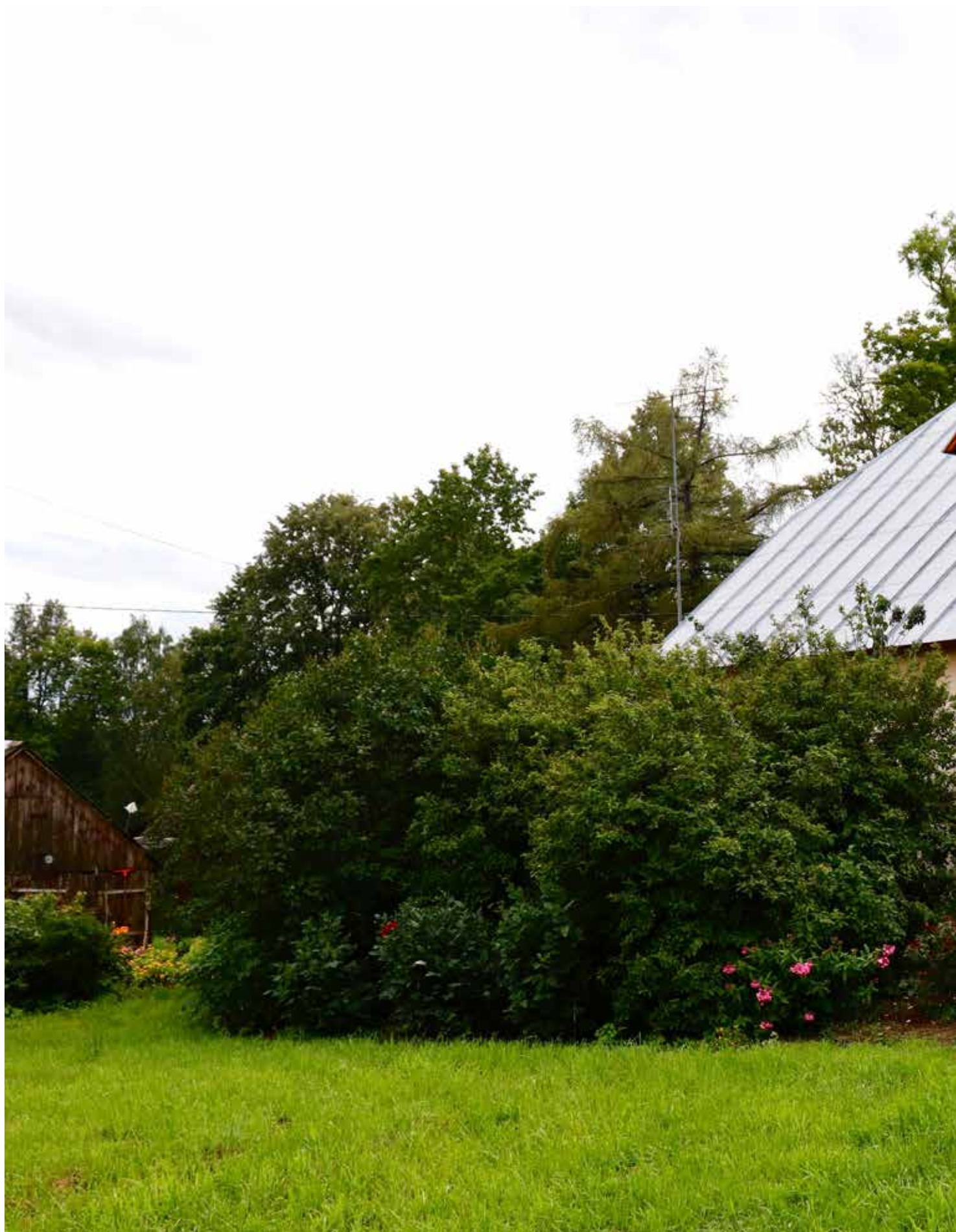
“LIEPKALNI” Eglaines pagastā