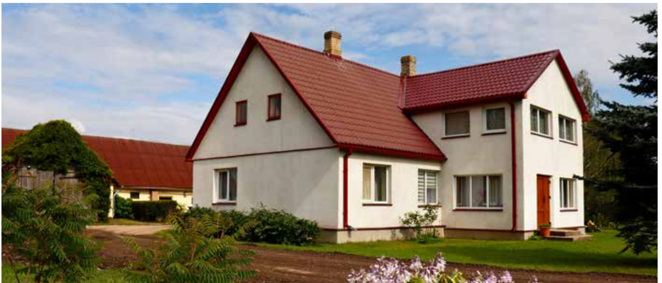
“KĪEGEĻI” Pilskalnes pagastā