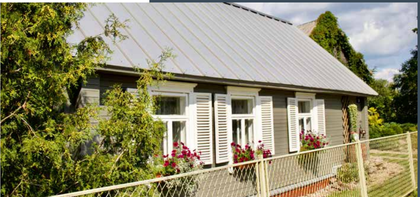
SUBATE Smilšu iela 9