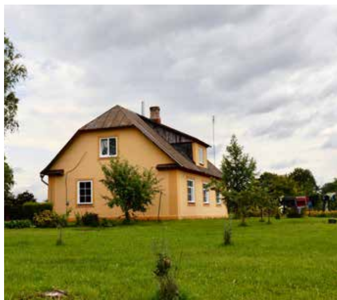
"GRAUDI" Bebrenes pagastā