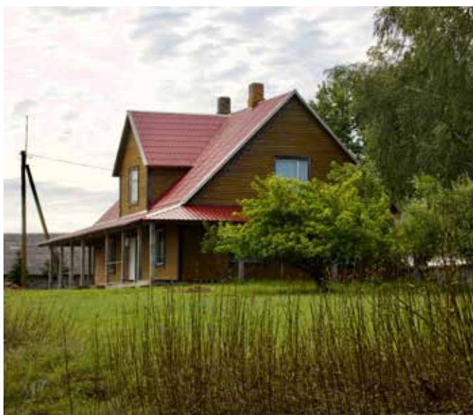
"ATAUGAS" Bebrenes pagastā