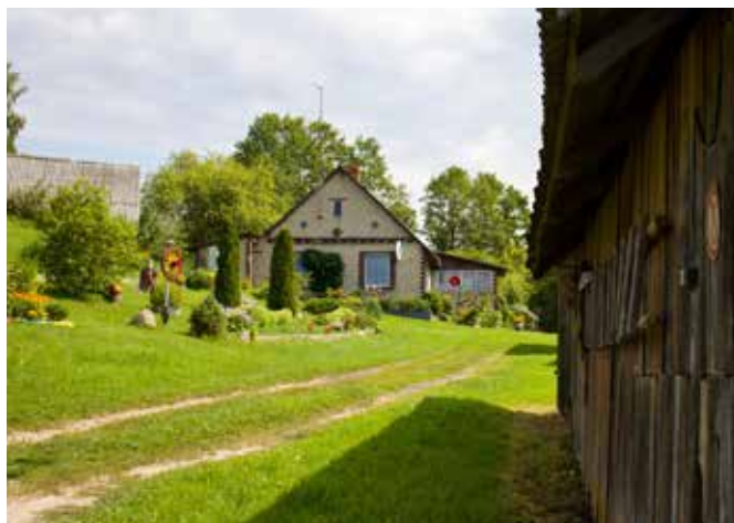
"ROŽLAUKI" Bebreņu pagastā