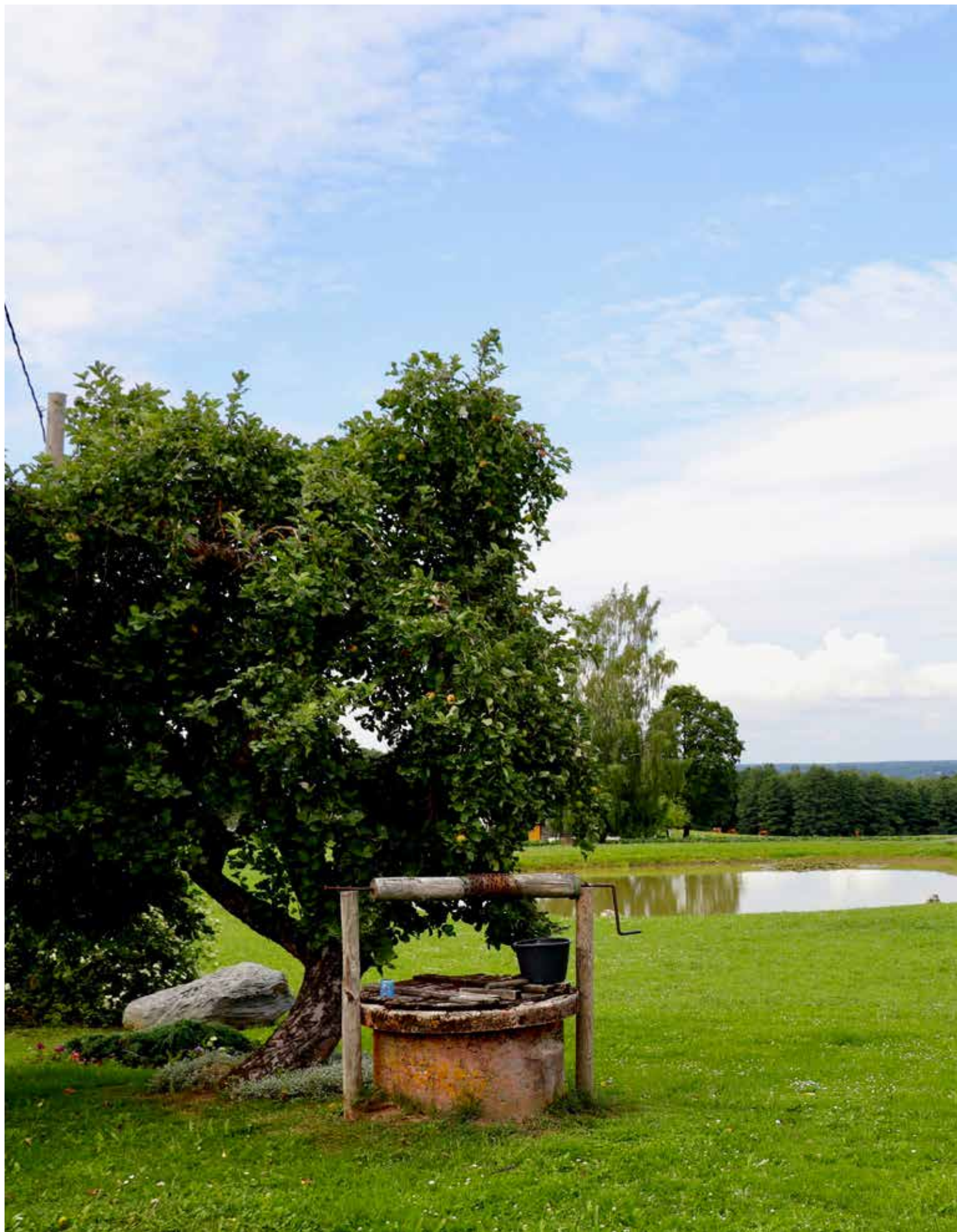
“LIELCEĻI” Pilskalnes pagastā