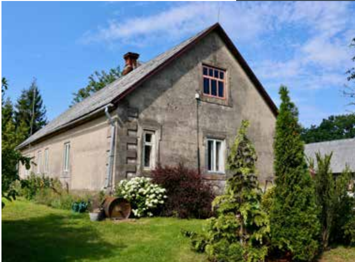
"IGNALIŅI" Bebreņu pagastā