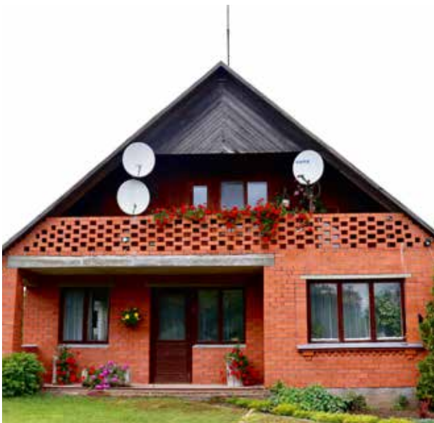
"KRSTMALAS" Šēderes pagastā