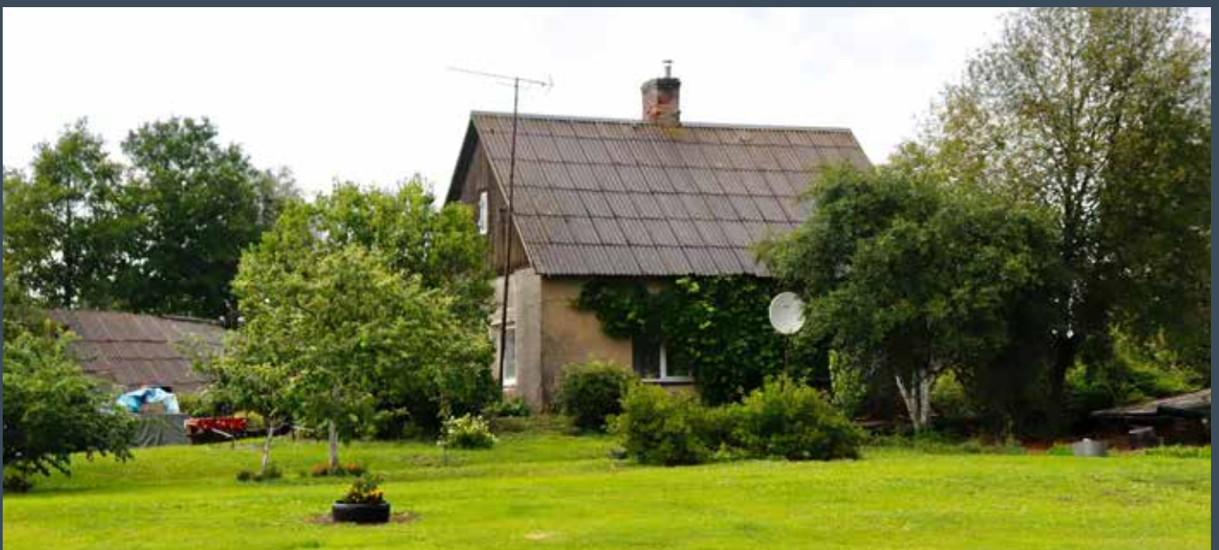
"LĪDAKAS 1" Eglaines pagastā