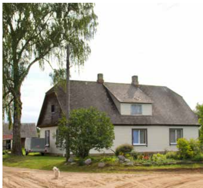
"UPMALAS" Bebrenes pagastā