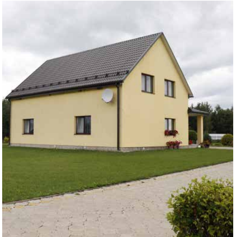
"SUDRABIŅI" Šēderes pagastā