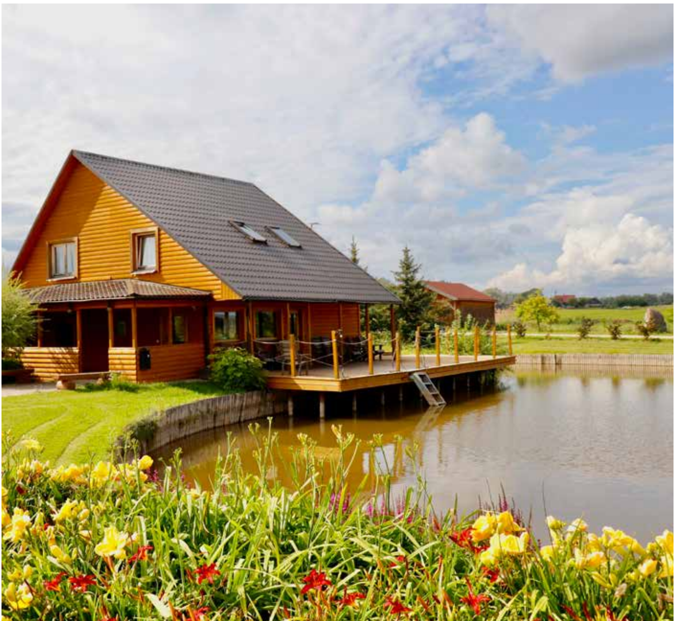
“DZINTARI” Pilskalnes pagastā