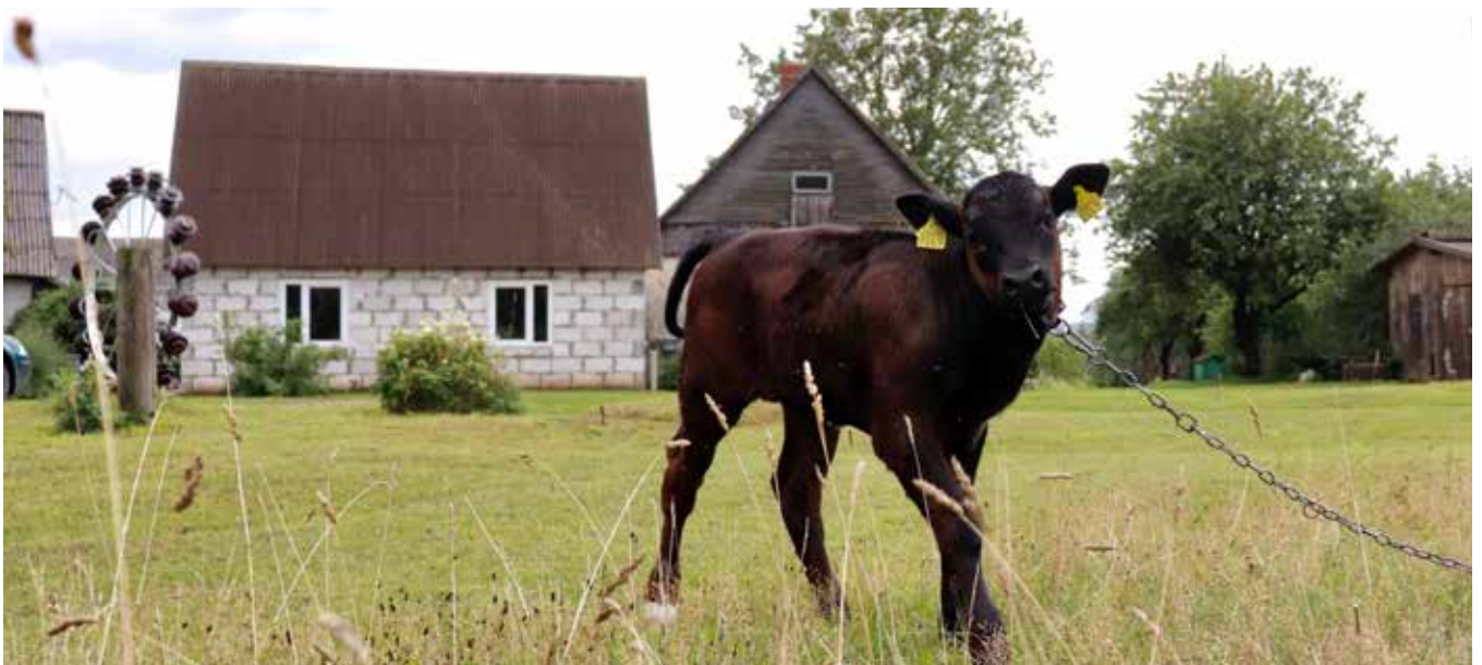
“BUMBIERI” Eglaines pagastā