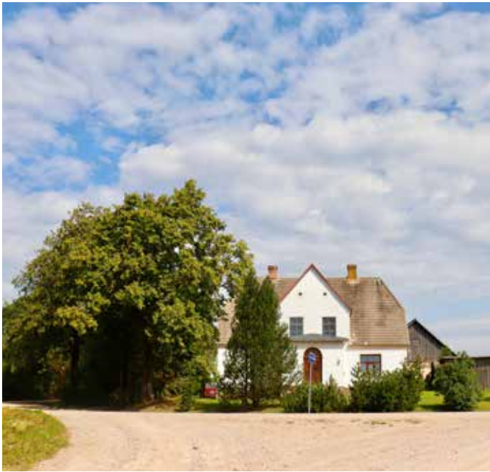
“MŪRENE” Bebrenes pagastā