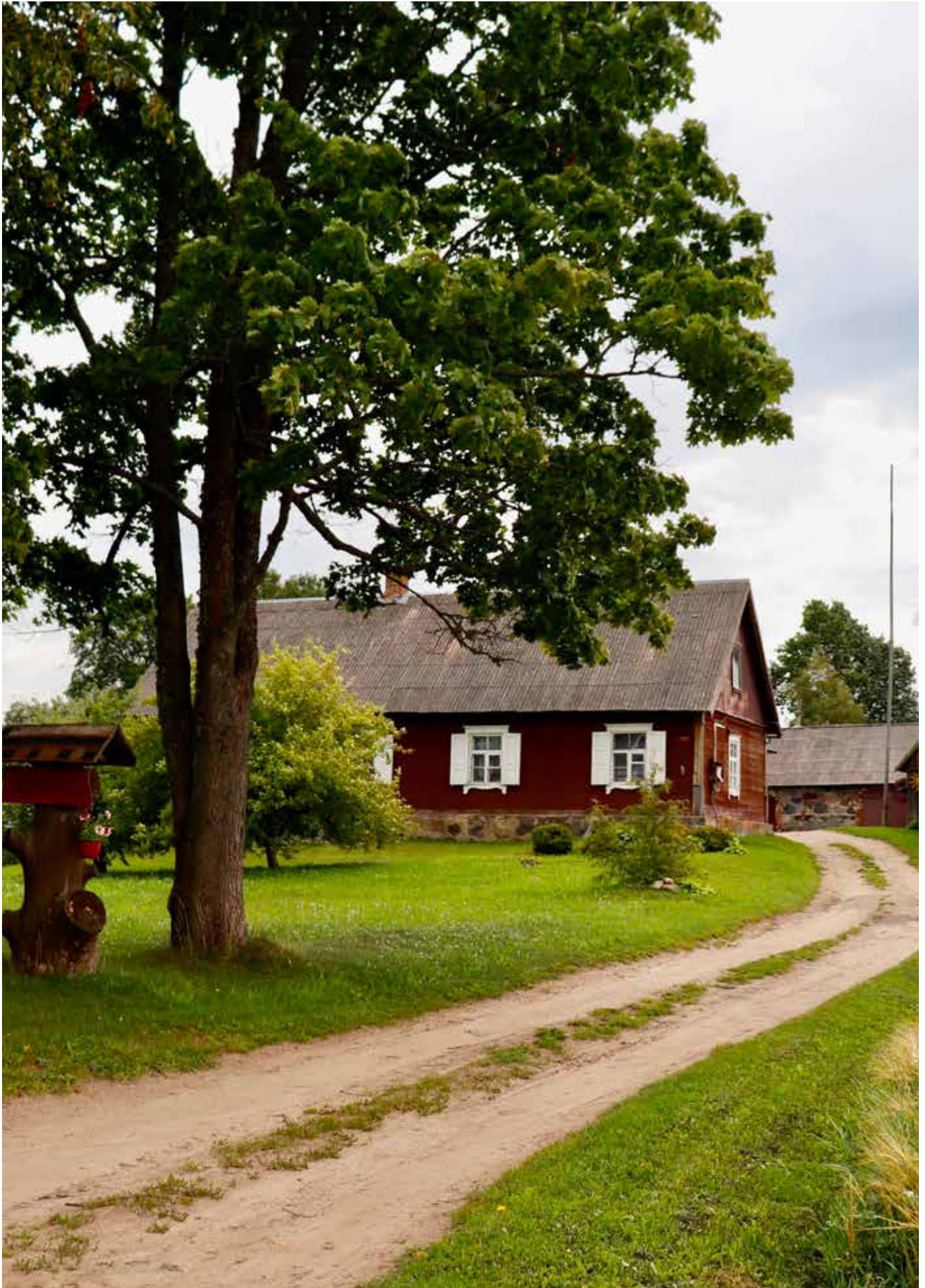
"RUPŠENE" Bēbrenes pagastā