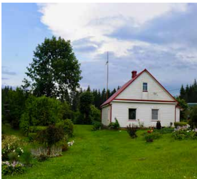
"ROBEŽNIEKI" Šēderes pagastā