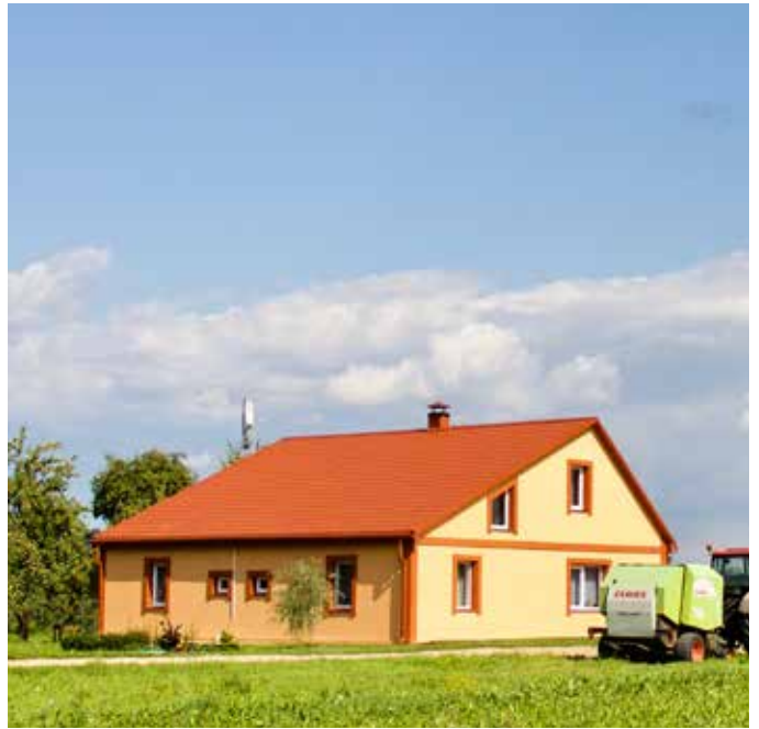
“RĪTIŅI” Prodes pagastā