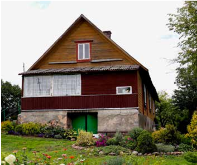
“KALNI” Pilskalnes pagastā