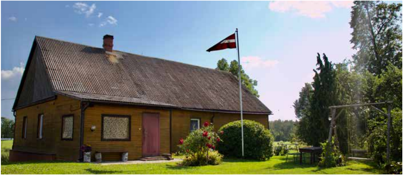
"PRIEDNIEKI" Prodes pagastā