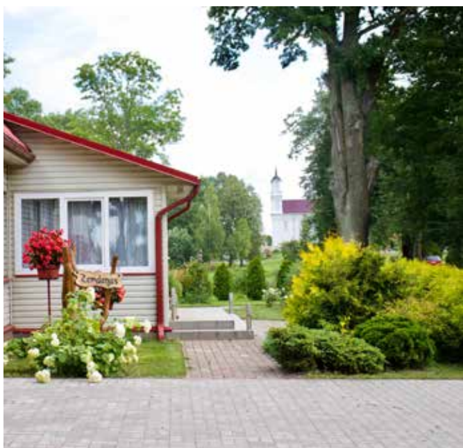
"ZEMDEGAS" Dvietes pagastā