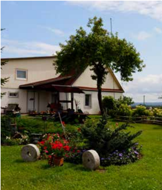
"MEDNIEKI" Pilskalnes pagastā