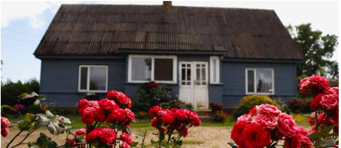
“VIENĪBAS” Pilskalnes pagastā