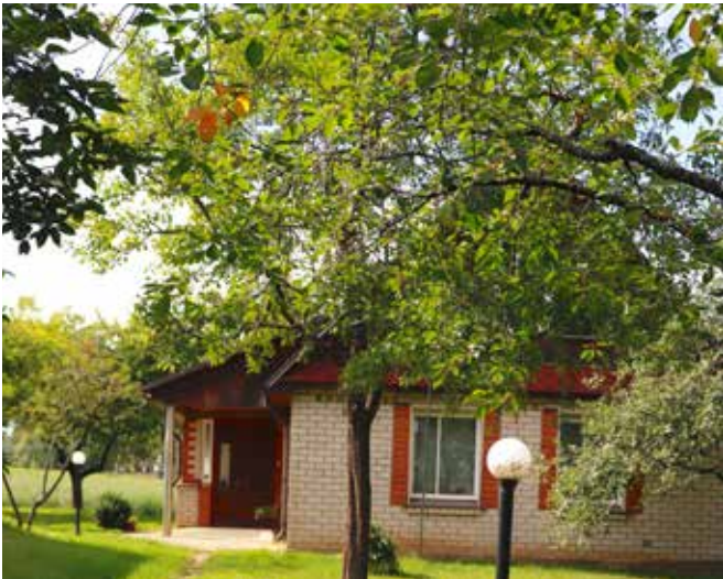
“SAULKRASTI” Pilskalnes pagastā