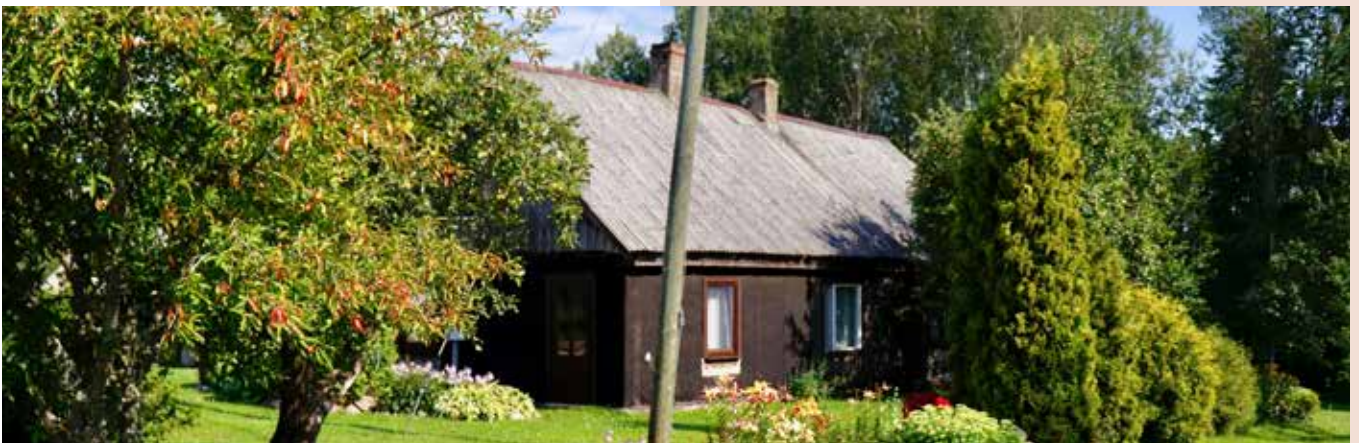
“BIRZTALAS” Prodes pagastā

“Katram ir vajadzīgs savs sapnis, sava dvēseles svētdiena”