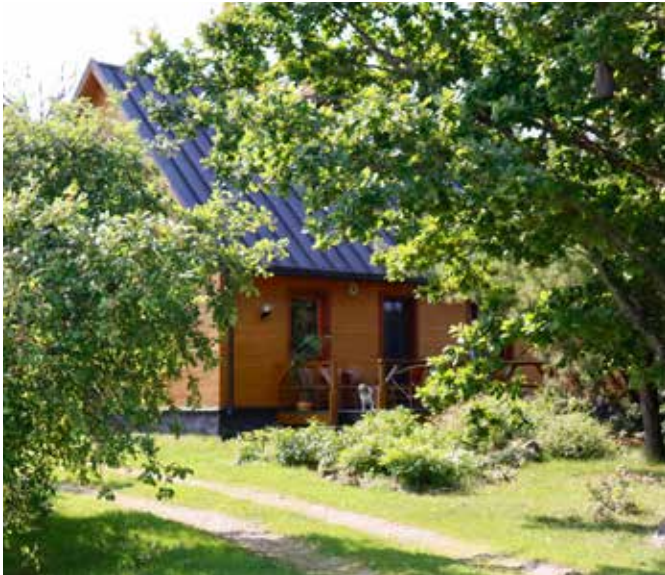
"ZELTLAPAS" Bebrenes pagastā