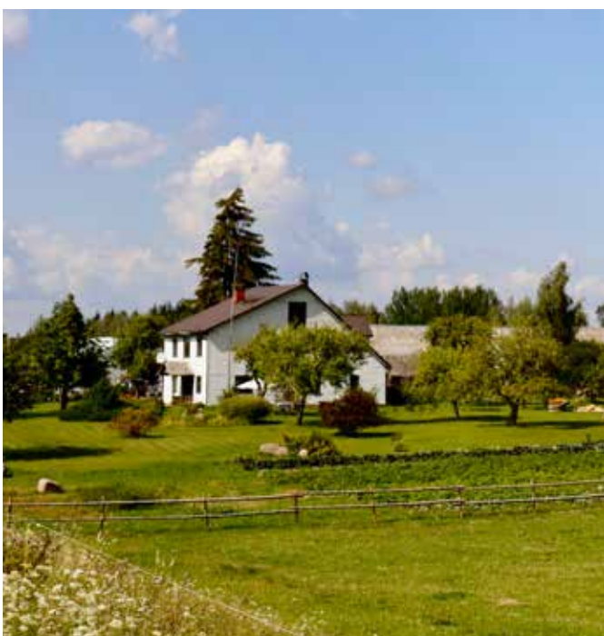
“DZEŅI” Prodes pagastā