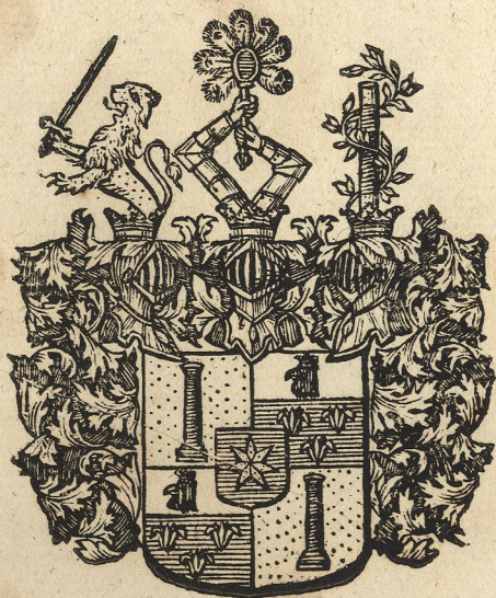
47. GYLLENSTIERNA af Foglewijk. †.

Nies Gyllenstierna til Foglewijk in den Grafskapet Upsala 1706. d. 20. Junij introd. 1719.