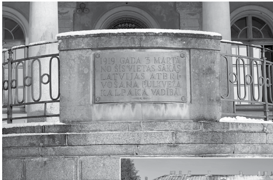
1919. gada 3. martā no Rudbāržu muižas sākās Latvijas atbrīvošana pulkveža Oskara Kalpaka vadībā.

Lēmums ēkas nodot AM tapa saistībā ar to, ka iepriekš Raņķu pagastā novada dome NBS vajadzībām nodeva bijušo Padomju armijas poligona Mežaine , un infrastruktūras uzlabošanā, arī ceļos, savu naudu iegulda bruņotie spēki.