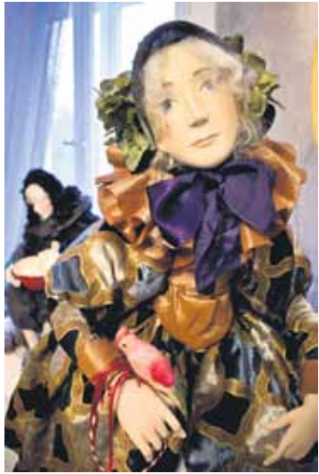
Viena no Ināras Liepas darinātajām lellēm.