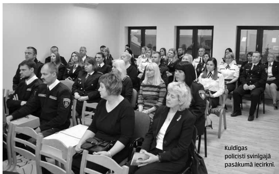
Kuldīgas policisti svinīgajā pasākumā iecirknī.

Ik gadu 5. decembrī tiek svinēta Latvijas Valsts policijas (VP) dibināšanas gadskārta. Arī šajā gadā par godu svētkiem gan Kuldīgā, gan Talsos notika svinīgie pasākumi, kuros apbalvoja labākos no labākajiem policistiem.