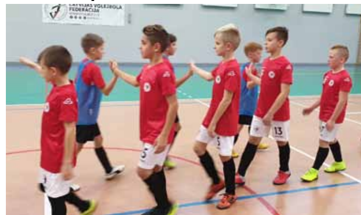
Pēc spēles jāatsveicinās. Priekšplānā – Kuldīgas U11 grupas futbolisti.