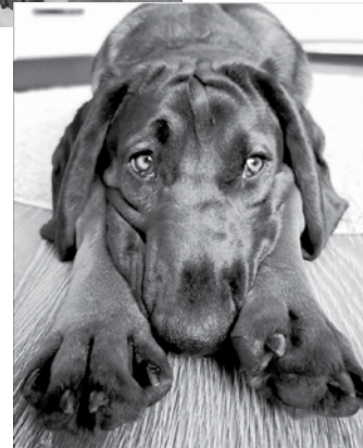
Bavārijas asinspēdu dzinējsuņi ir aktīvi, un tiem ir mednieka instinkts.