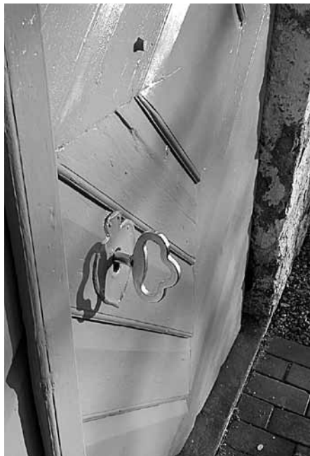
Valtaiķu baznīcā ienācējus sagaida svaigi restaurētas durvis.

Laidu pagasta Valtaiķu dievnamā restaurētas durvis un lielā atslēga. To paveikusi Aizputes evaņģēliski luteriskā draudze, kuras pārzīnā šī celtnē neseno nonākusi.