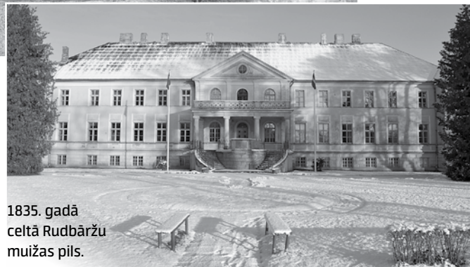
1835. gadā celtā Rudbāržu muižas pils.

Rudbāržu skola izvēlēta, ņemot vērā vairākus argumentus. Pirmais – AM vēlējusies specializēto