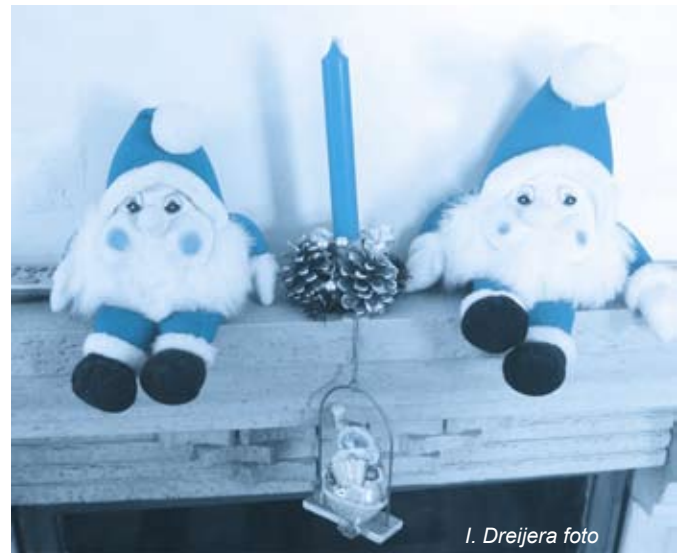
I. Dreijera foto

Pārskatot mūsu novadā paveikto, ir pamats ticēt - tā attīstība turpināsies, un 2011. gadā mēs saglabāsim ticību sev, savai zemei un novadam. Palīdzēsim viens otram ar labu darbu un labu vārdu. To, ko