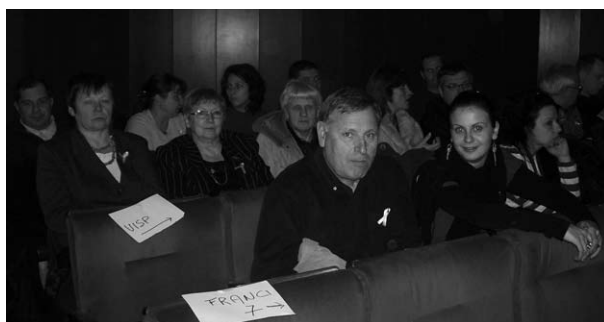
Pasākumā cilvēkiem ar īpašām vajadzībām.