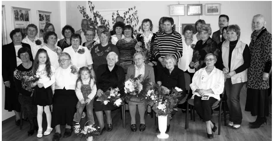
Fotogrāfa V. Lukstenieka simtgades pasākuma dalībnieki Elkšņu kultūras nama foto istabā.