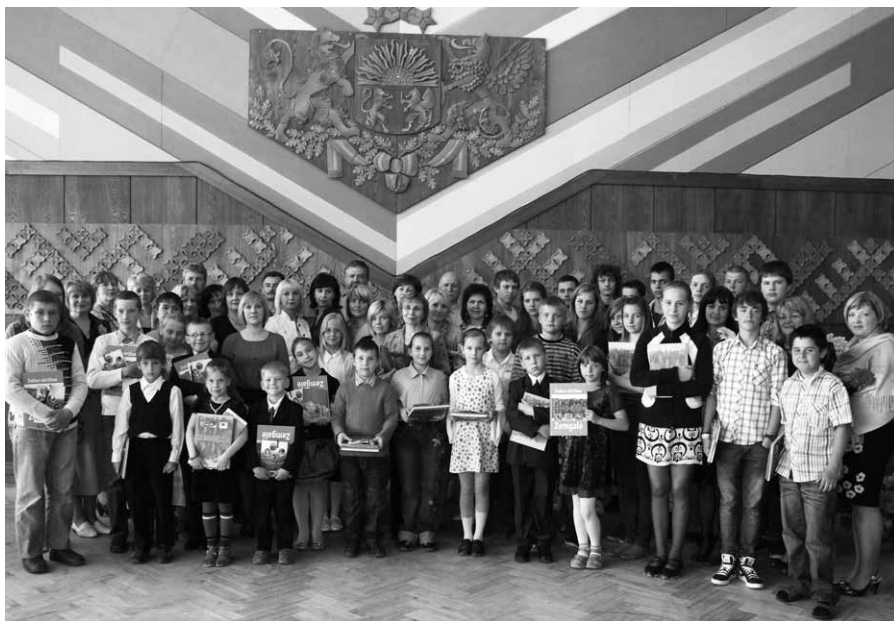
Šī gada 26. maijā Viesītes novada pašvaldības vadība sveica Viesītes vidusskolas un Rītes pamatskolas skolēnus un skolotājus par labiem sasniegumiem mācību olimpiādēs un konkursos 2010./2011. m. g.