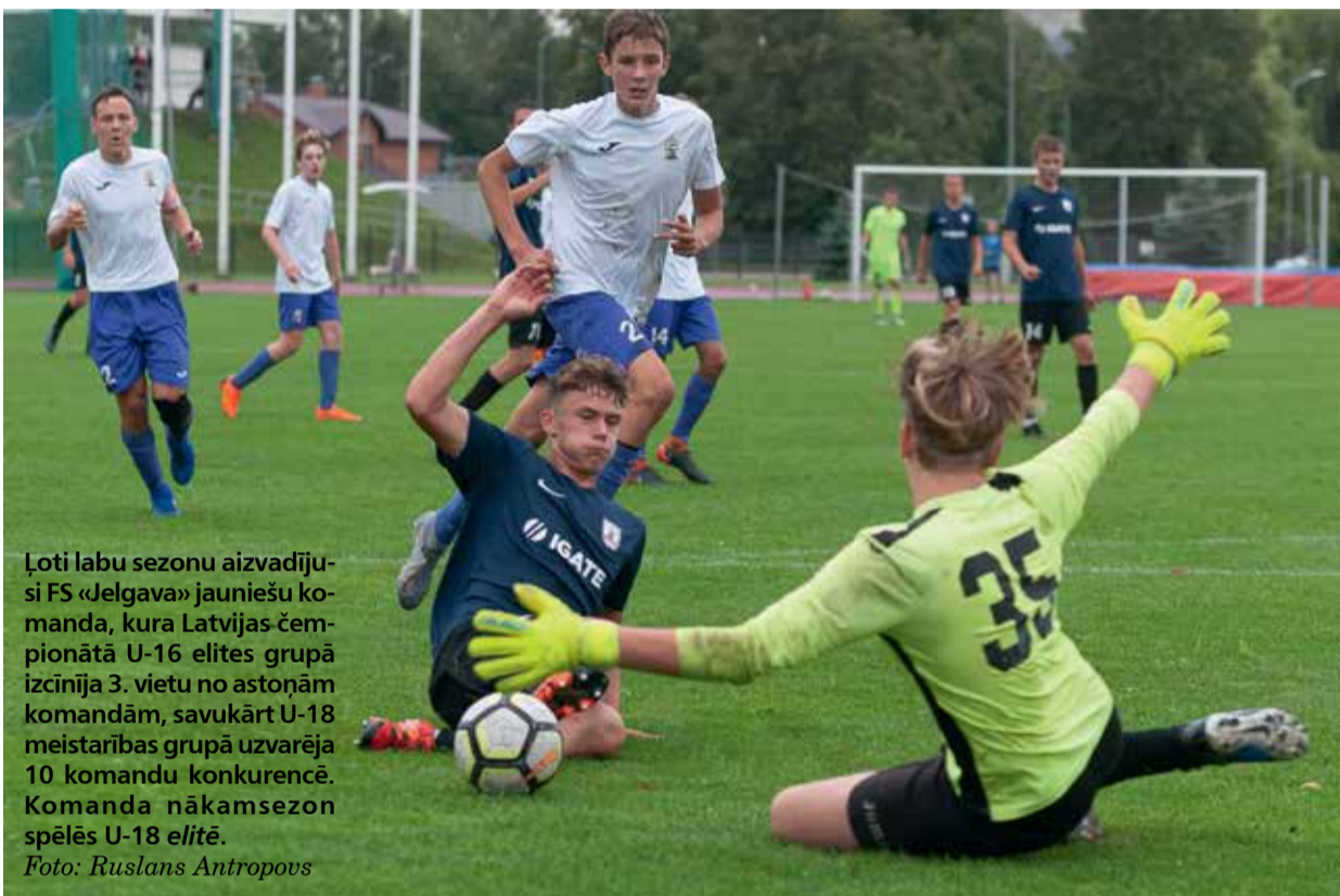
Ļoti labu sezonu aizvadīja FS «Jelgava» jauniešu komanda, kura Latvijas čempionātā U-16 elites grupā izcīnīja 3. vietu no astoņām komandām, savukārt U-18 meistarības grupā uzvarēja 10 komandu konkurencē. Komanda nākamsezon spēlēs U-18 elitē.

Latvijas jaunatnes čempionāts sākas no U-13 vecuma – tas nozīmē, ka notiek pāreja no mazāka izmēra laukuma un vārtiem uz lielāku izmēru, un arī laukuma spēlētāju skaits no astoņiem palielinās līdz 11. FS «Jelgava» ir ieviesta prakse: komanda pirms oficiālās debijas Latvijas jauniešu čempionātā aizvada pārbaudes sezonu. «Lai adaptētos, mūsu 12 gadu vecie jaunieši spēlēja Latvijas čempionātā U-13 attīstības grupā. Tā kā tur bija ļoti daudz komandu, tās sadalīja apakšgrupās, un mēs savējā bijām otrie no 10 komandām. Ar to mums sezona noslēdzās, jo ti-