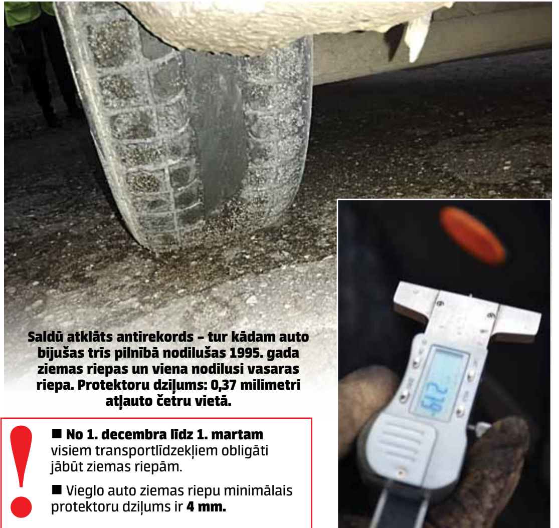
Saldū atklāts antirekords – tur kādam auto bijušas trīs pilnībā nodilušas 1995. gada ziemas riepas un viena nodilusi vasaras riepa. Protektoru dziļums: 0,37 milimetri atļauto četru vietā.