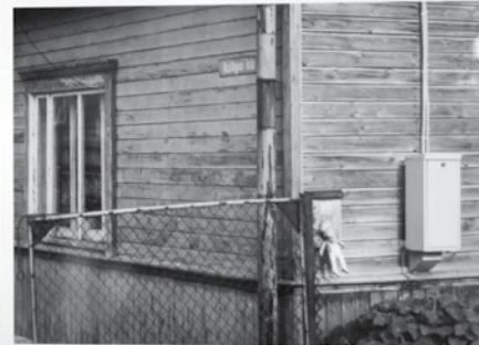
Viskontrastaināk Kuldīgas iela izskatās Rēzeknē.