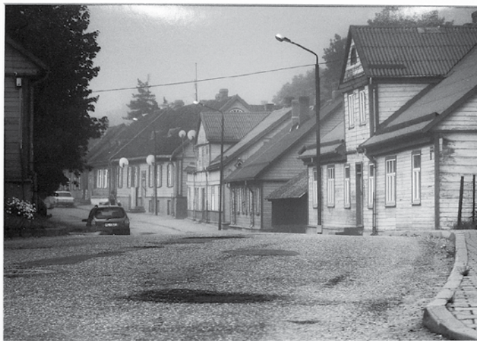
Kuldīgas iela Aizputē visvairāk atgādina mūsu pilsētu.

Senas, kontrastainas, katra citāda – tā fotoizstādes Kuldīgas ielu stāsti Latvijā atklāšanā teica Kuldīgas kluba Dīvas upes fotogrāfi. Viņi šogad izveidojuši dokumentāli pētniecisku izstādi par savas pilsētas vārdā nosauktajām ielām Latvijā.