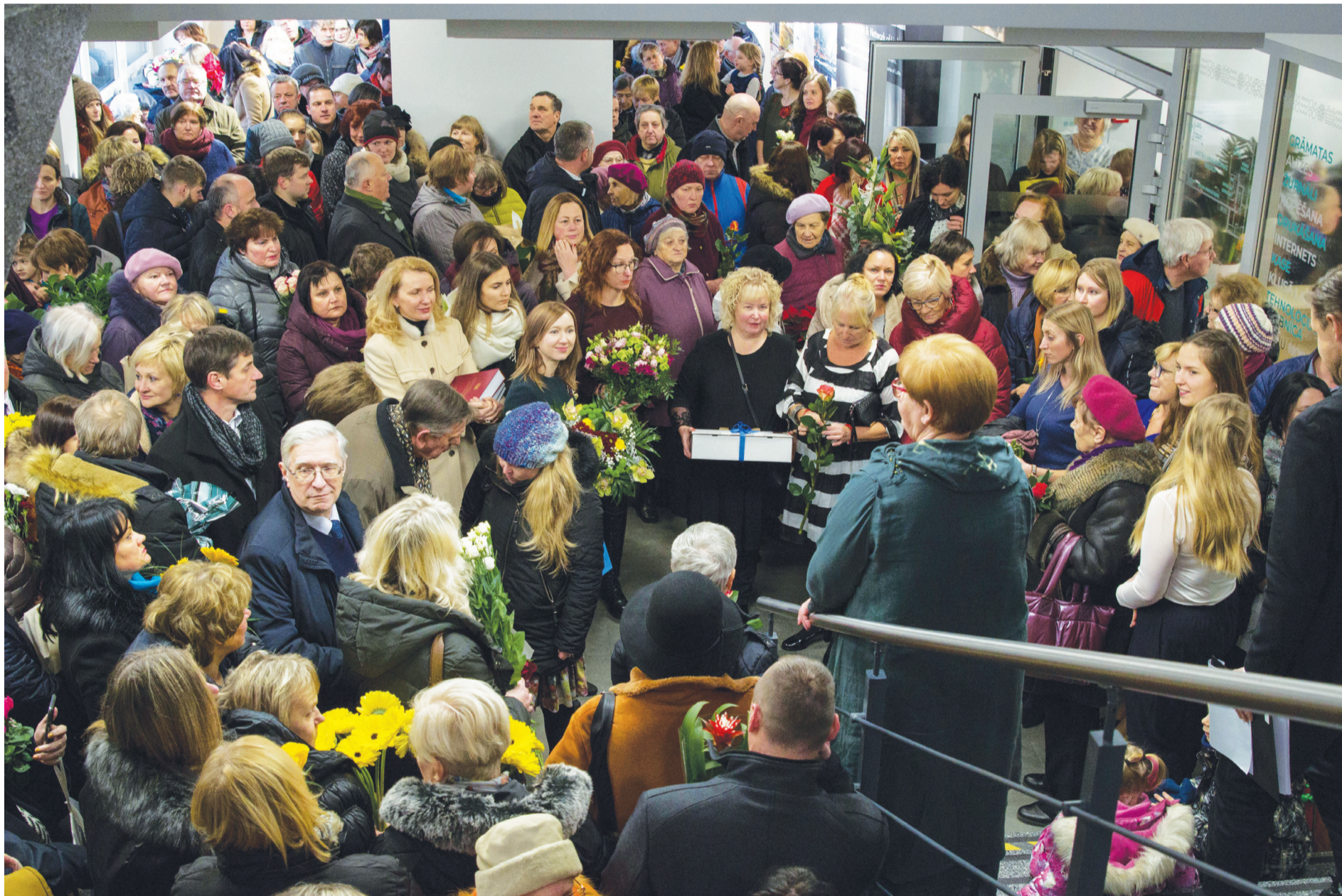
Talsu Galveno bibliotēku un Talsu Bērnu bibliotēku ar jaunajām mājām sveikt bija ieradies kupls sadarbības partneru, atbalstītāju un draugu pulks