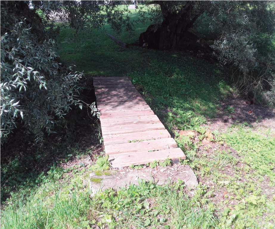
Tiltiņš pirms atjaunošanas un pēc

Talsu dendroloģiskais parks lēnām iegūst pārvērtības. Pārmaiņas ir nelielas, bet tomēr pakāpeniski notiek kvalitatīvi vides uzlabojumi. Talsu pilsētas pārvalde šā gada pavasarī „Meža dienas 2019” projekta ietvaros ieguva finansīšu atbalstu tiltiņa atjaunošanai, kas līdz šim bija gan estētiski, gan tehniski nolietojies, kā arī tas nebija ērti lietojams.