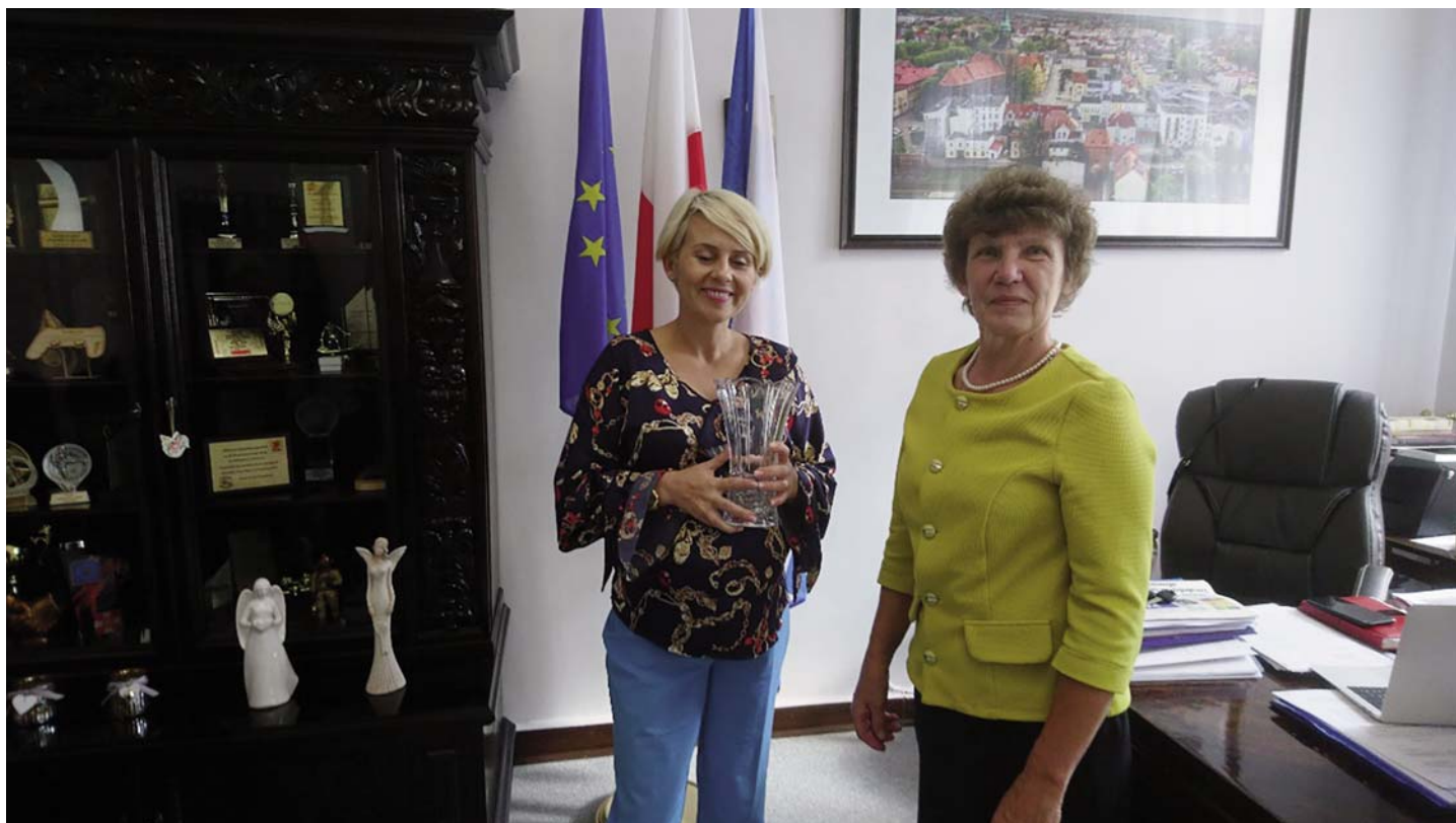
AKNĪSTES NOVADA PAŠVALDĪBAS DELEGĀCIJAS OFICIĀLA VIZĪTE BIALOGARDĀ (POLIJĀ). Turpinājums 5. lpp.