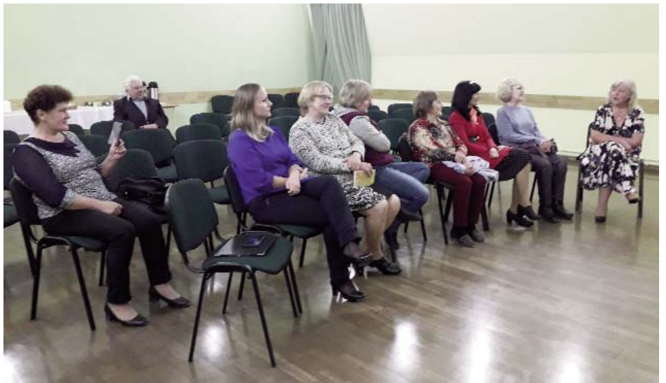
Pasākuma dalībnieki

Asares pagastā dzīvo vai dzīvojuši daudzi radoši cilvēki, arī tādi, kuri savas pārdomas, izjūtas un pārdzīvojumus izsaka dzejā gan nopietni, gan arī nenopietni, rakstot gan par garīgām, gan sadzīviskām tēmām. Tie ir: