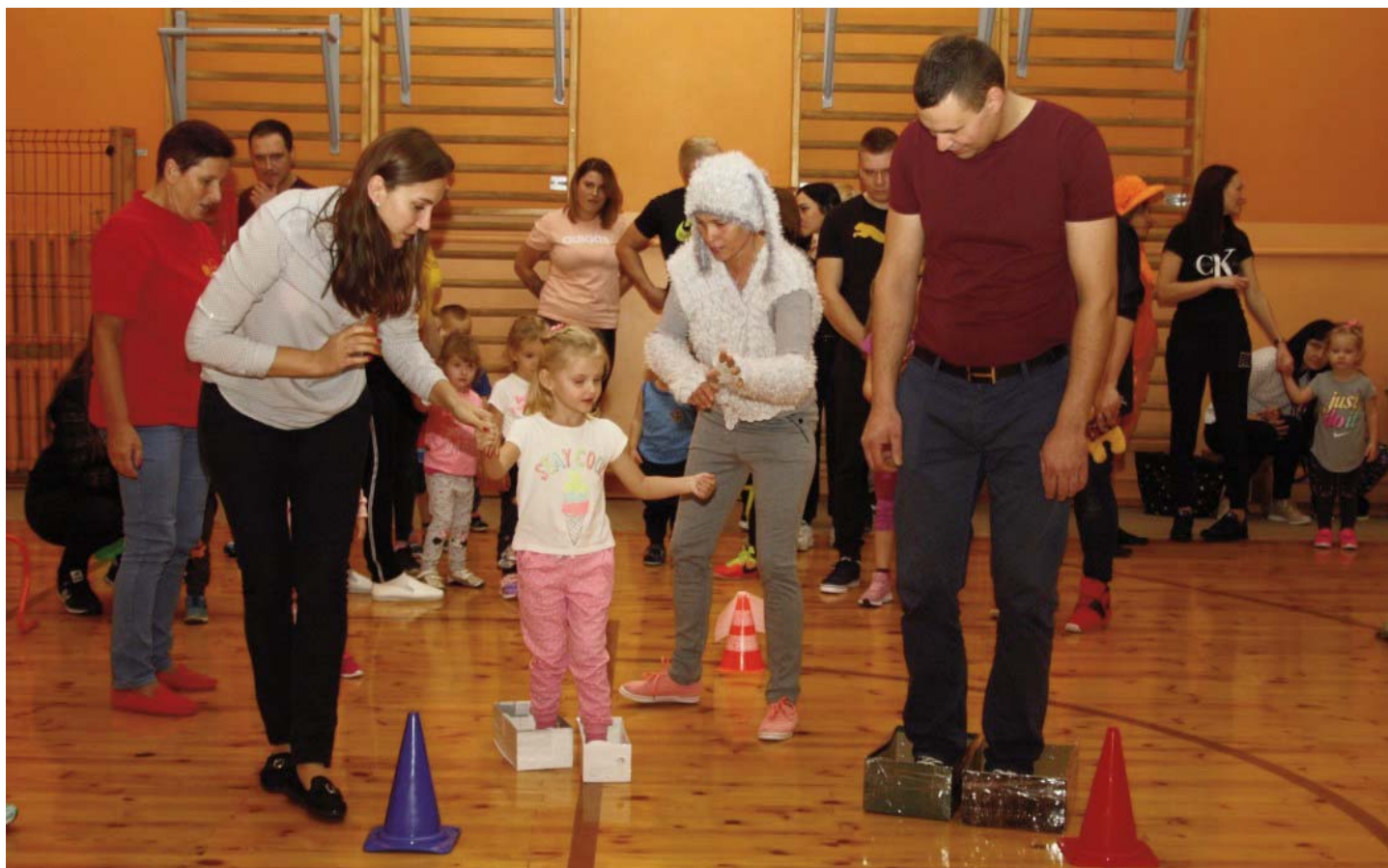
PII "BITĪTE" SPORTISKU AKTIVITĀŠU PASĀKUMS BĒRNIEM KOPĀ AR VECĀKIEM "MANS TĒTIS UN ES SPĒJAM VISU".