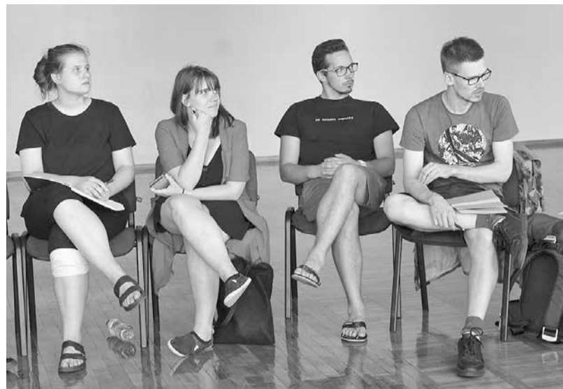
Jaunie talanti praktiskajās dramaturģijas un režijas nodarbībās.

Pēc Latvijas Nacionālā kultūras centra datiem, 2019. gadā Latvijā darbojas 428 amatier-teātri. Šai kustībai ir noturīgas tradīcijas un noteiktas sociālas, izglītojošas un mākslinieciskas funkcijas. Virkne amatier-teātru, pārsvarā novadu centros, pretendē uz profesionālai mākslai pietuvinātu procesu un rezultātu ar profesionālu vadītāju, stabilu truppu, repertuāru un noteiktu vietu reģiona kultūrvidē. Tomēr daudz vairāk ir entuzias-tu vadītu kolektīvu ar mainīgu sastāvu un tikai daļēji piemērotiem spēles laukumiem, kuri veic nepārvērtējamu vides humanizācijas darbu, stimulējot vietējo iedzīvotāju radošās izpausmes un interesi par teātri.