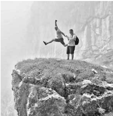
Iedvesmojošie un elpu aizraujošie Alpu kalni.