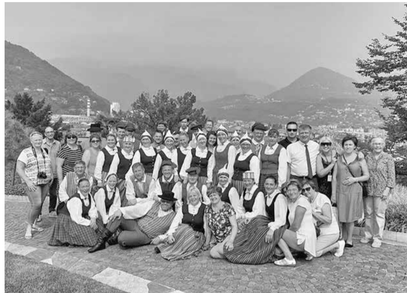
Apvienotais "ceļojuma kolektīvs" pēc garās koncertprogrammas.

Dodamies pastaigā līdz Komo ezeram, pirmie kopīgie foto, tad arī brauciens ar nelielu kuģīti pa ezeru. Šajā dienā arī "iekarojām" Alpus. No neliela kalnu ciematīņa Barzio ar trošu vagoniņu ceļamies uz kalnu atpūtas vietu – Piani di Bobio . Kalnus varēja izbaudīt katrs pēc savām vēlmēm un varēšanas: apmeklēt nelielu