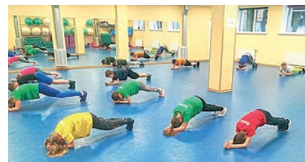
Vispārattīstošās vingrošanas (kalanētikas) nodarbības

Aktivitātes tiek īstenotas projekta "Pasākumi vietējās sabiedrības veselības veicināšanai Ādažu novadā", Nr.9.2.4.2/16/I/001, ietvaros.