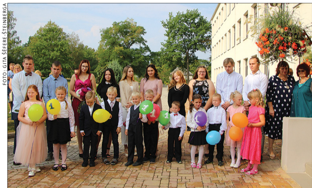
Absolventi ievēd Auces vidusskolā 1. klases skolēnus.