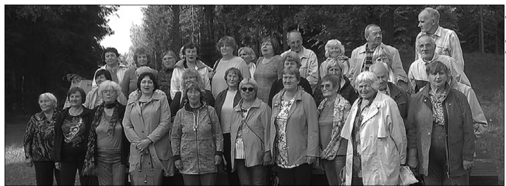
Ekskursijas dalībnieki Latgalē.

Apskatījām skaisto Pasiēnes baznīcu, kuras nelielā draudze – 10 draudzes locekļu – visiem spēkiem pūlas saglabāt un sakopt šo brīnišķīgo arhitektūras un mākslas pērli. Tālmā varējām redzēt Krievijas mežu galotnes. Neiztikām arī bez kurioziem stargadījumiem – par nožēlu, diviem ekskursantiem pie Austras koka (Latvijas tālākais austrumu punkts) vajadzēja izkāpt no autobusa, jo viņi bija aizmirsuši paņemt līdzī pasī. Pirms brauciena katram vajadzēja nokārtot iebraukšanas atļauju pierobežas zonā – vecā birokrātija, it kā kāds no mums grasītos mukt. Braucām uz Draudzības kurgānu, kas atrodas mežu ielokā uz Latvijas, Krievijas un Baltkrievijas robežas. Trīs metrus augstais Draudzības kurgāns uzbūvēts 1959. gadā par godu Otrā pasaules kara partizāniem. Uz kurgānu stiepjas trīs dažādu koku alejas: no Latvijas puses ved liepu aleja, no Baltkrievijas – kļavu, no Krievijas – bērzu aleja. Savulaik šajā vietā jūlija otrajā svētdienā satikās trīs valstu delegācijas, bet tagad ir kluss, pa retam atbrauc