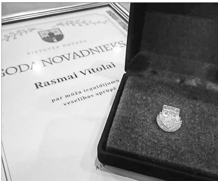
Visaugstāko apbalvojumu - "Aizputes novada Goda novadnieks" - saņēma Rasma Vītola par mūža ieguldījumu veselības aprūpē