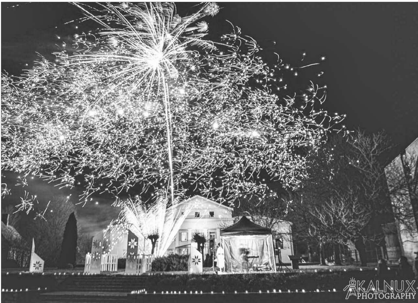
Svētku uguņošana Aizputes centrā 18. novembra vakarā.