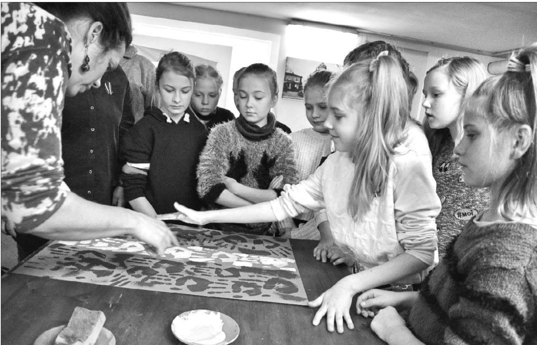
Bērni piedalās muzejpedagoģiskajā programmā Liepājā, apgūstot Latvijas valsts simbolus.

Novembrī, valsts svētku mēnesī, ir īstais laiks skolēnus rosināt aizdomāties par patriotismu, Latvijas vēsturi, grūti izcīnīto neatkarību un savu attieksmi pret mūsu zemi, ko novada skolas arī aktīvi darīja.