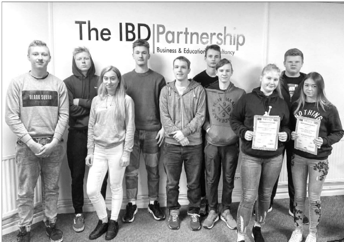
Kandavas Lauksaimniecības tehnikuma audzēkņi Apvienotajā Karalistē

Jau ceturto gadu Kandavas Lauksaimniecības tehnikums realizē Erasmus + projektus, kas sniedz iespēju skolas izglītojamajiem praktizēties ārvalstīs.