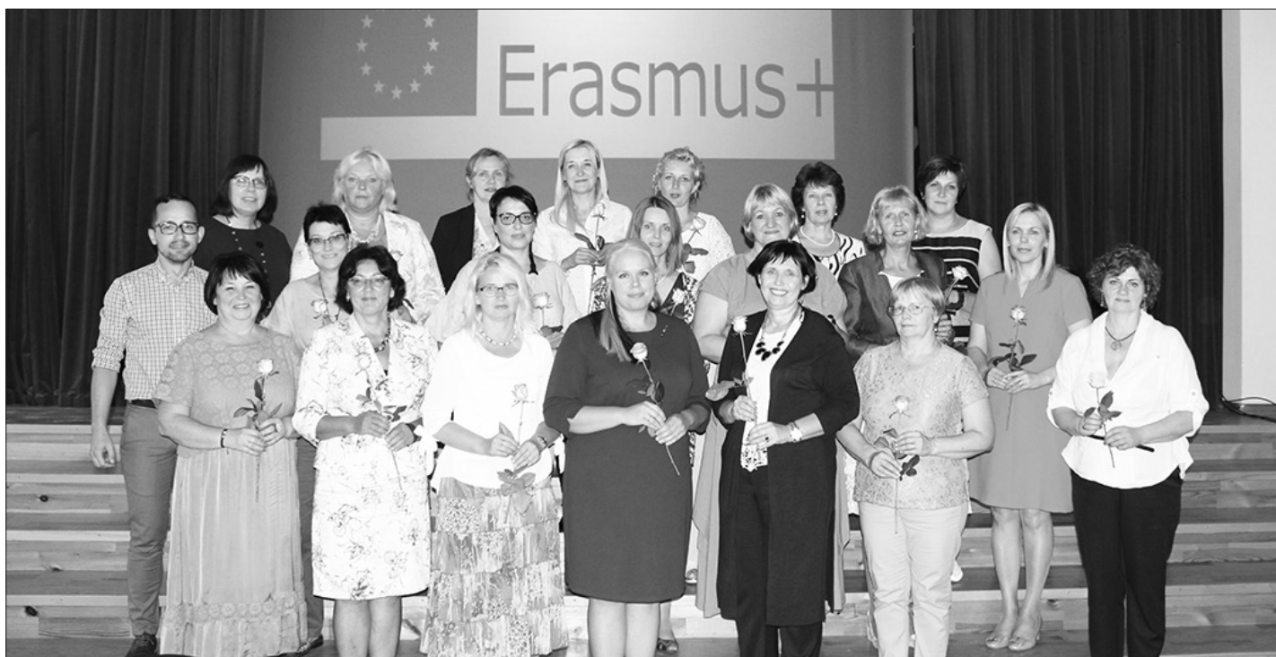
Aizkraukles reģiona pedagogu konferencē 2018.g. 29.augustā skolotāji dalījās ar projektā gūto pieredzi.

Lai skolotāji pilnvērtīgi būtu sagatavoti sākt īstenot jauno kompetencēs