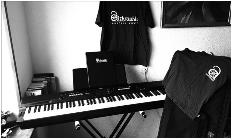
Jaunās klavieres jau iemēģinātas un gatavas iepriecināt kora mūzikas cienītājus.

Projektam Nr. Nr.19-04-AL08-A019.2203-000002 “Skatuves klavieru piegāde jauktajam korim Aizkraukle” finansējums piešķirts no Eiropas Lauksaimniecības fonda lauku attīstībai (ELFLA) Latvijas Lauku attīstības programmas 2014.–2020. gadam apakšpasākuma 19.2. “Darbības īstenošana saskaņā ar sabiedrības virzītās vietējās attīstības stratēģiju” aktivitātē 19.2.2. “Vietas potenciāla attīstī-