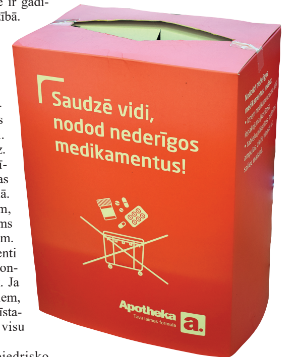
Tīkla Apotheke aptiekās zāles var iemest šādās kastēs, kas pieejamas klientu zālē.

mēnešos jau 2476 kg – vairāk nekā visā pagājušajā gadā. „Mēs centralizēti savācam no 119 aptiekām, un par utilizēšanu maksā uzņēmums. To uzskatām par mūsu sociālo atbildību. Ir ļoti bīstami, ka zāles, sevišķi antibiotikas vai kontracetīvie medikamenti, nonāk vidē un gribot vai negribot mēs tos uzņemam.”