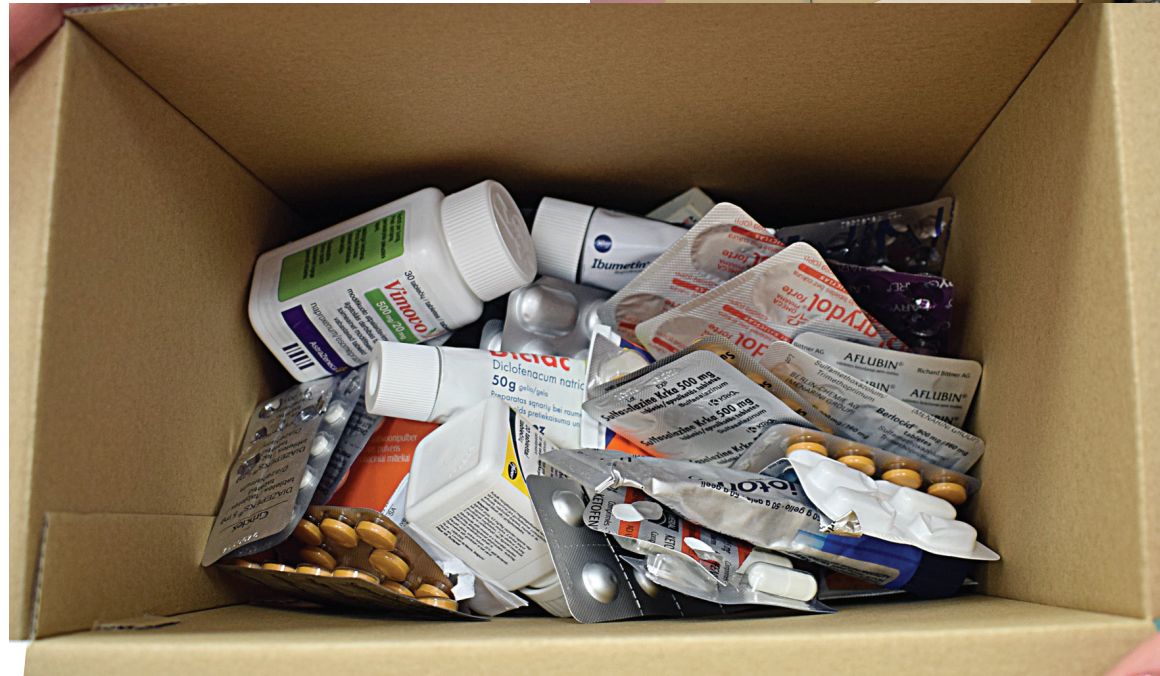
Aptieku darbinieki lūdz vecās zāles vispirms izņemt no kartona kastītēm. Tad tās aizņems mazāk vietas.

Tajās aptiekās, kas piekritušas nederīgas zāles savākt, izliktas kastes – lielākoties aptiekāru tuvumā, jo pieredzēti gadījumi, kad kāds tās pat nozog. Savu-