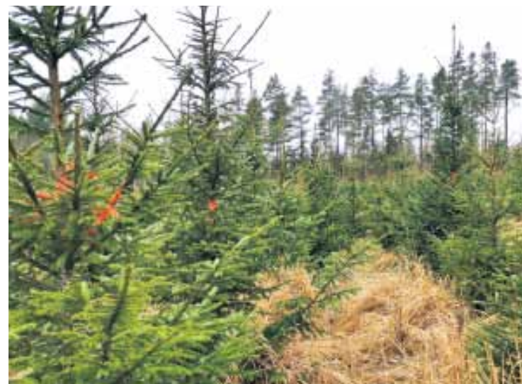
Eglītes jaunaudzē iezīmētas ar spilgtu krāsu, lai tās nenonāktu negodīgu tirgotāju rokās.

Pirms doties uz mežu pēc svētku egles, jāatceras vienkārši noteikumi. Privātpašumā kociņu nocirst drīkst tikai tad, ja ir saimnieka atļauja. Savukārt valsts mežā katrs iedzīvotājs drīkst savām vajadzībām nozāģēt vienu eglīti. Tās aizliegts cirst publiskā dabas parkā, īpaši aizsargājamajā teritorijā, kas atzīmēta ar ozollapu. Latvijas Valsts mežu teritoriju var pazīt pēc plāksnītes – LVM īpašuma zīmes, kur uz dzeltena fona attēlots uzņēmuma logo-