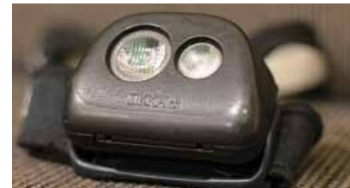
Uz lauku ceļiem neatsverams palīgs ir lukturītis.