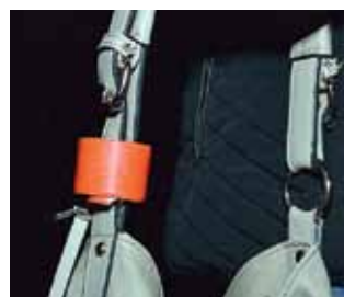
Pie somas lences piestiprināms apļveida atstarotājs.

Uzskatāms piemērs, cik labi veste palīdz gājēju ieraudzīt.