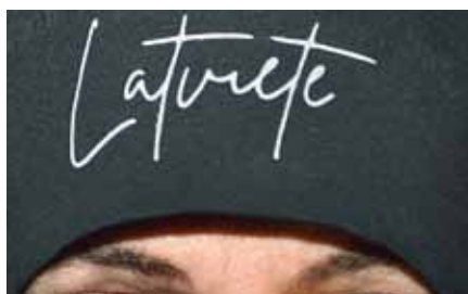
Pat atstarojošs uzraksts uz cepures būs derīgs.