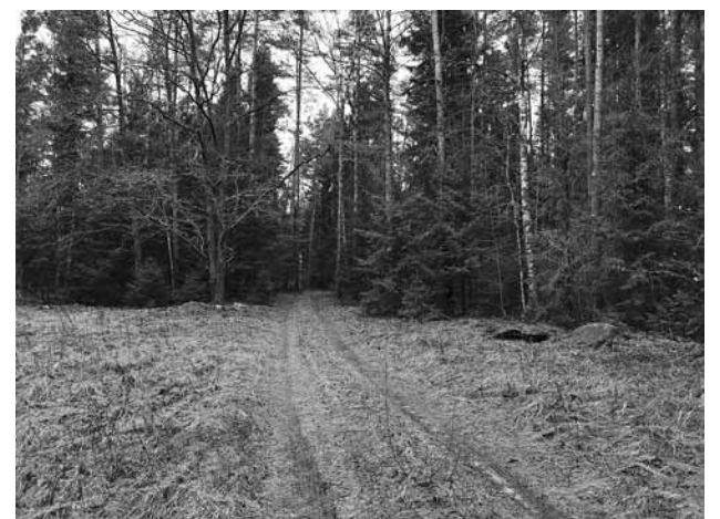
Jānim bijis noteikts maršruts, kuru viņš mērojis ik dienu.