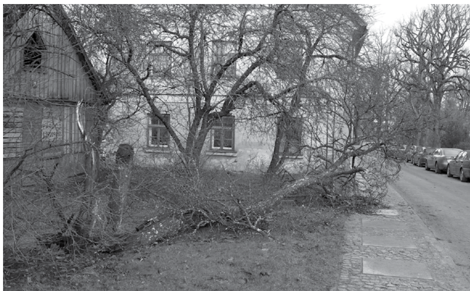
Koki laužti arī Kuldīgā, Kalna ielā.