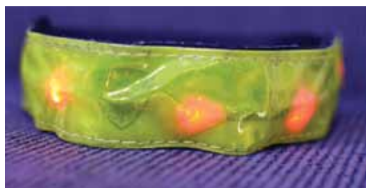
Atstarotājā iestrādātās spuldzītes pievērsīs papildu uzmanību.