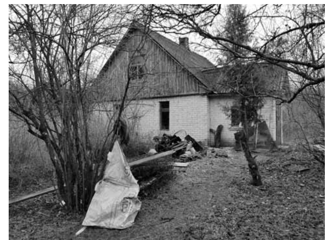
Pazudušais Jānis Ekšteins dzīvoja Nīkrāces pagasta Skudrās .