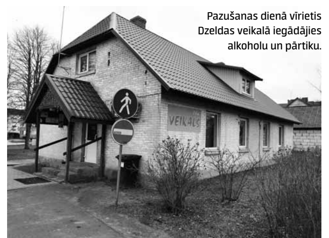
Pazušanas dienā vīrietis Dzeldas veikalā iegādājies alkoholu un pārtiku.