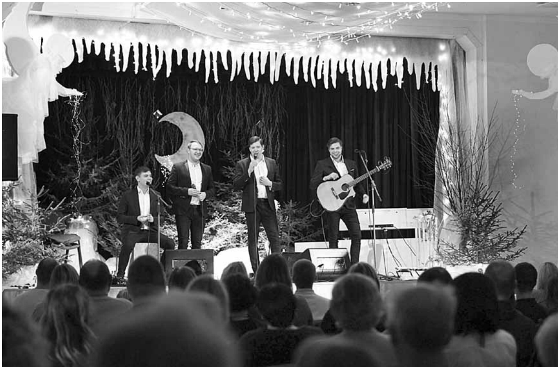
Enģeļu koncertā dzied Baritoni.

Rendā labdarības koncerts Enģeļi pār Latviju noticis devīto reizi. Usmas baznīcas un kultūras nama pasākumos savākta summa būs zināma gada beigās, jo aizslēgtās ziedošanu kastītes tiks nogādātas Rīgā.