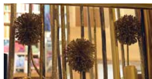
Rotājumi zelta toņos – dizaina lietu salona Kuuld logos.