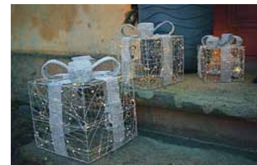
Mirdzošas dāvanas pie veikala Home Deko durvīm.