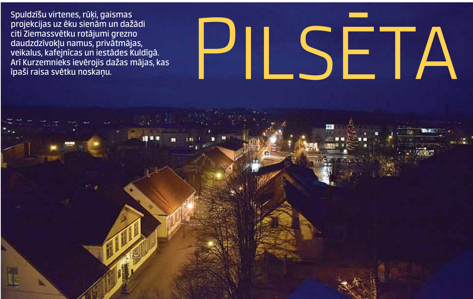
Skats uz naksnīgo Kuldīgu.