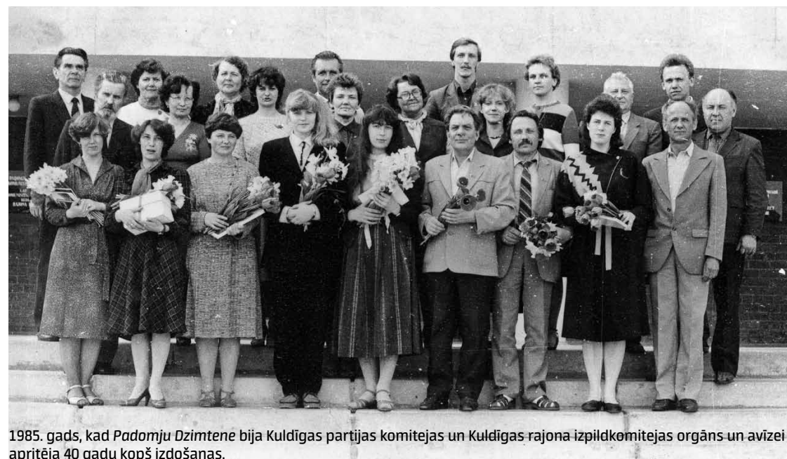
1985. gads, kad Padomju Dzimtene bija Kuldīgas partijas komitejas un Kuldīgas rajona izpildkomitejas orgāns un avīzei apritēja 40 gadu kopš izdošanas.

rakstīja ar pseidonīmiem. Tas, manuprāt, arī parādīja attieksmi: tas neesmu es, kas to raksta. Otra lieta: tolaik nebija atļauts vienam cilvēkam avīzē rakstīt vairākus rakstus. Viens raksts ar savu vārdu, pārējie – ar pseidonīmu. Bija iespēja izvēlēties, kuru parakstīt ar pseidonīmu, un to darījām bieži. Republikas galvenajā partijas izdevumā Cīņa cilvēki rakstīja ar pseidonīmu, kad kāds bija jākritizē.”