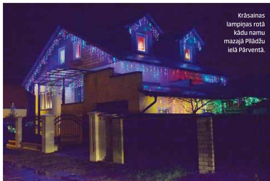
Krāsainas lampiņas rotā kādu namu mazajā Pilādžu ielā Pārventā.