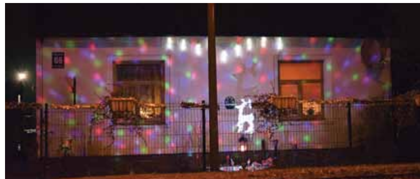
Jelgavas ielā viens no gaišākajiem ir 66. nams.