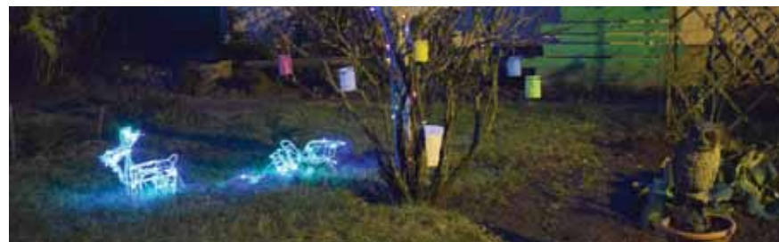
Arī pie Mucenieku ielas 10. nama padomāts par dekorācijām.