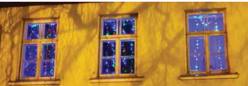
Trīs krāsaini logi Smilšu ielā 1.