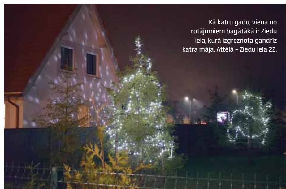
Kā katru gadu, viena no rotājumiem bagātākā ir Ziedu iela, kurā izgreznota gandrīz katra māja. Attēlā – Ziedu iela 22.