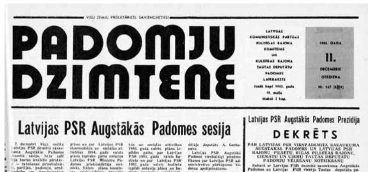
1984. gada Padomju Dzimtenes galviņa.