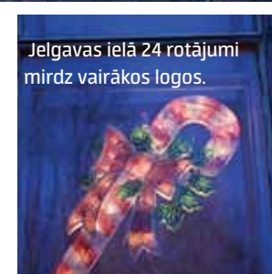
Jelgavas ielā 24 rotājumi mirdz vairākos logos.