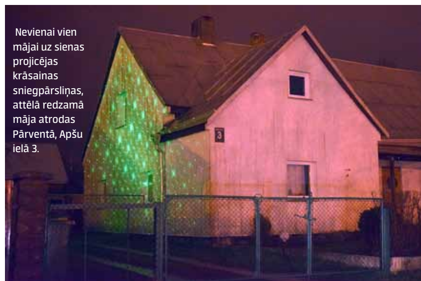
Nevienai vien mājai uz sienas projekcijas krāsainas sniegpārslīņas, attēlā redzamā māja atrodas Pārventā, Apšu ielā 3.