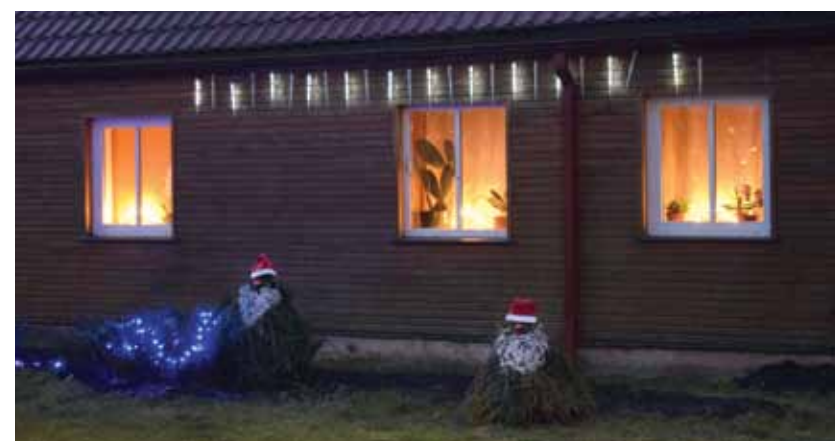
Ziemassvētku rūķi sasēduši Ēdoles ielas 16. nama pagalmā.