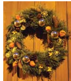
Grezns vainags pie Policijas ielas 13. nama durvīm.