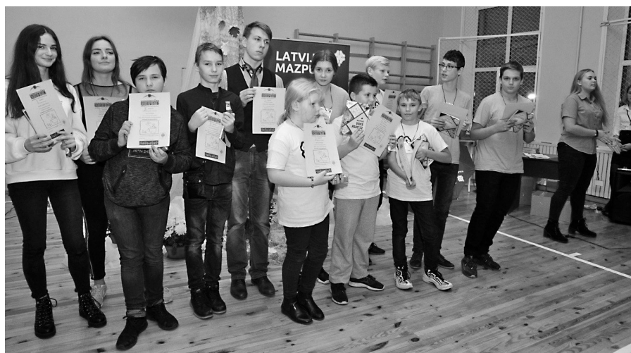
Biedrības “Latvijas Mazpulki” Zemgales – Latgales mazpulku projektu foruma “Zaļākai uzņēmējdarbībai laukos” apbalvošanas ceremonijā.

Šogad novembrī Latvijas lielā Mazpulku saime svinēja savas pastāvēšanas deviņdesmito dzimšanas dienu. Ikvienam mazpulcēnam tas ir ievērojams cīnīgums notikums, tāpēc gribas paveikt ko īpašu. Viesītes mazpulcēni izveidoja draudzīga aicinājuma akciju 45 Latvijas pierobežas novadiem “Ievij sava ozola zili Latvijas vainagā!”. Tā domāta tiem pierobežas novadiem, kas piedalījās Iekšlietu ministrijas ozolu stādīšanas maratonā “Apskauj Latviju!”. Viesītiešu veidotais ozollapu vainags ar vienu