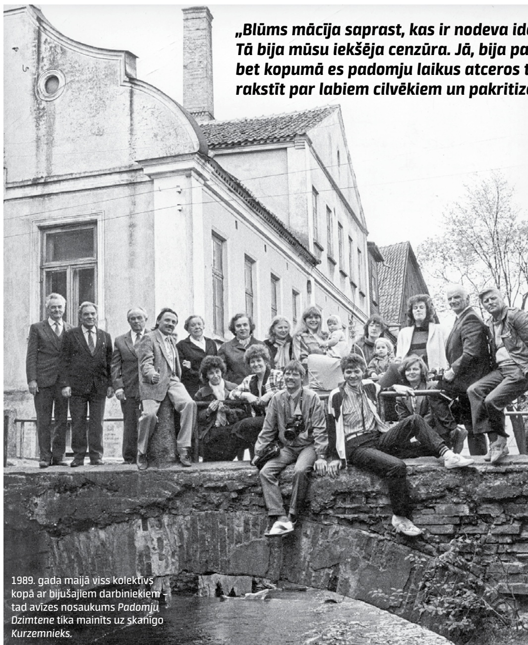
1989. gada maijā viss kolektīvs kopā ar bijušajiem darbiniekiem – tad avīzes nosaukums Padomju Dzimtene tika mainīts uz skaņīgo Kurzemnieks .

Kārtējais saiets bija arī reizē, kad valdīja sausais likums. Vienā zivju