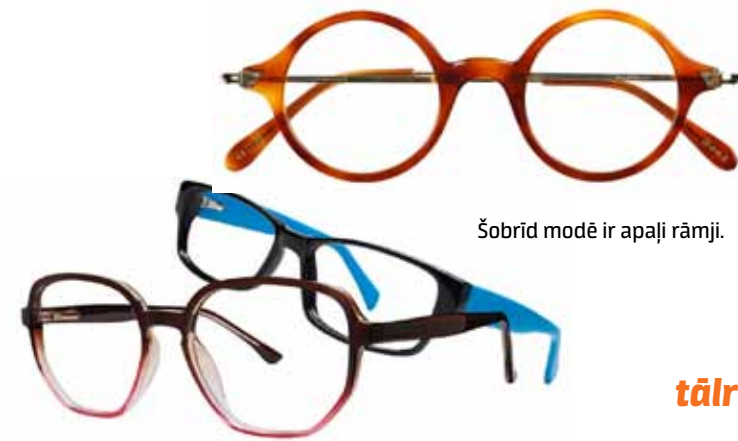
Šobrīd modē ir apaļi rāmji.

uz citiem izmeklējumiem. Bet īstenībā visu var novērst ar pareizām brillēm.