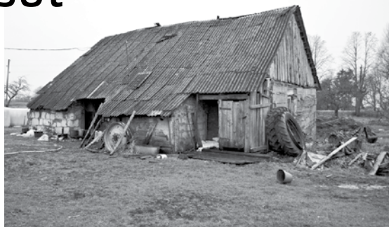
Kūtiņā mit trīs govīs, bullītis un 70 vistas.

Mamma iepazinās ar vienu vīrieti, nopirka šo māju par 1000 rubļiem, un pārcēlāmies uz Pučkalniem . Iepriekš te dzīvojuši Vilmaņi. Es no 17 gadiem kol-