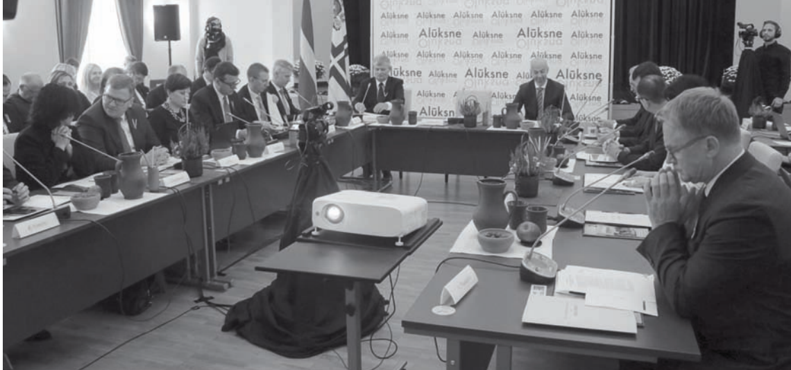
Ministru kabineta izbraukuma sēde Alūksnes Kultūras centrā