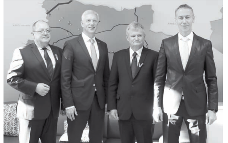
No kreisās: domes priekšsēdētāja vietnieks Aivars Fomins, Ministru prezidents Krišjānis Kariņš, Alūksnes novada domes priekšsēdētājs Arturs Dukulis un priekšsēdētāja vietnieks Dzintars Adlers

Pēc sēdes visi ministri un pašvaldības vadība kopīgi devās uz Nacionālo bruņoto spēku Kājnieku skolu, kur iepazīs ar tās infrastruktūru, kā arī nolika ziedus pie 7. Siguldas kājnieku