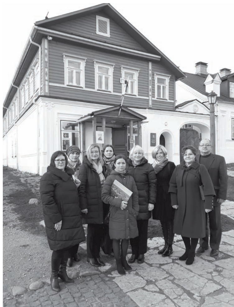
Alūksnes novada pašvaldības pārstāvji Izborskā

Konference notika Latvijas-Krievijas pārrobežu sadarbības programmas 2014.-2020. gadam atbalstītā projekta Nr. LV-RU-008 "630 verstis pilnas sajūtām/ Sajūtu verstis"/ "630 Versts Full of Feelings/ Versts of Feelings" ietvaros, ko Alūksnes novada pašvaldība īsteno sadarbībā ar partneriem no Latvijas un Krievijas - Latvijas Piļu un muižu asociāciju no Latvijas, Pavlovskas muzejrezervātu un Izborskas