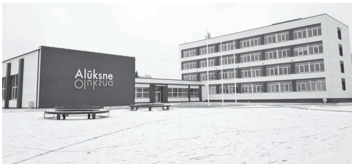
Evitas Aplokas foto

Kabinetos četrstāvu ēkas daļā ierīkota ventilācijas un gaisa kondicionēšanas sistēma, uzlabota ugunsgrēka atklāšanas un trauksmes signalizācijas sistēma, izbūvēta jauna apkures sistēma un nomainīti gaismekļi. Kosmētiskais remonts kabinetos un gaitenīs projektā nebija paredzēts. Ēkas ārpusē veikta centrālā laukuma pārbūve un apkārtējās teritorijas labiekārtošana. Laukuma centrālais elements ir monumentāls masts lielzēmā Latvijas karoga pacelšanai. Masta pamatnē veidots krāsains bruģa raksts dzijas kamola veidolā. Teritorijā izvietoti jauni atpūtas soliņi, bruģēti celiņi, ierīkota lietus ūdens kanalizācija un drenāža. Ēkas fasāde ir reprezentatīvais laukums diennakts tumšajā laikā ir izgaismoti. Atkārtoti izvērtējot apstādījumu atbilstību Latvijas Ziemeļaustrumu klimatam, no sākotnēji plānotajiem augiem: kārkļiem, japāņu pahisandras, tiarellām, ābelēm, Japānas ziedu ķiršiem un bārbelēm atsako-