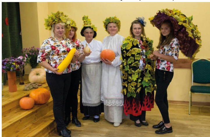
Vārkavas novadpētniecības muzejs

Ar savām dziesmām un dejām pasākumu kuplināja Vārkavas novada sieviešu vokālais ansamblis “Melodīva” un Vārkavas novada senioru deju kopa “Odziņas”.