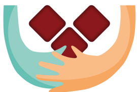
EIROPAS ATBALSTA FONDS VISTRŪCĪGĀKAJĀM PERSONĀM