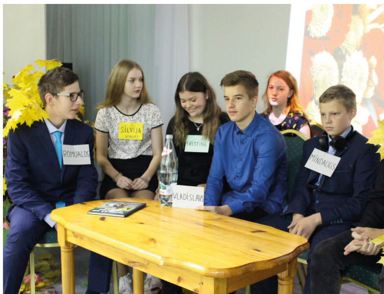
8. klases skečs «Skolas pedagoģiskā sēde»