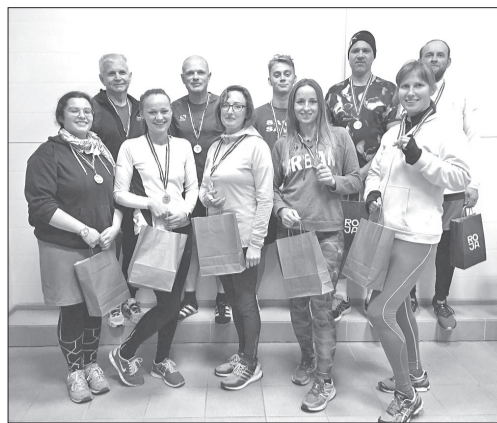
Rojas aktīvākie skrējēji. Albuma foto

Septembra beigās Rojas stadionā noslēdzās „ROJAS APLI – 2019” sezona. Kopā notika 22 posmi, sākot no aprīļa, vienu reizi nedēļā. Dalībniekiem bija jāveic 30 minūšu skrējieni apkārt Rojas stadiona sporta laukumam. Piedalīties varēja jebkura vecuma dalībnieks, jo sacensības nenotiek uz ātrumu, bet tik, cik katrs var noskriet aplus, vadoties pēc savām fiziskajām spējām. Katram dalībniekam tika uzskaitīti pieveiktie apli. Kopā piedalījās 56 dalībnieki.