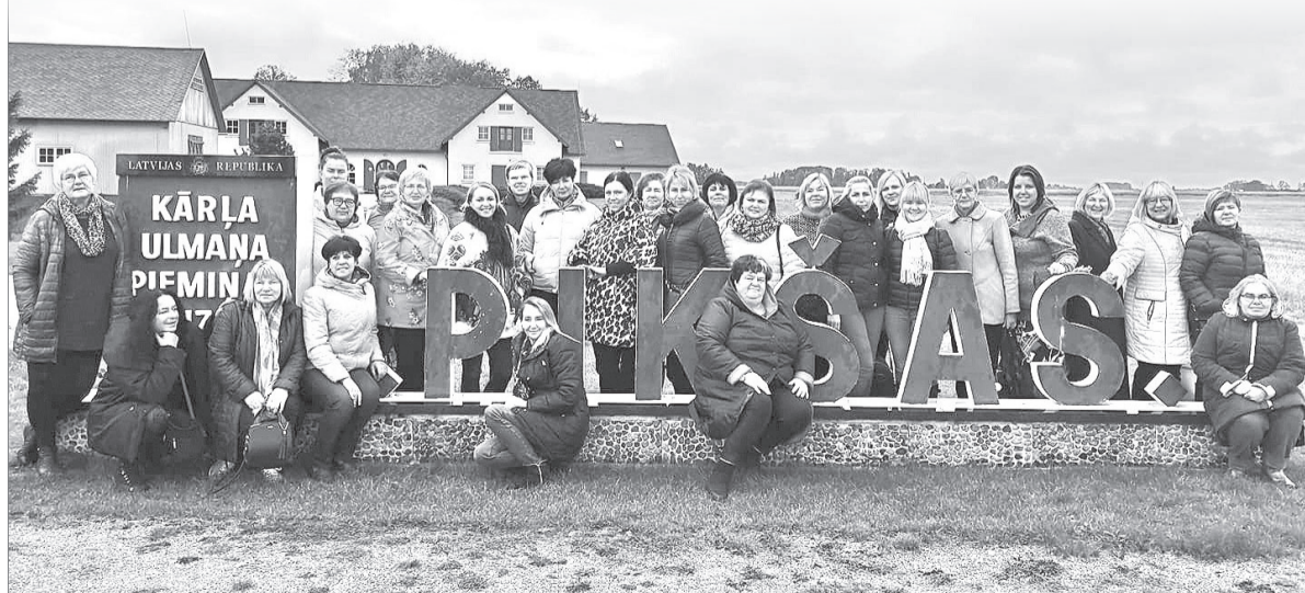
Skolotāju kolektīvs ekskursijā „Pikšās”.

3. un 4. oktobrī Rojas vidusskolā atzīmēja Skolotāju dienu. 12. klases skolēni