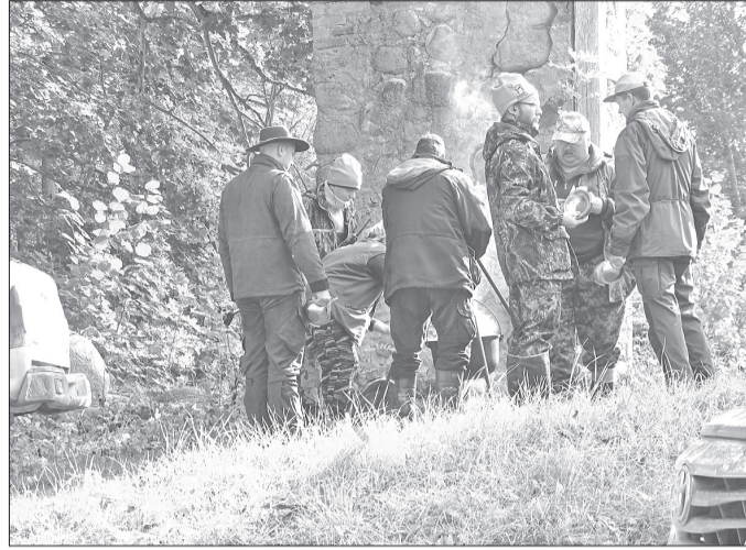
Pēc mežā nostāigātajiem kilometriem ir tik patikami, ja kāds tevi sagaida ar siltu zupas katlu.

Sestdien, 5. oktobrī, šīs sezonas pirmajās medībās ar