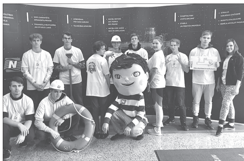
„Enkurs” komanda pirms starta.