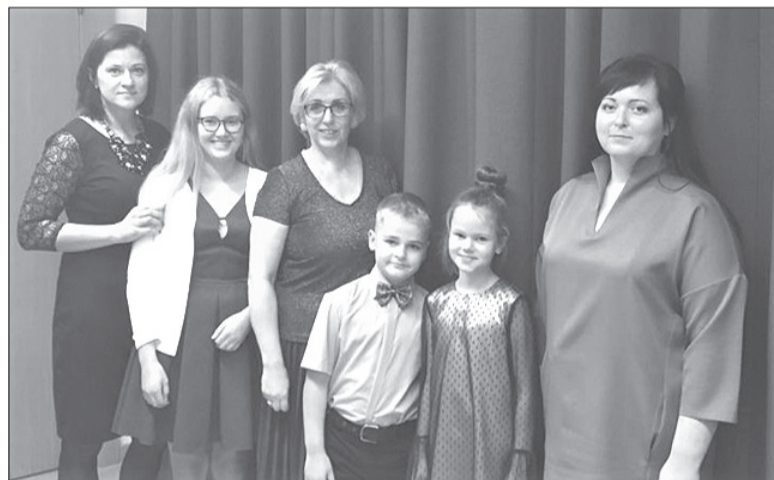
Rojas MMS komanda godam pārstāvēja Roju konkursā Ventspilī.