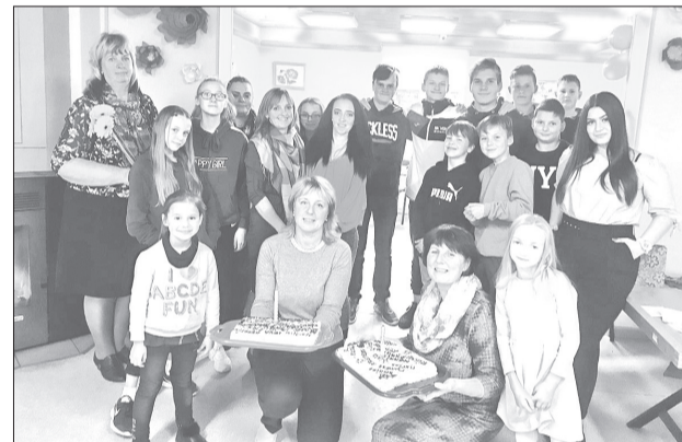
Atceri par jubilejas svinībām – svētku dalībnieku un viesu kopīgs foto.