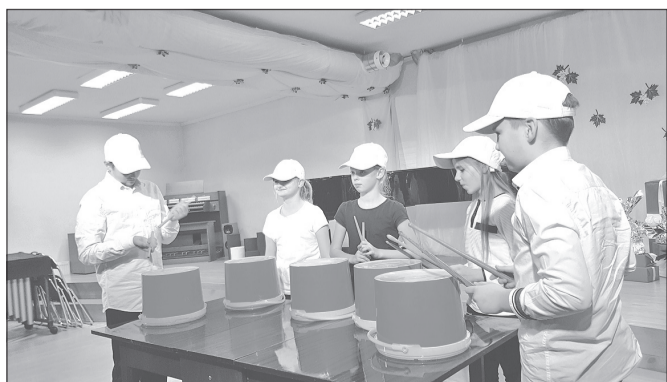
Uzstājas bangu virtuozī.

kuras sagatavoja bērnus, lai šis festivāls varētu notikt, cer, ka visi ieguva pozitīvas emocijas un iedvesmu turpmākajam darbam. Ir aizsākta jauna tradīcija. Nākamajā mācību gadā noteikti visiem kopā būs atkal jauna solfedžo stunda!