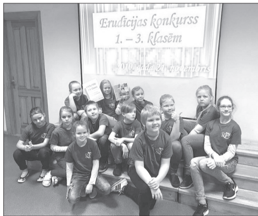
3. b klase erudicijās konkursā.