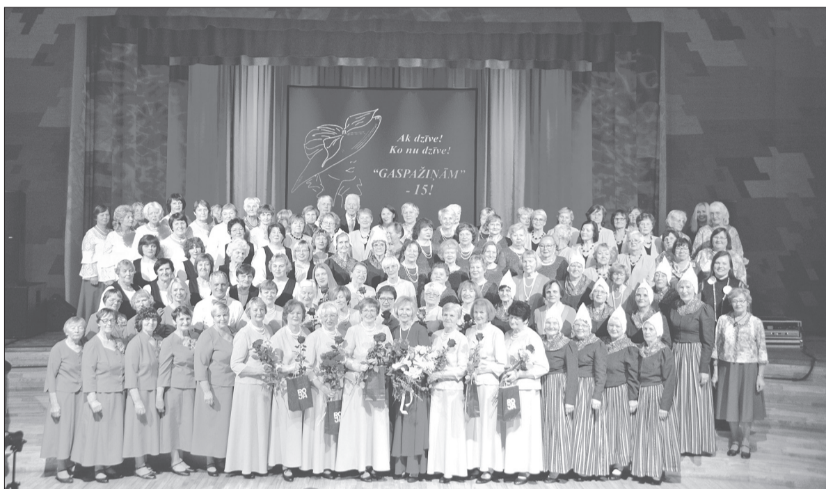
Kopā esošās un bijušās „Gaspaziņas”.