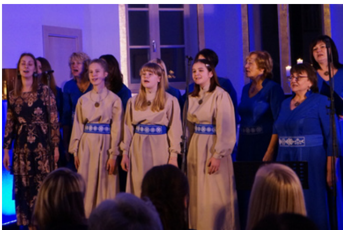
Dzied sievietes koris „LETTEGORE”