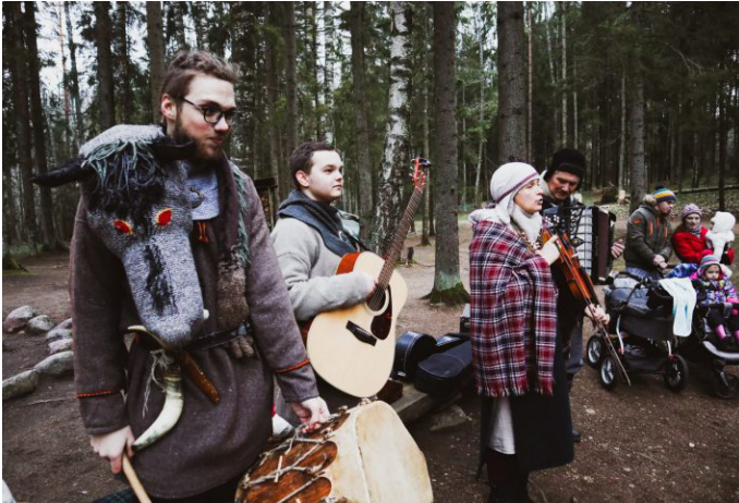
Saulīte uzsāk savu ceļu pretī pavasarim