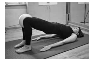
Saspiež bumbu, paceļ gurnus, notur 15–20 sekundes, nolaiž gurnus uz grīdas un atbrīvo muskuļus. 6–8 reizes.