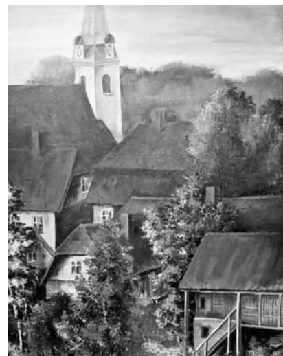
Kuldīgas sarkanie jumti – pilsētas zīmols.