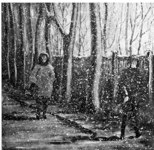
Eksperiments: pirmoreiz gleznā cilvēku figūras un radīts sniegputeņa efekts.

Darba līgums paredz, ka viena diena nedēļā kopējai ir brīva.