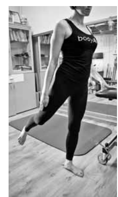
Saliektu kāju paceļ priekšā un vēzē atpakaļ un uz priekšu. Vispirms ar vienu kāju, pēc tam ar otru, atkārtoti 6–8 reizes. Ar laiku visus vingrinājumus var izpildīt ar gumijām, atsvariem, lai lielāka slodze.