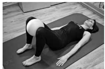
Gulot uz muguras, starp ceļiem lieliek bumbu. Saspiež, notur 15–20 sekundes, atbrīvo. Atkārtoti 6–8 reizes.