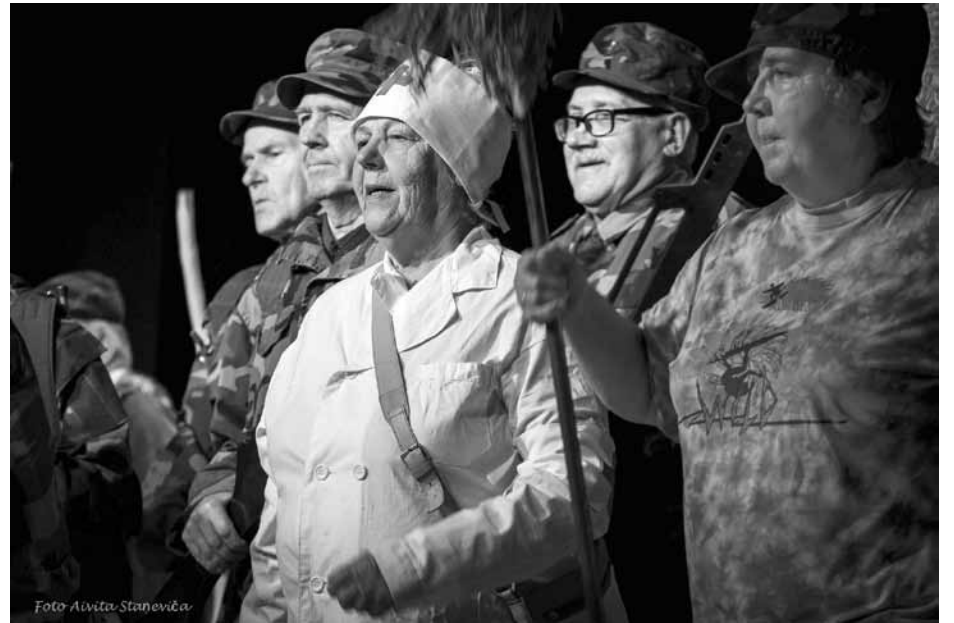
Senioru koris Skrunda joprojām jūtas jauns un dzīvespriecīgs – ne velti tikko atmetis nosaukumu Novakars un pašdarbnieku vakaram iestudējis uzvedumu Džimlai-rūdi-rallalā .

Kolektīvs dibināts 2003. gadā kā senioru kluba Skrundas ceriņi jauktais koris. Tikai vēlāk dalībnieki vienojušies, ka Novakars ir diezgan labs nosaukums. Bet pēc 17 braši nodziedātiem gadiem