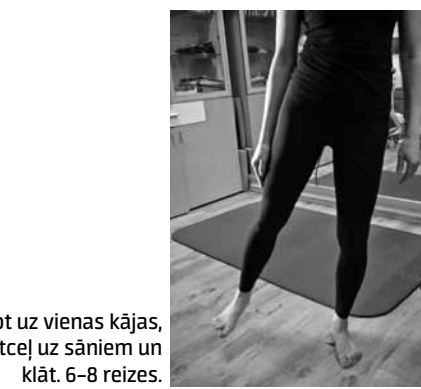
Stāvēt uz vienas kājas, otru atceļ uz sāniem un klāt. 6–8 reizes.