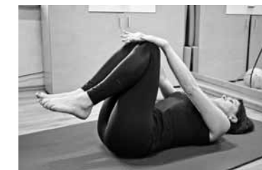
Pēdas saliek kopā, katru roku uzliek uz sava ceļgala un abus ceļus apļo uz vienu, tad uz otru pusī.