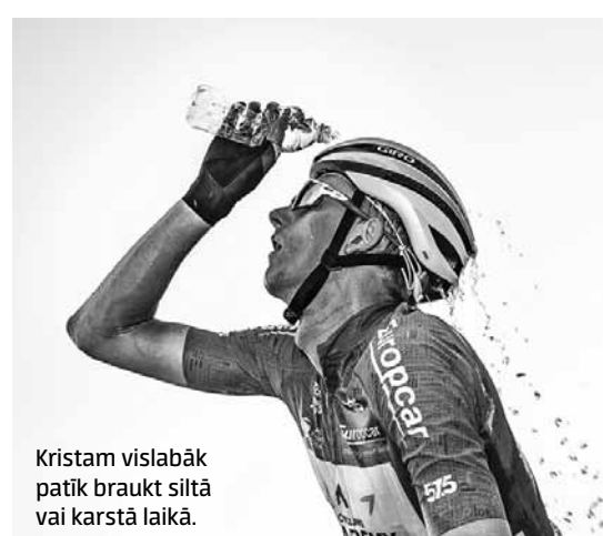
Kristam vislabāk patīk braukt siltā vai karstā laikā.