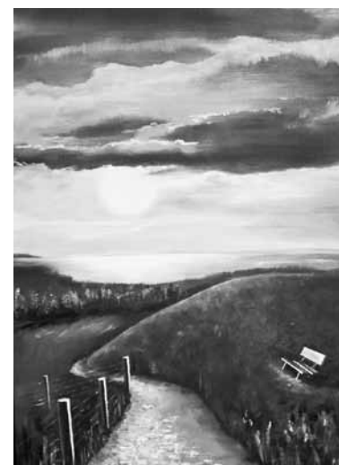
Mazs gabaliņš no 20 kilometriem ceļā uz jūru.