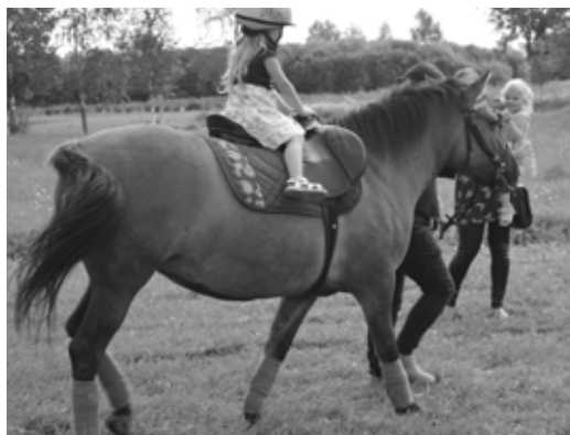
Baltinavas novada dienas 2019 jaunākajiem apmeklētājiem ļoti patika vizināties ponijmeitenes Grietas mugurā. Šo jauko atrakciju nodrošināja Rudīte Zelča no Medņevas. Visas dienas gaitā tika izvizināti aptuveni 70 bērni.