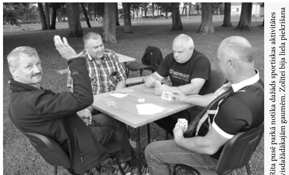
Rīta pusē parkā notika dažāds sportiskas aktivitātes visdažādākajam gaumēm. Zolitē bija liela piekrišana