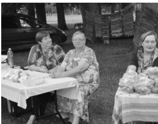
Svētku dienā darbojās arī vietējo amatnieku un mājražotāju tirdziņš