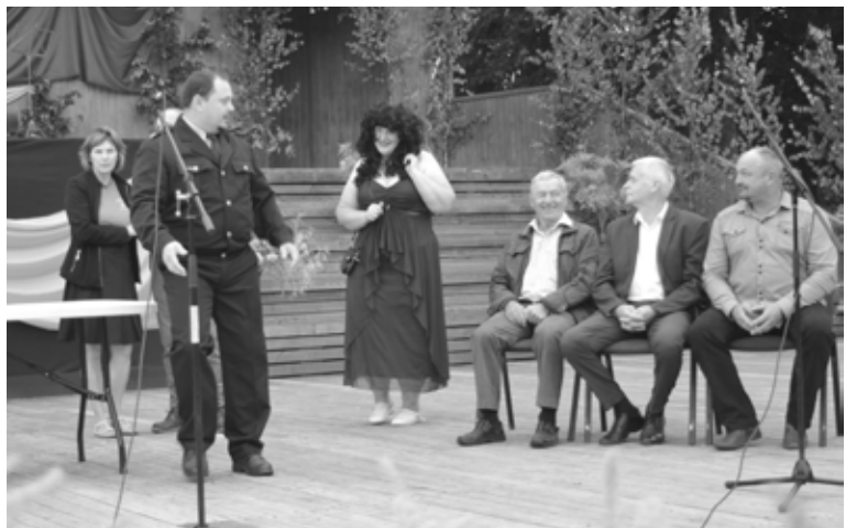
Baltinavas novada amatierteātris "Palādas" koncertā izklaidēja skatītājus ar humoristiskiem skečiem