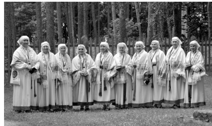
2013.gada Dziesmusvētkos

Etnogrāfiskā ansambļa vadītāju Antoņinu Krakopi intervēja Silvija Buklovskā