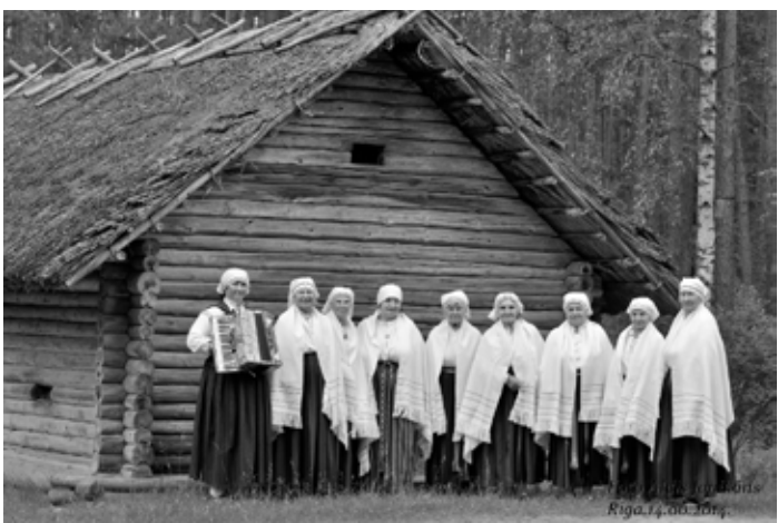
Novadu dienas Brīvdabas muzejā- 2014. gadā 14. jūnijā