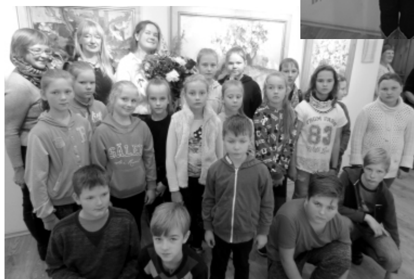
Teksts, foto: Antra Keiša, Baltinavas novada muzeja vadītāja