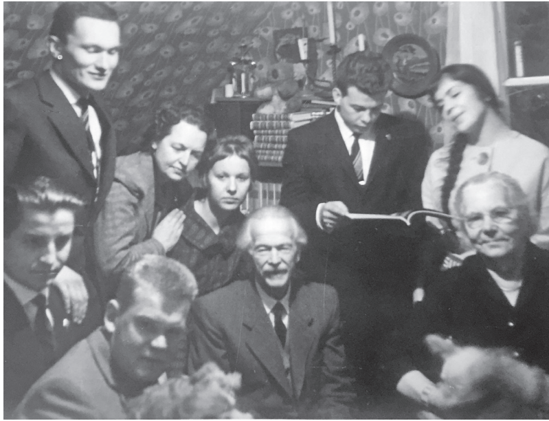
Ciemošanās “Mēnesnīcā” pie Jāņa Jaunsudrabiņa 1961. gadā