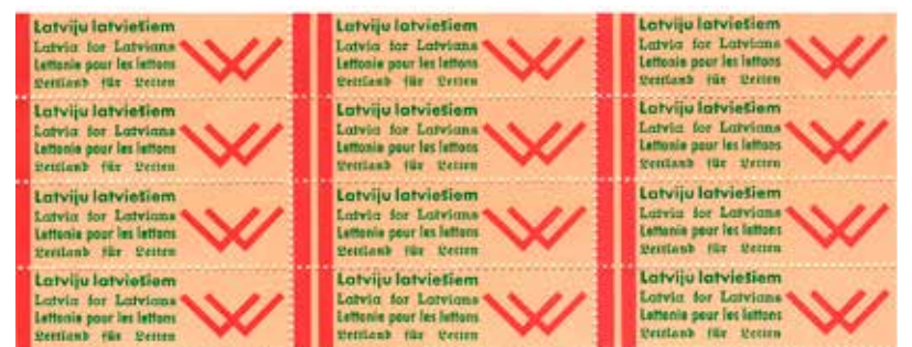
Uzlīmes ar Ulža Gravas saukli "Latviju latviešiem" izmantotas līmēšanai uz aploksnēm, blociņos u. c.

Aicinām arī Jūs, cienijamo lasītāj, kļūt par Likteņdārza atbalstītāju! Aicinām piedalīties mūsu pasākumos vai arī ziedot, naudu ieskaitot