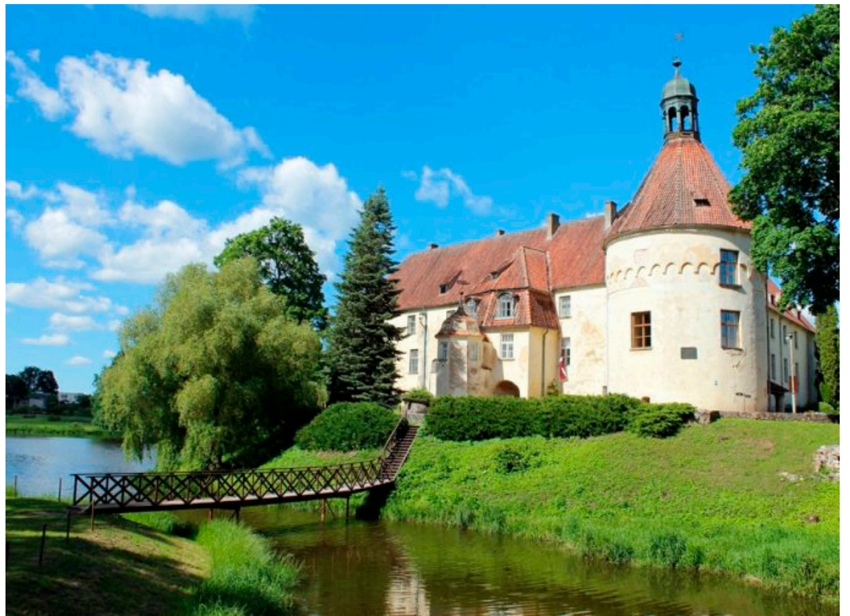
Jaunpils pilij ir septiņu gadsimtu sena vēsture. Sākta celt 1301. gadā, kad Livonijas ordeņa mestrs ir Gotfrīds fon Roga (1298-1306), un kalpojusi kā Dobeles komturejas palīgpils. Tagad tā ir tūristu un ekskursantu iecienīta vieta, kā arī šeit labi jūtas 3x3 saieša dalībnieki