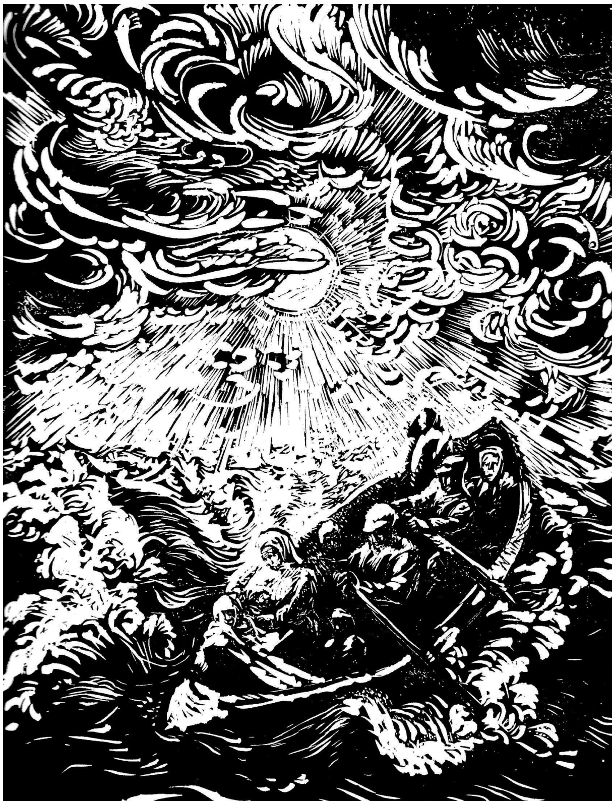
Bēgļu laiva. 1948 (linogriezums, 90x73,8)

Rojā skatāmā ekspozīcija ir mākslinieces trešā peķaŗa izstāde Latvijā (pirmā – Talsu muzejā 2004. gadā, otrā – Latvijas Nacionālajā mākslas muzejā Rīgā 2006. gadā). Ieskatu, ka tuvākajā laikā jārupējas par viņas darbu pieejamību monografiskā izdevumā. Tas mūsu pašu labad, lai varam tālu aizstaigāt domās, sajūtās, pieredzē, zināšanās.