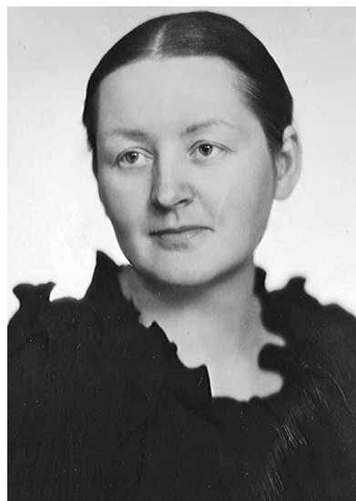
Māksliniece 1944. gada vasarā Rīgā