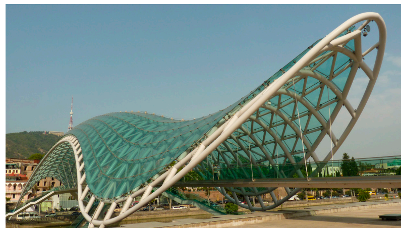
Gruzijas galvaspilsētas Tbilisi jaunā arhitektūra