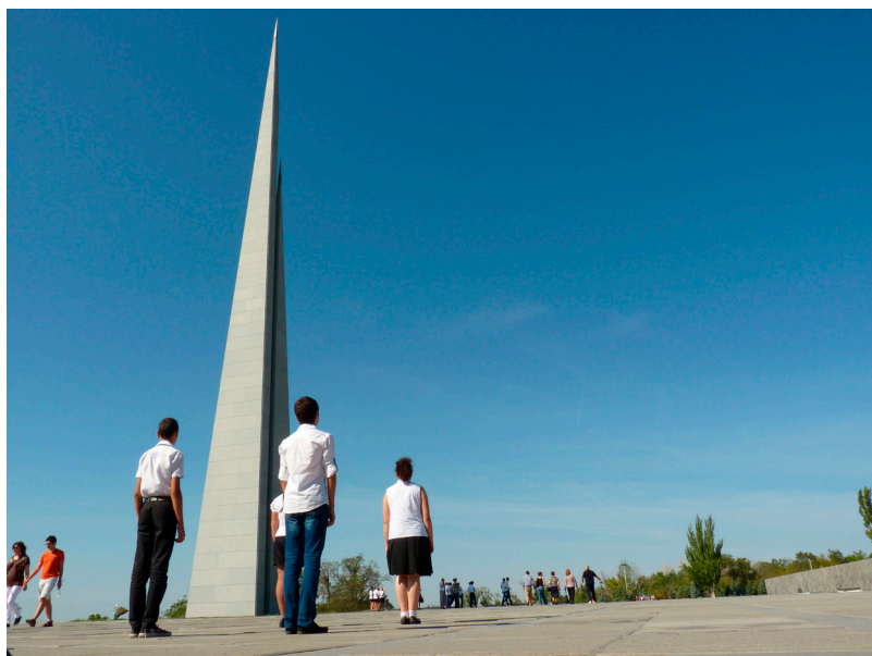
Skolēnu goda sardzes Genocīda piemiņas memoriālā Erevānā

Vienlaikus nevienā citā bijušajā padomju republikā neesmu novērojis tik pretrunīgu attieksmi pret padomju laiku pagātni. Vēl šodien Gruzijā var sastapt gadus vecākus cilvēkus, kuŗi apgalvos, ka “Stalīns neko nezina par čekistu represijām, viss notika aiz viņa muguras”. Ka Gruzijas neatkarība esot laba lieta, bet viss pārējais, kas sekojis pēc tās – īsta katastrofa. Tik bieži dzirdēts stāsts – padomju laikos dzīve bija vienkārša un droša, ne par ko nebija jāuztraucas, ārsts par brīvu, skolas par brīvu, braucām uz Maskavu skatīties Lielo teātri utt. Bet šodienas jauniešiem ir citas problēmas, un stāsti par padomju laiku “labumiem” tiem šķiet vien sena pasaka. Pašā galvaspilsētas Tbilisi centrā, Rustaveli prospektā, apskatāma piemiņas plāksne ar uzrakstu gruzīnu un angļu valodā: “1956. gada 9. marta padomju represiju upuriem.” Taču patiesībā gruzīniem diezin vai vajadzētu lepoties ar to dienu notikumiem. Masu protesti Tbilisi izcēlās dažas dienas pēc Nīkītas Chruščova runas Kompartijas XX kongresā 1956. gada 25. februārī, kuŗā tika atmaskoti Stalīna noziegumi. Sadur-