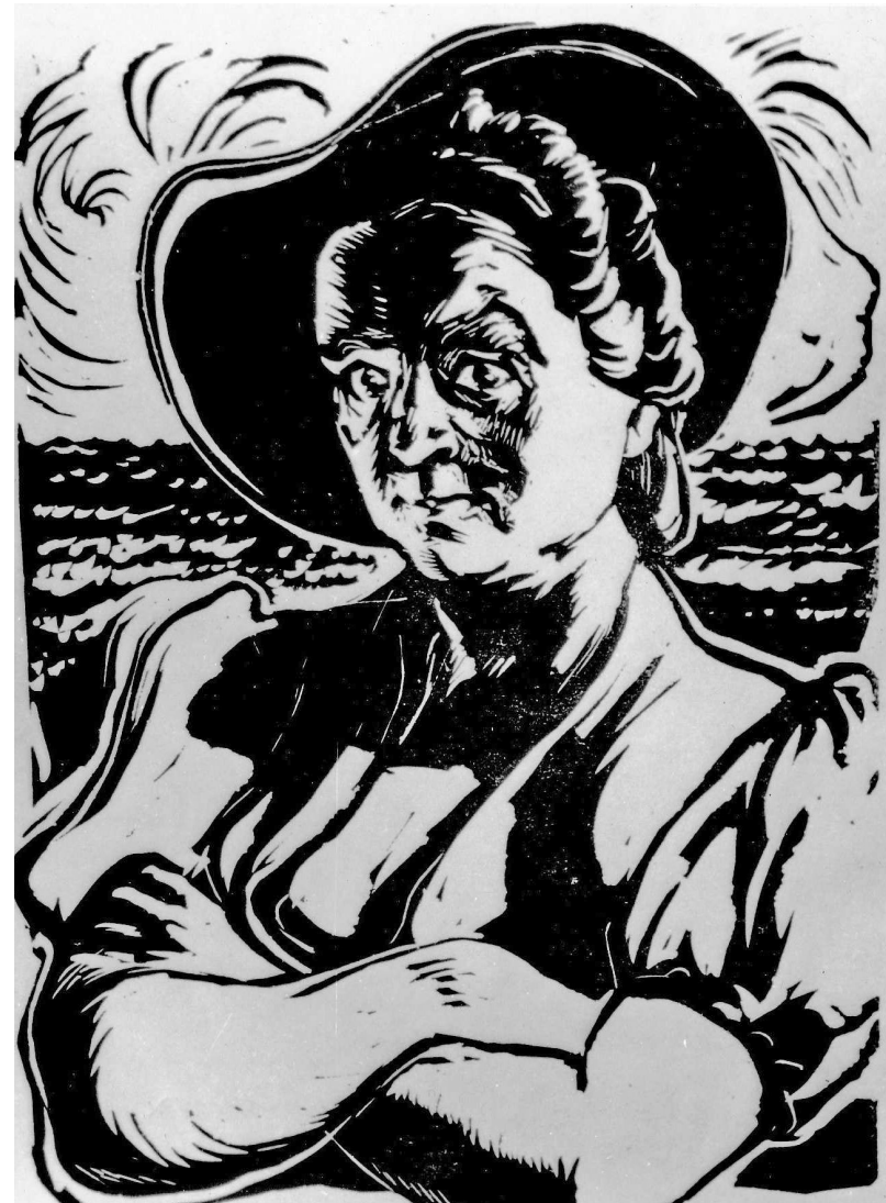
Pašportrets. 40. gadu nogalē Zviedrijā (linogriezums, 20x16 cm)