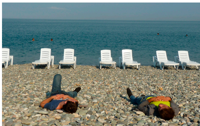
Gruzija, Batumi pludmale

nav aizmirsusi Turcijas varas iestāžu genocīdu pret armēņu tautu 1915. gadā. Toreiz gāja bojā 1,5 miljoni cilvēku, gandrīz visi tagadējās Turcijas teritorijā dzīvojošie armēņi. Bieži esmu domājis – kāpēc ir grūtāk pastāstīt pasaulei par bolševiku zvēribām nekā par nacistu veiktajiem briesmu darbiem? Šķiet, atbildi uz šo jautājumu atradu Genocīda memoriālā Erevānā. Tā bija pirmā masu slepkavība cilvēces vēsturē, kas tika fotografēta. Līdzīgi rīkojās arī nacisti – atšķirībā no čekas bēdēm, kuŗi savus noziegumus rūpīgi slēpa. It īpaši jau tīmekļa laikmetā, kad cilvēki informāciju aizvien biežāk iegūst nevis lasot, bet gan uztver to vizuālos tēlos, šīs apsūdzības fotogrāfiju formā kļūst aizvien spēcīgākas. Armēņu slaktiņa laikā varmākas labprāt pozēja blakus saviem upuriem – gan pirms, gan pēc to noslepkavošanas. Īpaši šausalīgi ir attēli, kuŗos bēdēs un vēl dzīvie upuri kopā raugās kameras objektīvā. Pēc ne-