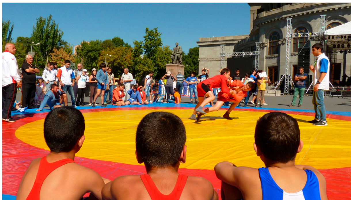
Sacikstes brīvā dabā. Armēnija, Erevāna

Tā nu Kaukazs ir un paliek īsts pretrunu mezgls ar lielu konflikta potenciālu. Gruzija raugās uz Eiropu, Armēnija – uz Krieviju, savukārt Azerbaidžāna – uz Turciju. Turpat blakus Abhāzija un Dienvidosetija – formāli neatkarīgas valstis, faktiski Krievijas okupētas Gruzijas teritorijas. Armēnijas un Azerbaidžānas vidū valda saspīlējums, kas brīžam balansē uz jauna kara robežas. Ziemeļos – nemierīgās Krievijas musulmaņu republikas, dienvidos – Turcija un Irāna. Te vietā izteikt komplimentu Latvijas diplomātijai, kuŗai pagaidām izdevies izlavierēt šajā mīnu laukā un uzturēt labas attiecības ar visām trim Kaukaza valstīm. Jautājums – cik ilgi vēl.