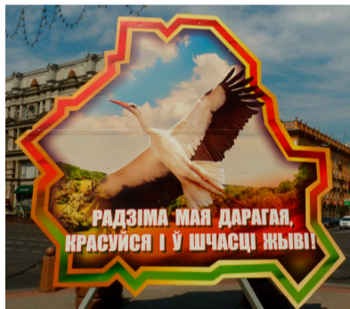
Viens no nācijas simboliem – stārķis

Kā lai izskaidro šo Baltkrievijas fenomenu? Baltkrievi joprojām