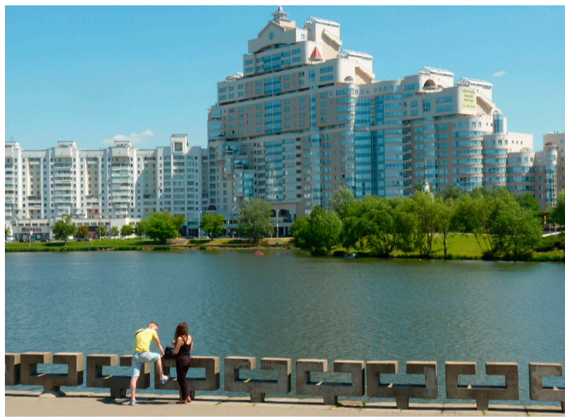
Jaunā Minska

ciālās informācijas parādīšanās tikai baltkrievu valodā ir varas iestāžu pēdējos gados sāktās “maigās baltkrievizācijas” politikas rezultāts.