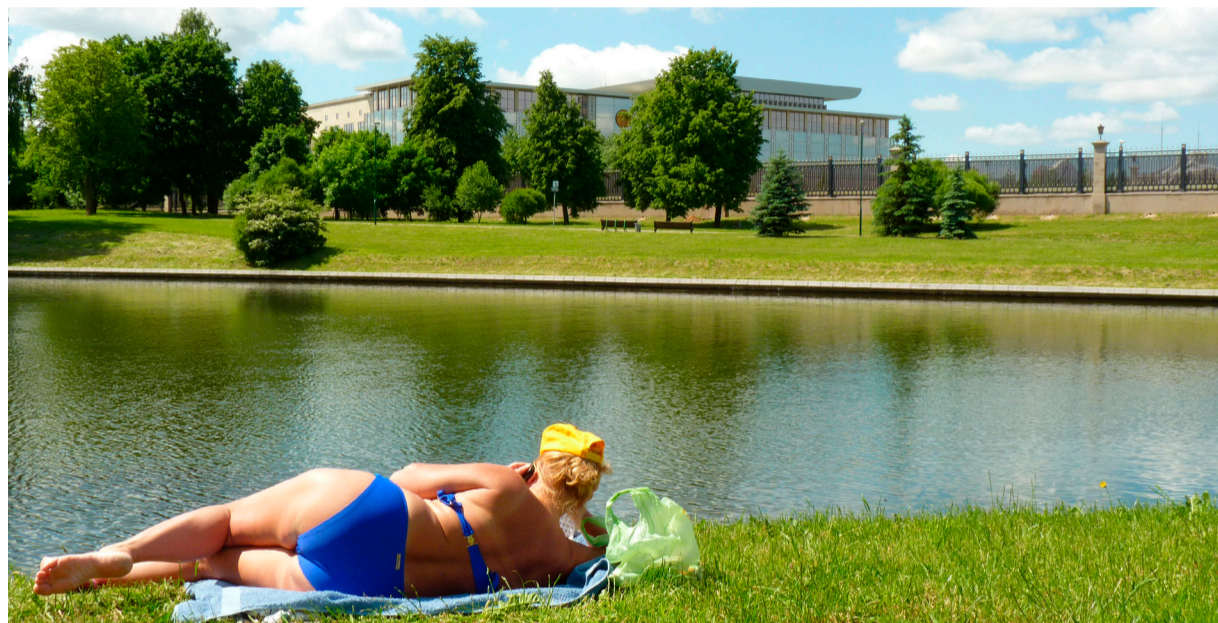
Pludmale Minskas centrā. Fonā prezidenta Lukašenko pils

Bet Baltkrievija ir svarīga arī Latvijai, patiesībā visai Eiropai. Latvijai un Baltkrievijai ir 161 kilometru gara kopēja robeža. Lai gan Baltkrievija nav starp lielākajiem Latvijas tirdzniecības partneriem, tai ir svarīga loma tranzītā.