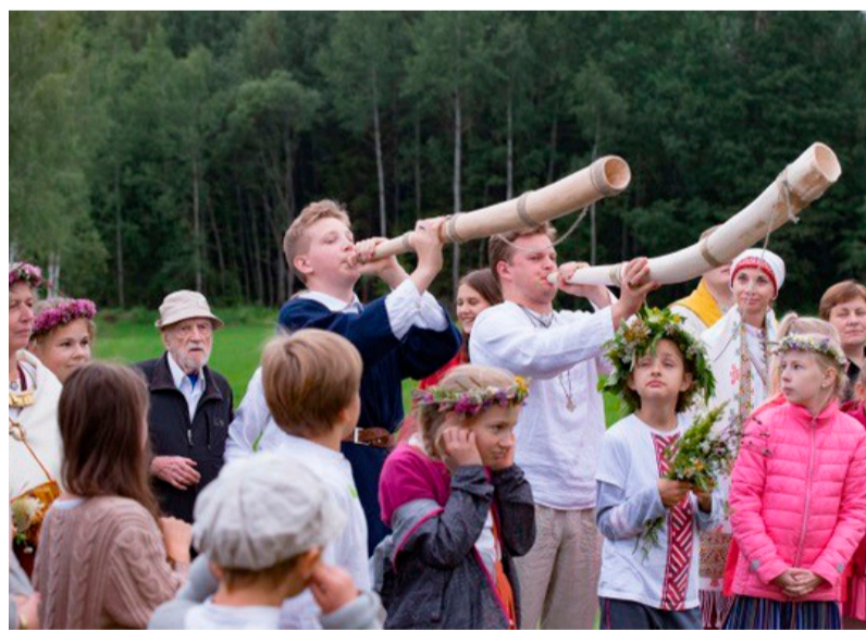
Pašu darinātās koka taures skaisti skanēja daudzdzinājumā

Saieta jaunākā paaudze iepazīna Balto kaķīti ievirzē “Kaķīša dzirnavas”, izzināja meža vērtības –