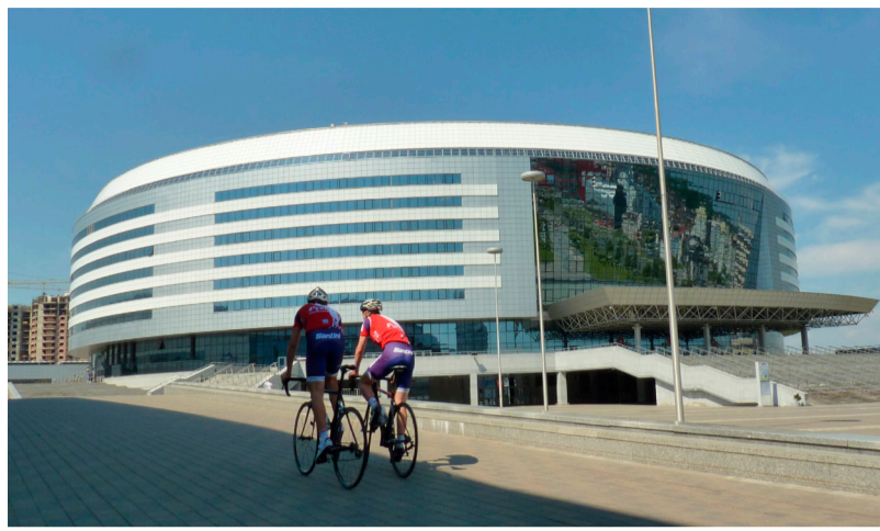
Nesen uzceltā Minskas sporta pils // Foto: Juris Lorencs