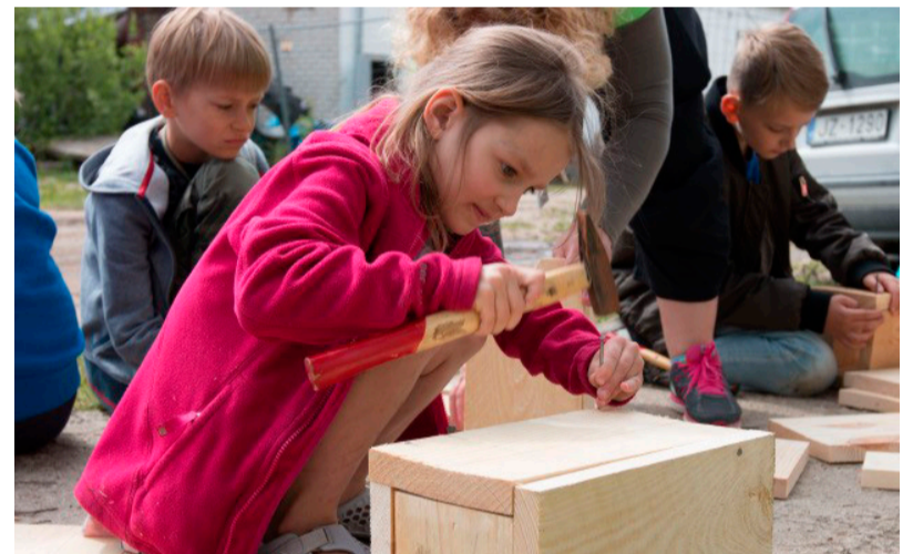
Meža gudrību ievirzē varēja sanaglot putnu būrīti