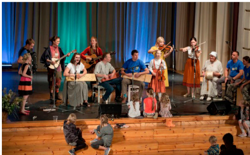
Saieta dalībnieku mūzikāls priekšnesums “Brīvajā mikrofonā”