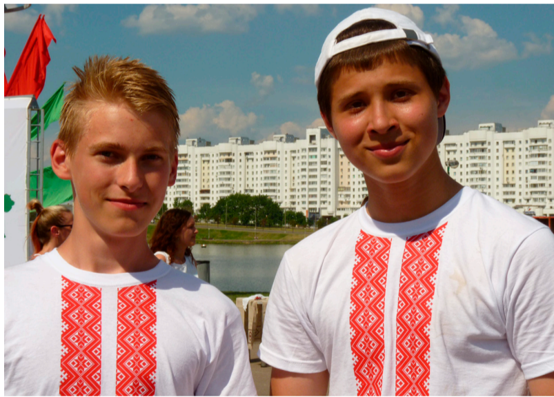
Puiši tautiskos kreklos

dzīvo savdabīgā valsts kapitalisma un sociālisma sajaukumā – garantētas darbavietas valsts iestādēs un valstij piederošos uzņēmumos (tajos nodarbināti aptuveni 45% no visiem strādājošajiem), subsīdēti sabiedrisko pakalpojumu tarifi. Plašais valsts sektors izskaidro zemo bezdarba līmeni – tikai 1%. Tomēr taisnība tiem, kuŗi apgalvo – šī relatīvā labklājība tiek nodrošināta ar Krievijas palīdzību. Faktiski Baltkrievija tiek uzpirkta, pirmām kārtām ar lētām naftas un gāzes cenām.