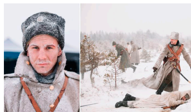
"Dvēseļu putenis"