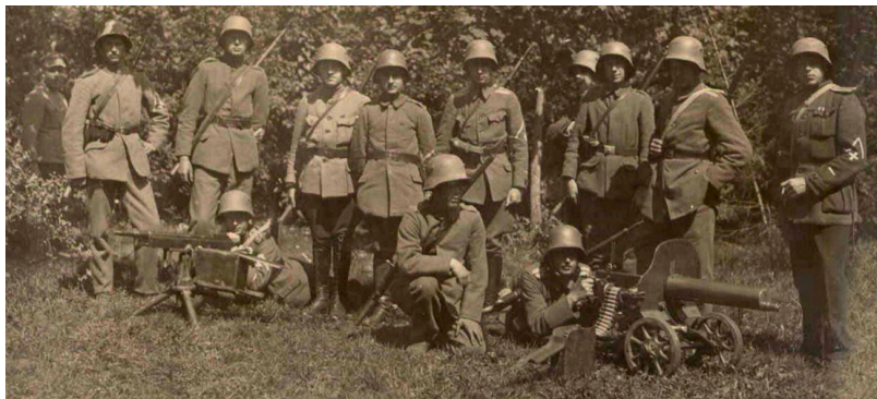
Livena nodaļas karavīri 1919. gada vasarā

Latvijas Neatkarības kara (1918 – 1920) norisēs ārkārtīgi svarīga loma bija ne tikai latviešiem, bet arī citu Latvijā dzīvojošo tautību pārstāvjiem. 1920. gadā Latvijā dzīvoja 91 tūkstoši krievu, 79 tūkstoši ebreju, 66 tūkstoši baltkrievu, 58 tūkstoši vāciešu un 52 tūkstoši poļu. Mazākumtautības bija pārstāvētas gan Latvijas Tautas padomē, gan Latvijas Pagaidu valdībā (vairāki minoritāšu pārstāvji ieņēma ministru un ministru biedru posteņus, kā arī pildīja Valsts kontrolieņa pienākumus).