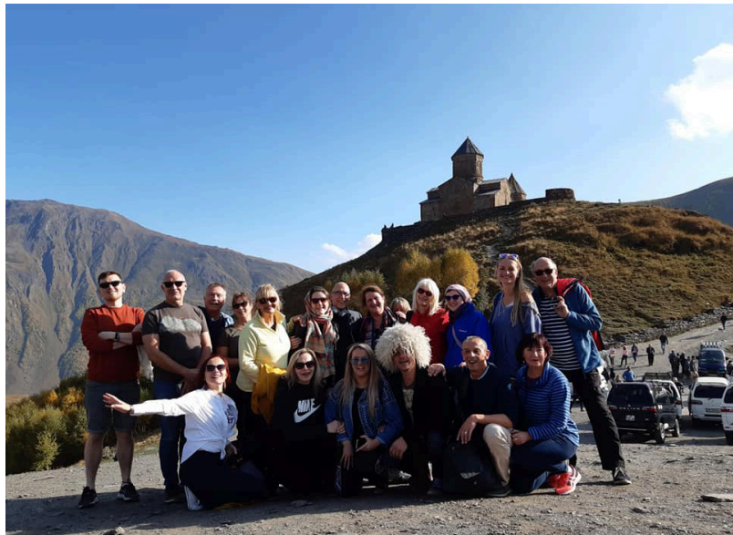
Pie Gergeti Svētās Trīsvienības baznīcas Kaukāzā