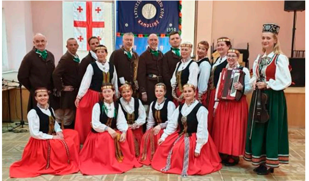
Gruzijas latviešu biedrības Ave Sol 25 gadu jubilejā

Nākamajā dienā mūs gaida ceļojums pa slaveno Gruzijas Kaŗa ceļu. Gruzijas Kaŗa ceļš ir vienīgā saikne ar šo nepakļāvīgo zemi no Ziemeļiem. Aptuveni 200 km garais kalnu ceļš jau kopš 1. gadsimta ir bijis vienīgais veids, kā Ziemeļu kaimiņiem tirgoties, kaŗot un viesoties Gruzijā. Mūsu ceļa mērķis – redzēt slaveno kalnu Kazbegi – Gruzijas augstāko virsotni un trešo augstāko Kaukāzā (5047 m virs jūras līmeņa). Gruzīni paši šo kalnu sauc par Mkinvari – kalnu ar ledus cepuri. Pa ceļam ik pa brīdim apstājamies fotografēties pie skaistiem, vareniem dabas skatiem. Un ceļš ved aizvien kalnup – preti debe-