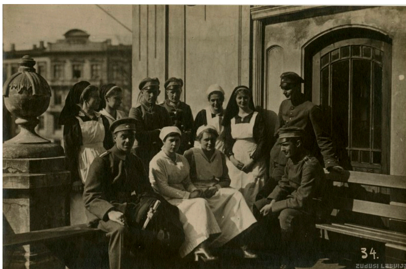
Baltijas Landesvēra karavīru lazarete Liepājā

Kalendārs tapis sadarbībā ar latviesiem.com