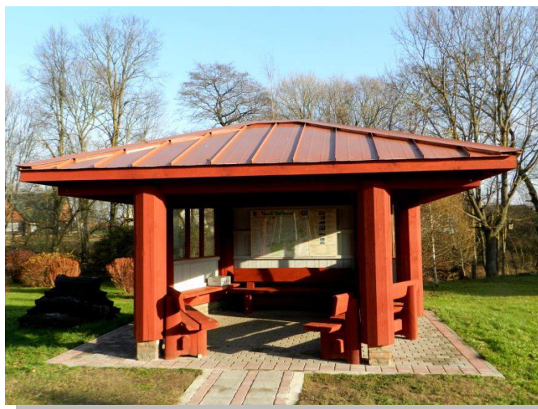
Tūrisma informācijas stends