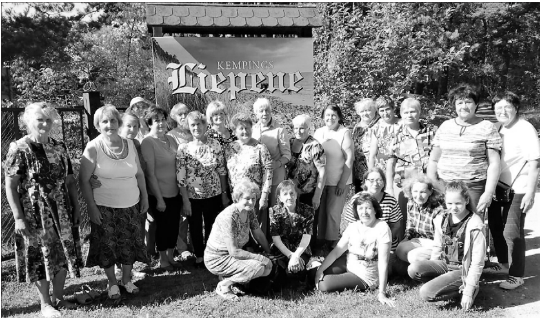
Kopīgs foto atmiņai Liepenē.