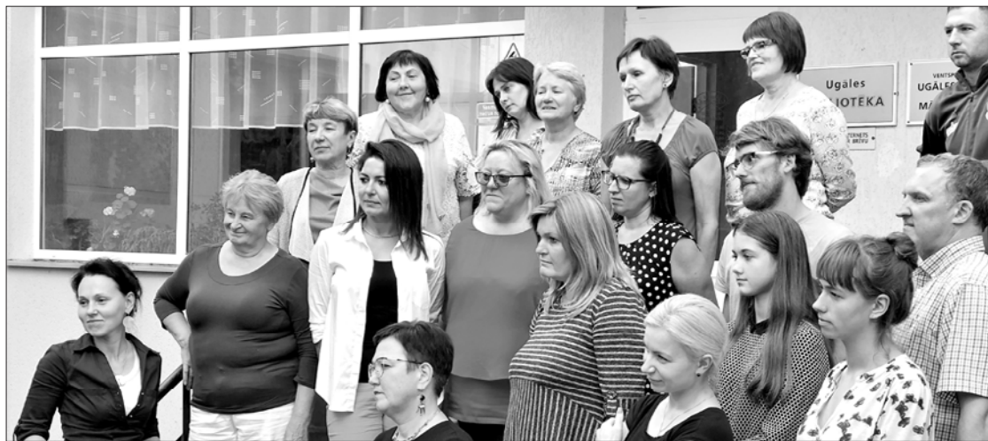
Daļa semināra dalībnieku pēc ražīga darba cēliena.

Kādas tad bija biežāk izteiktās ugālnieku vajadzības un vēlmes? Nepieciešams atjaunot kultūras nama ēku. Uģālē ir vairāki vecie "centri", kuri iegrimuši aizmirstībā un drupās. Nav ērtu pastaigu taku – Uģāle sadrumstalota, būtu jāatjauno "artērijas", kas to reiz vienojušas, kā arī jāveido jaunas – velociņi, nūjošanas takas. Ar šīm takām varētu iedzīvotājiem un popularizēt pagasta vēsturi. Uģālei nav savas vienotas identitātes. Lai arī pa Ventspils–Rīgas šoseju pagastam cauri izbrauc liels skaits automašīnu, nav padomāts par to, lai ceļinieki šeit gribētu apstāties un uzskatīties. Ir jauna tirgus ēka, taču tā funkcionē tikai dažas stundas nedēļā; tajā pašā laikā ir daudz mājražotāju, kuru preces varētu realizēt arī ārpus Uģāles. Nav estrādes. Uģālē būs jauna sporta manēža, bet būtu jāpadomā par stadiona atjaunošanu un vispusīgu sporta centra attīstīšanu. Uģālē nav viesu izmitināšanas iespēju, arī sabiedriskās ēdināšanas pakalpojumi varētu būt patērētājam draudzīgāki.