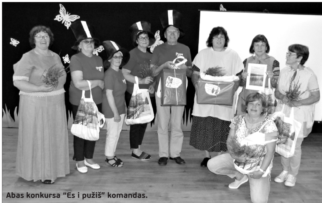
Abas konkursa "Es i pužiš" komandas.

24. augustā Blāzmā valdīja sportiska gaisotne – notika veselības dienas aktivitātes, un ikviens interesents varēja atrast sev piemērotu sportisku nodarbi. Bija dažādas atrakcijas un sacensības bērniem, baskāju taka, radošās darbnīcas svaigā gaisā, riteņbraukšana – velofoto-orientēšanās, veiklības stafetes, futbola spēle, ūdens atrakcijas un citas aizraujošas nodarbes.