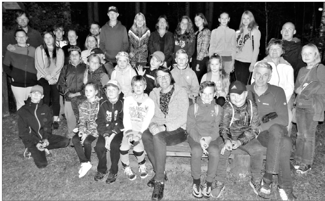
Mazpulcēni kopā ar saviem atbalstītājiem nakts pārgājienā.