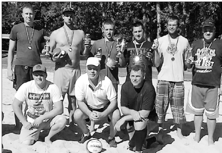
Pludmales volejbola turnīra dalībnieki.