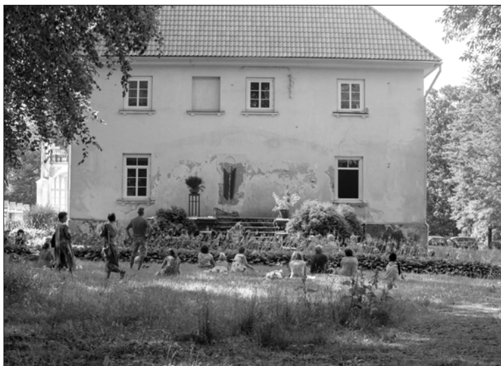
Dziesminieces Antas Eņģeles koncerts pie aizmūrētajām Saullēkta durvīm.

Pavasārī pirms trīs gadiem Popes kalnā satikās spīšanas. Divas no Popes, divas no Liepājas. Un lēma augusta pilnmēnesī tolaik vēl aizaugušajā brīvdabas estrādē vērt VĀRTUS. Dziesminieku VĀRTUS Kurzemē. Un tā arī notika – tautā pazīstami un arī mazāk zināmi dziesminieki 2016. gada 18. augusta vakarā atvēra sevi notikšanai, kurai arī turpmākajos gados būs vēlēti Popes kalnā pulcēt ļaudis.