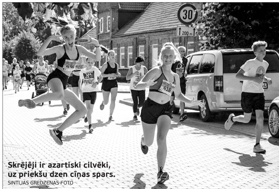
Skrējēji ir azartiski cilvēki, uz priekšu dzen ciņas spars.