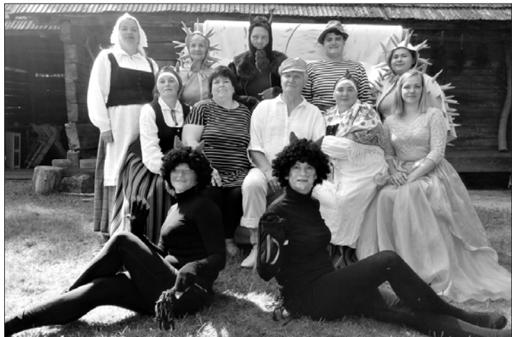
Kolektīvs "Un tā tālāk" izrādīja R. Blaumaņa lugu "Velniņi".