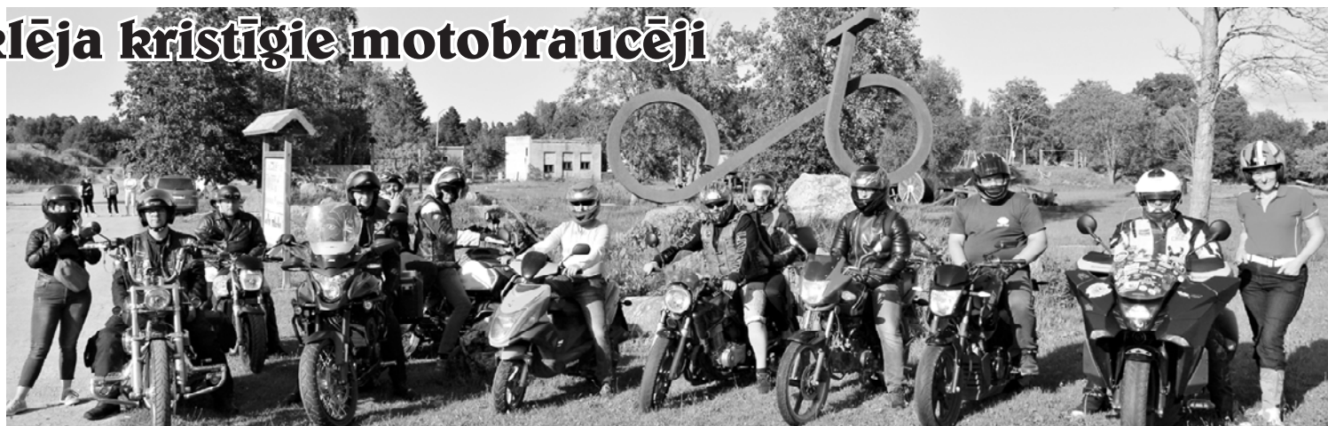
Kristīgie baikeri no visas Latvijas un ugālnieki.

Triāla trasē uz tusiņu pulcēšanās ciema ļaudis, lai satiktos ar baikeriem. Bija sarūpēta soļanka. Mielojoties klausījāmie motobraucēju dzīvesstāstus, kā Dievs iedod jēgu dzīvei un virza augšup, palīdz atbrīvoties no dažādām atkarībām, kas izposta dzīvi. Uz jautājumu, kāpēc jāiet baznīcā, viens no baikeriem atbildēja: "Man patīk, ka man izskalo galvu no visa, kas nedēļas