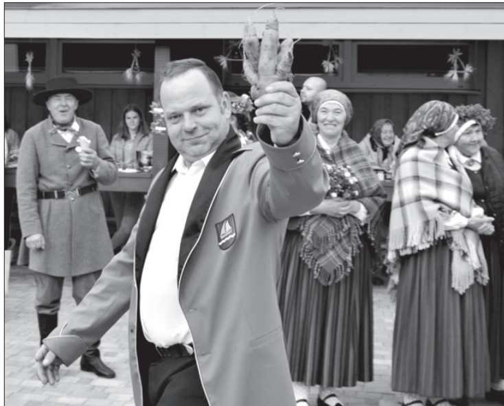
Skat, kādi burkāni aug Uģālē!