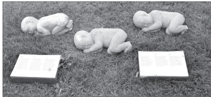
Mazie akmens ķermenīši liek aizdomāties par dzīvības svētumu.

Uz vienas plāksnītes atrodams šāds uzraksts, arī angļu un krievu valodā: "Mans tētis mani negribēja. Viņš vainoja mammu par to, ka esmu pieteicies, un teica: "Tu man tāda neesi vajadzīga." Izrādās, tā ir Uģāles evaņģēliski luteriskās draudzes iniciatīva, tādējādi atsaucoties kampaņai "Par dzīvību". Tās rīkotāju mērķis ir pievērst sabiedrības uzmanību faktam, ka dzīvība sākas no ieņemšanas brīža. Mājaslapā www.pardzivibu.lv norādīts: "Vai mums ir tiesības lemt par cita cilvēka dzīvību? Vai mēs paši būtu ar mieru, ka kāds cits izlemj – dzīvot vai nedzīvot mums? Stāsti par to, kā viens cilvēks ir nolēmis citus cilvēkus nāvei, pieder vēstures traģiskā-