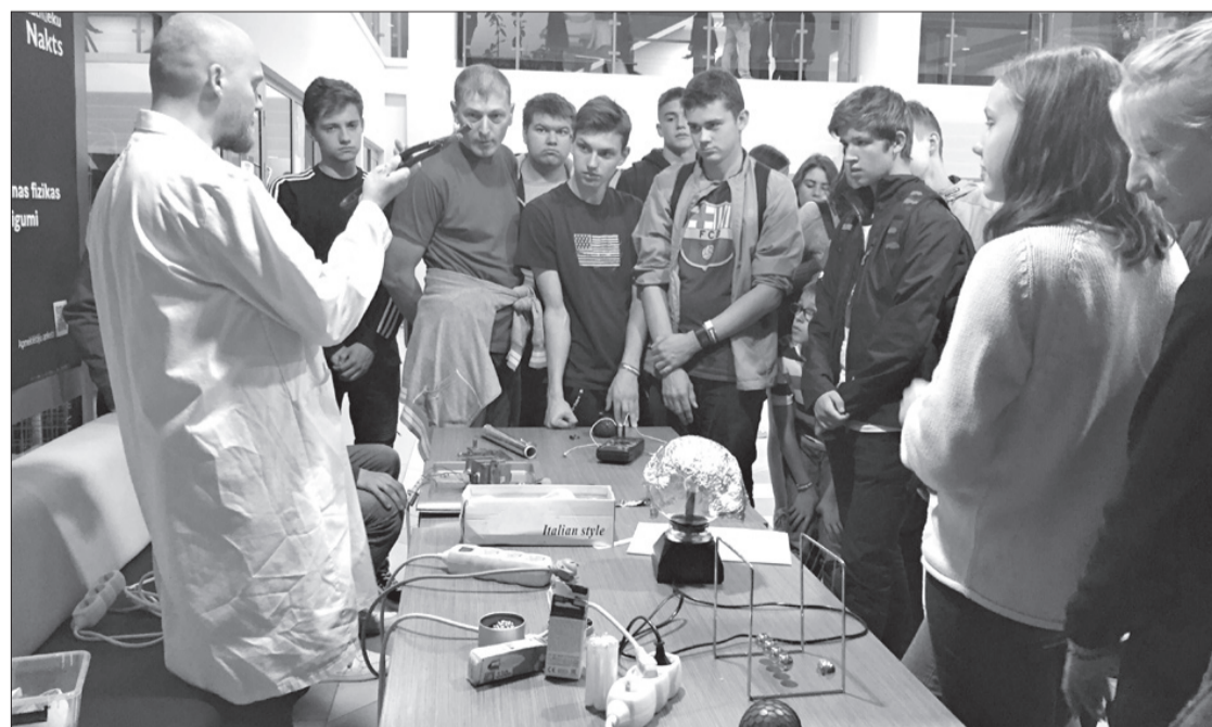
Uģālnieki ar interesi klausās profesionāļa teiktajā.