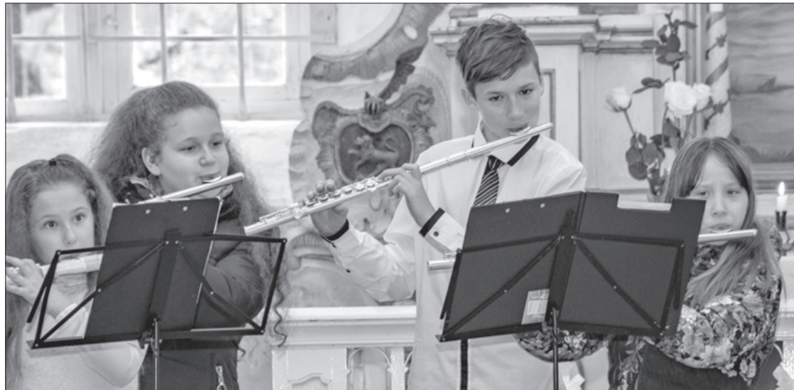
Mūzikas skolas audzēkņi muzicē Piltenes luterāņu dievnāmā.