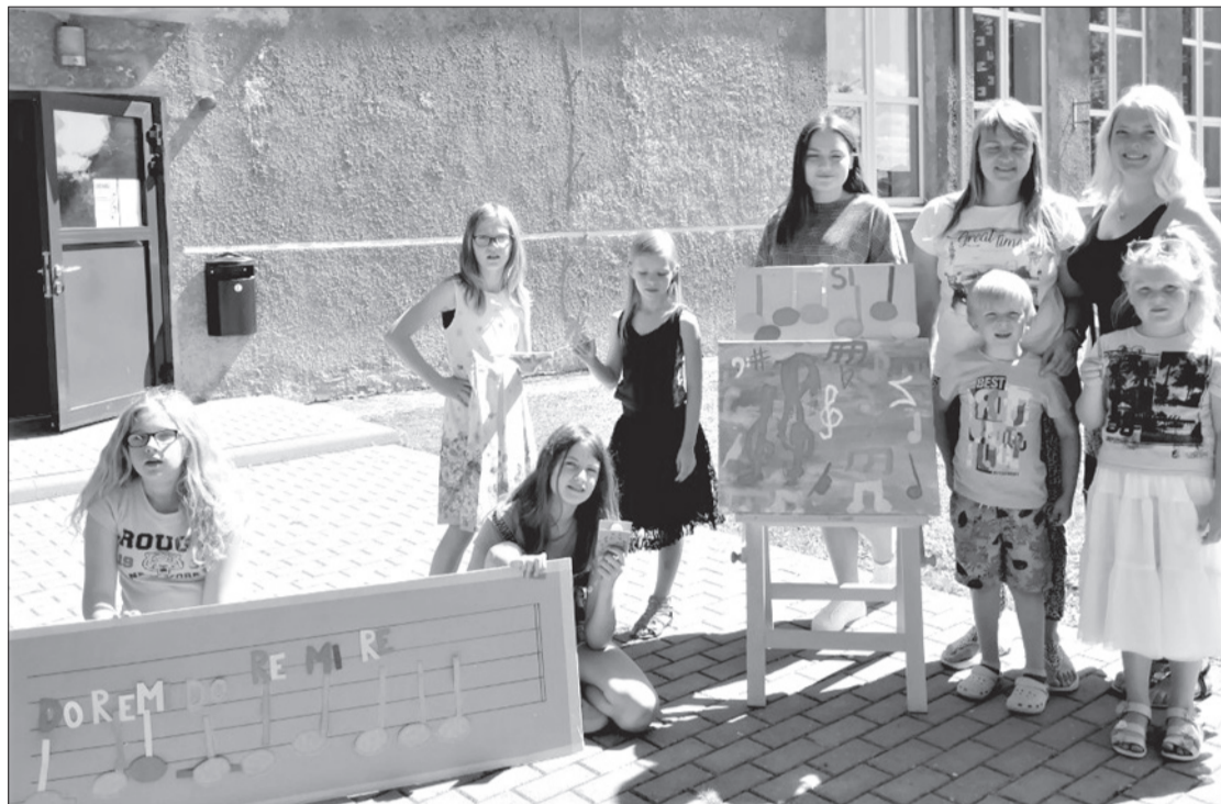
Ir tapusi muzikālā glezna – prieks pasniedzējam un projekta dalībniecēm.

Tikpat aizraujoši un rosīgi Zlēku jaunieši darbojās pašvaldības projektu konkursa "Jaunietis darbībā 2019" pasākumā "Šujam paši". Dienas centrā tika organizētas tematiskās nodarbības, lai apgūtu sadzīvē nepieciešamu prasmi – šūšanu. Nodarbību laikā jaunieši iepazīna šūšanas piederumus un iekārtas, šūšanas tehniku un audumus, mācījās darboties