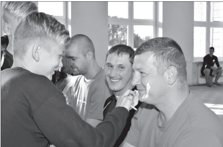
Dēli mēģina tēviem "nodzīt" bārdū.

6. septembra pēcpusdienā Ugāles vidusskolā norisinājās Tēva dienas pasākums. Tēvi kopā ar saviem bērniem piedalījās dažādās spēlēs un aktivitātēs. Pirmais iesildīšanās uzdevums bija erudīcijas konkurss, kurā mēs pārbaudījām, cik labi tēvi pazīst savus bērnus un cik labi bērni tēvus. Tēviem pārdomas raisīja jautājums: kāda bērna skatījumā ir labākā dāvana, ko tēvs viņam uzdāvinājis? Pēc tam pārbaudījām tēvu prasmi bižu pišanā, savukārt dēli mēģināja noskūt bārdū tēvam, šoreiz, protams, bez īsta skuvekļa. Nākamā bija uzticības stafete. Bērni vadīja savus tēvus pa šķēršļu joslu, jo tēviem bija aizsietas acis, viņiem bija jāuzticās bērna norādēm. Lai būtu interesantāk, aiz katra pāra šķēršļu josla tika mainīta. Spriežot pēc bērnu smiekliem un entuziasma, šī atrakcija viņiem patika vislabāk. Pēdējā aktivitāte bija stafete. Izveidojām divas vecāku un bērnu komandas. Šajās stafetēs uzvarētāju nebija, jo svarīgākais bija kopā pavadītais laiks un iegūtās sajūtas. Pasākumu noslēdzām ar klišēri un kopīgu foto. Šis bija pirmais gads, kad mūsu skolā tika atzīmēta Tēva diena. Par pasākumu ir labas atsauksmes, par to esam gandarīti. Paldies pašpārvaldes pārstāvjiem par ieguldīto darbu! Cerams, ka tradīcija turpināsies.