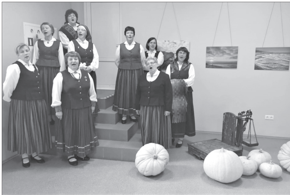
Folkloras kopas "Pūnika" dziedātājas ar zeltainajiem ķirbjiem.