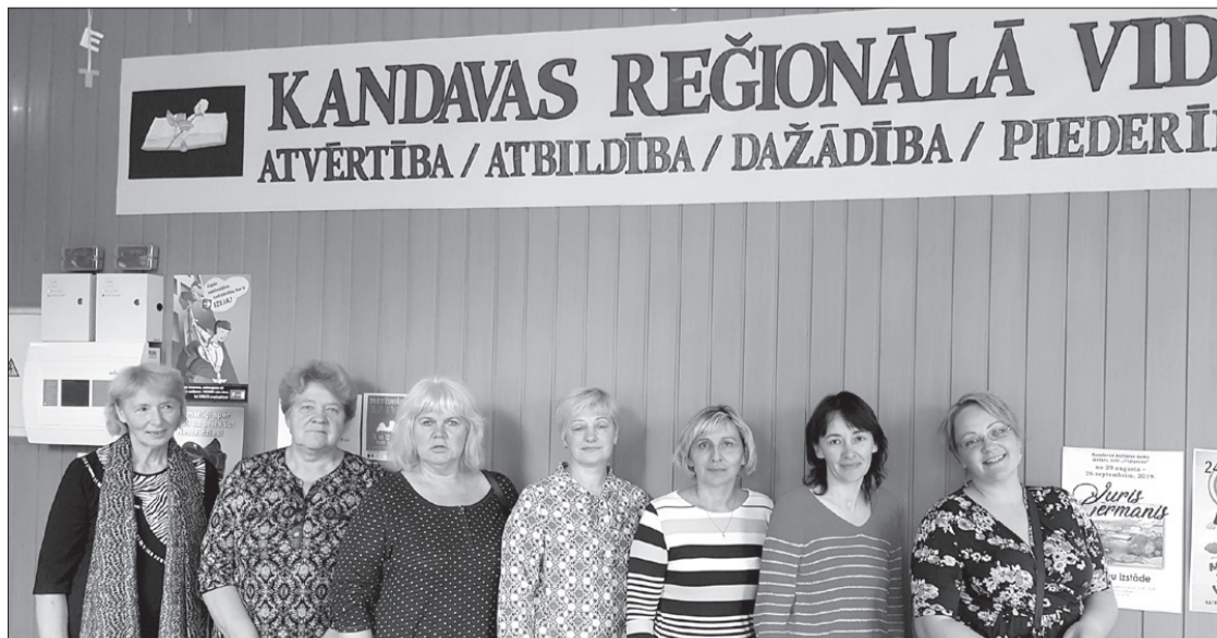
Latviešu valodas un literatūras skolotājas pieredzes apmaiņas braucienā Kandavā.