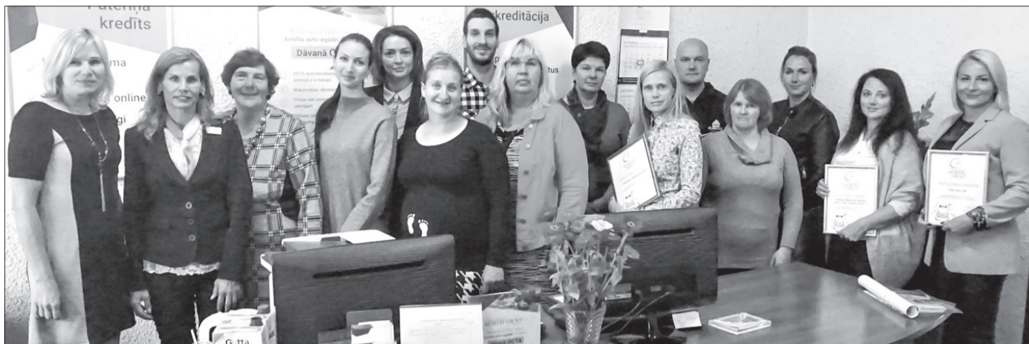
Daļa akcijas atbalstītāju, "InCREDIT GROUP" pārstāves, Sociālā dienesta darbinieces un palīdzības saņēmējas.

18. septembrī notika labdarības projekta noslēguma pasākums Ventspilī, kura laikā "InCREDIT GROUP" pārstāves atdeva saziņotās lietas Ventspils novada Sociālā dienesta darbiniecēm. Tas bija viens no projekta patīkamākajiem brīžiem, jo tieši tad