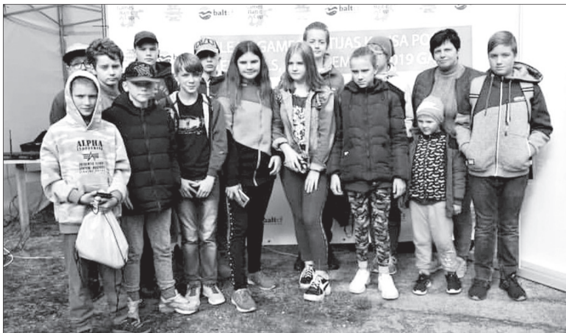
Zūru pamatskolas pārstāvji talkas dienā poligonā.