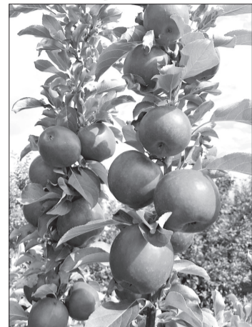
Zemnieku saimniecībā "Rozītes" ienākusies bagātīga ābolu raža.

Ābelēm augot un to vainagiem izplešoties arvien lielākiem, ar lielu traktoru (80 zs) bieži vien nav iespējams izbraidīt starp augļkoku rindām, veicot dārza apļaušanu, tāpēc nepieciešama tehnika un aprīkojums ar mazākiem gabarītiem. Iegādājoties šāda veida pļaujmašīnu, saimniecībai ir divkārtšs ieguvums, jo pļaujmašīna atbilst maza gabarīta traktoram (50 zs) un ir aprīkota ar papildu "roku", ar kuras palīdzību, netraumējot apakšējos zarus, iespējams izpļaut arī zāli, kas vietām aug zem augļkoku vainaga. Šī papildu "roka" izvīrās zem koka, noplauj zāli, ar sensora palīdzību