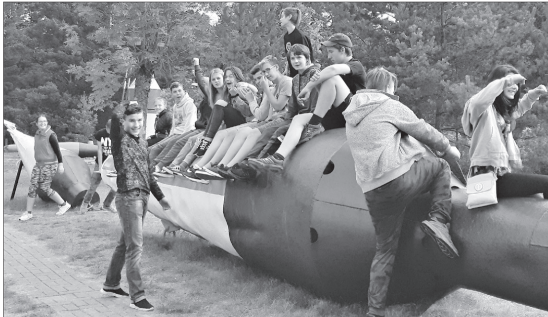
Ances pamatskolas audzēkņi iešūpina no jūras izvilkto boju.

Vārves kultūras darba organizatore Inga Berga