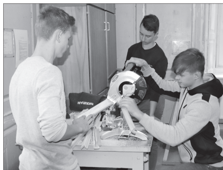
Mājturības kabinetā puīši darināja sagataves puķu kastēm.