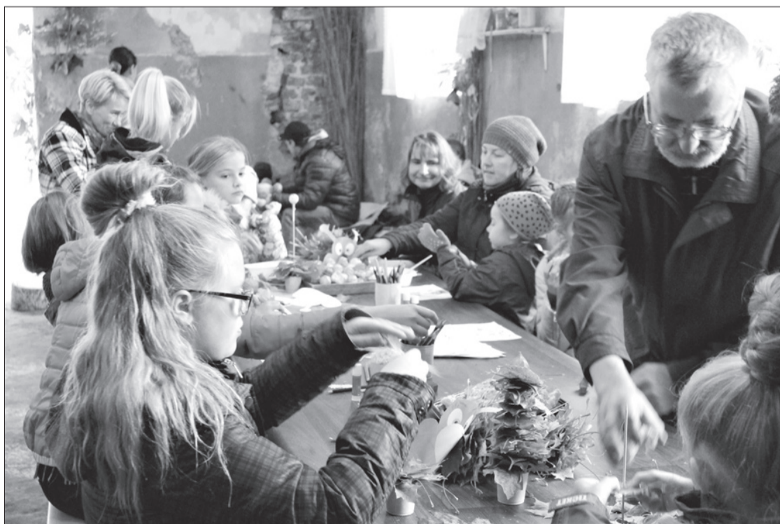
Darbnīcā tapa svētku dekori.