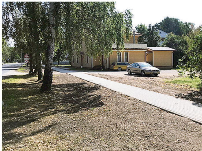
Izbūvētās ietves platība ir 160 m 2 , garums – 110 m.

Būvdarbus veica uzņēmums SIA „GP Holding” no 11. līdz 31. jūlijam. Projekta kopējās izmaksas – 19 358,85 eiro.