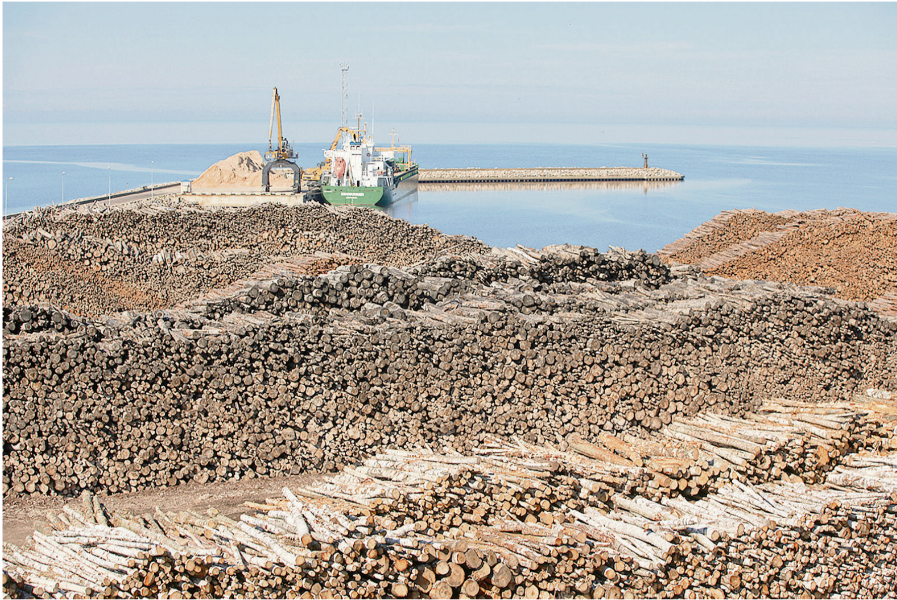
„Skultes kokosta” savu darbību Zvejniekiemā uzsāka 90. gadu vidū, bet jau aptuveni 2000. gadā – būtisku ostas modernizāciju.

„Visu ostas infrastruktūras objektu – piestātņu, noliktavu, termināļu –, ko tagad redzam Aģes upes grīvā, būvēšanai bija vajadzīga nauda, un nauda tiek ieguldīta viena banka neko nedotu, ja ne-