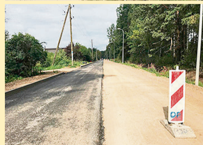
Upes iela un Melnsila iela.

Upes un Melnsila ielās, kā arī Jūras prospektā būvdarbi ir jāveic līdz septembra beigām, taču būvnieki ziņo: ja nebūšot neparedzētu sarežģījumu, Melnsila ielu izdosies pabeigt jau ātrāk – augusta beigās.