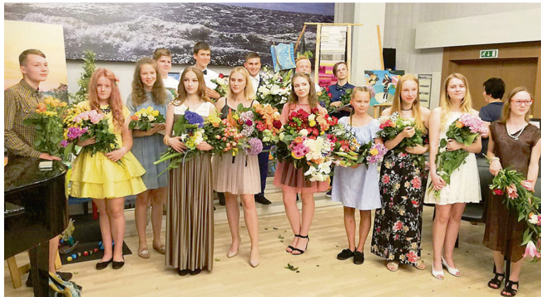
Šī mācību gada absolventi.

Izlaiduma svinību koncertā mūzikas nodaļu absolventu izpildījumā skanēja Dž. Kačīni,