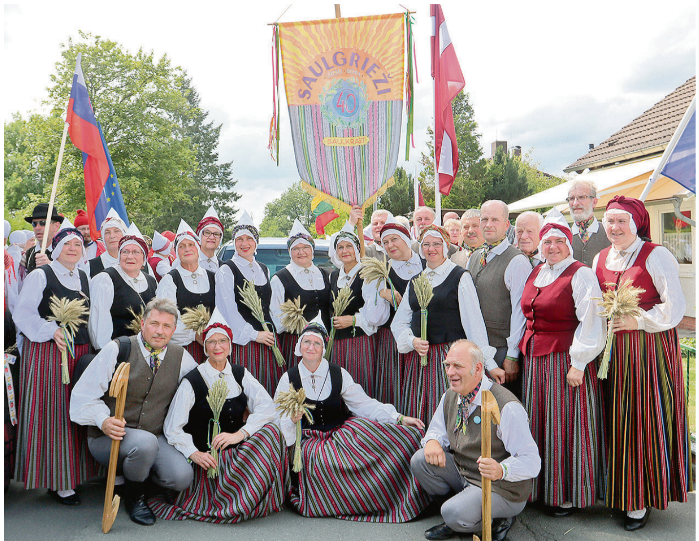
Senioru deju kolektīva „Saulgrieži” dalībnieki.

Festivāla atklāšanas koncertā deju kolektīvi devoja Jāņa Ērgļa kompozīciju „Jautrais stūris”, par ko saņēma lielas skatītāju ovācijas, jo demonstrēja visskaistāko, kas raksturo mūsu dejošanas kultūru un tradīcijas, – brīnišķīgus tērpus, saskaņotus un daudzve-