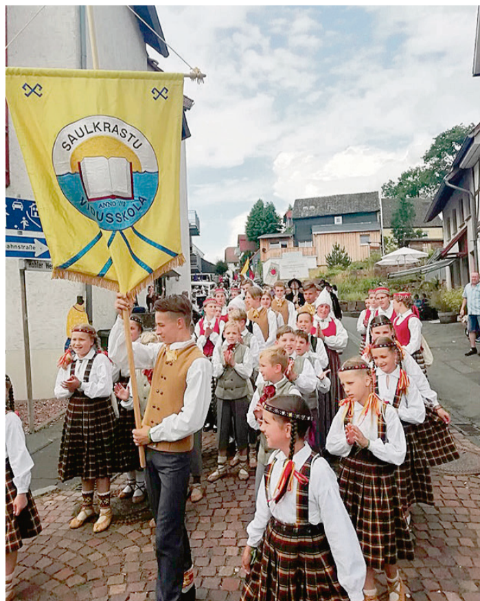
„Saulītes” dejojāji gājiena laikā Frankenbergā.