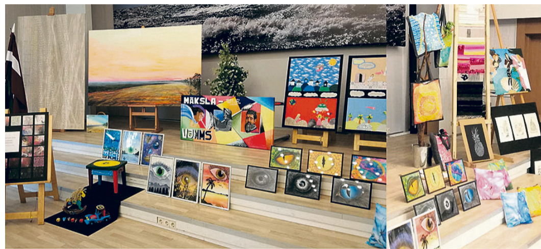
Ieskats Mākslas nodaļas absolventu diplomdarbos.