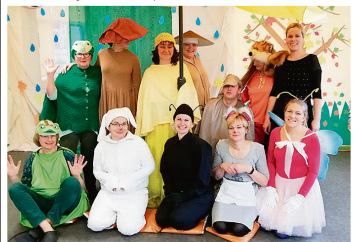
„Rūķīša” mākslinieciskais kolektīvs.