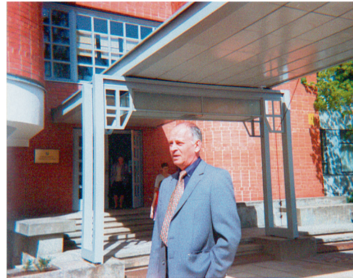
Pie domes ēkas.

„Bet ir vēl kāds darbs. Domes tuvumā arī būvēd ir tā sauktā mazā skoliņa, kurā mācās jaunāko klašu skolēni. Ēka celta 19. gadsimta beigās. No ārpuses tās ķieģeļu apšuvums vienmēr ir izskatījies labi, taču iekšpusē koka karkass laika gaitā bija stipri nolietojies. Turklāt tolaik tur bija