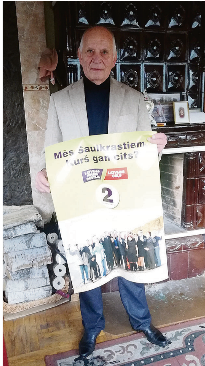
Ar 1997. gada vēlēšanu aģitācijas plakātu par savu gatavību doties vietējā politikā.