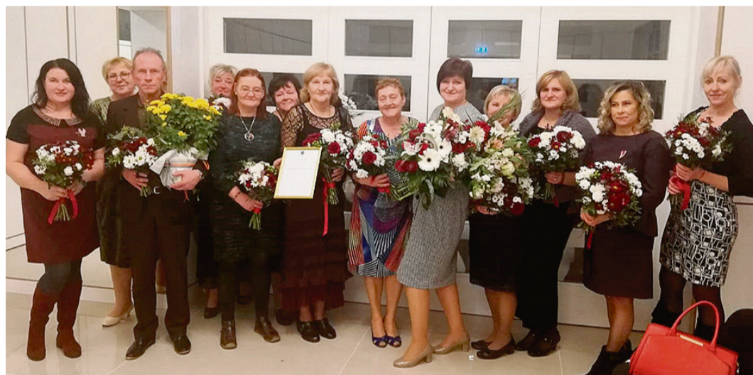
Šā gada novembrī, saņemot domes atzinību.

Gultas grūtniecēm pavissam nebija piemērotas gulošajiem aprūpējamajiem. Taču kādam viņi ikdienā bija jācīnās, bet mēdz būt ļoti smagi cilvēki, kurus ir iespējams pacelt tikai trijotā.