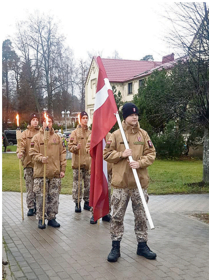
7. un 8. klases jaunsargi Lāpu gājienu.

11. novembrī – Lāčplēša dienu – Saulkrastu vidusskola atzīmēja ar daudzveidīgiem pasākumiem: gan tradicionālo sākumskolas skolēnu Lāpu gājienu, kura priekšgalā devās jaunsargi no pašu vidus – 7. un 8. klases, gan interaktīvu vēstures erudīcijas pasākumu pamatskolas un vidusskolas audzēkņiem, gan ar valsts dibināšanas imitācijas izrādes „Tikšanās vieta – Rīgas 2. pilsētas teātris” apmeklējumu, gan ar sveču iedeģšanu pie Rīgas pils mūra, gan ar jaunsargu goda sardzi uz Akmens tilta, kurā piedalījās 8. klases. Secinājumi: skolā rīkoto pasākumu veiksmīgā un interesantā norisē liela nozīme bija skolēnu pašpārvaldes aktivitātei un sadarbībai ar pedagogiem, bet piedalīšanās plašākos