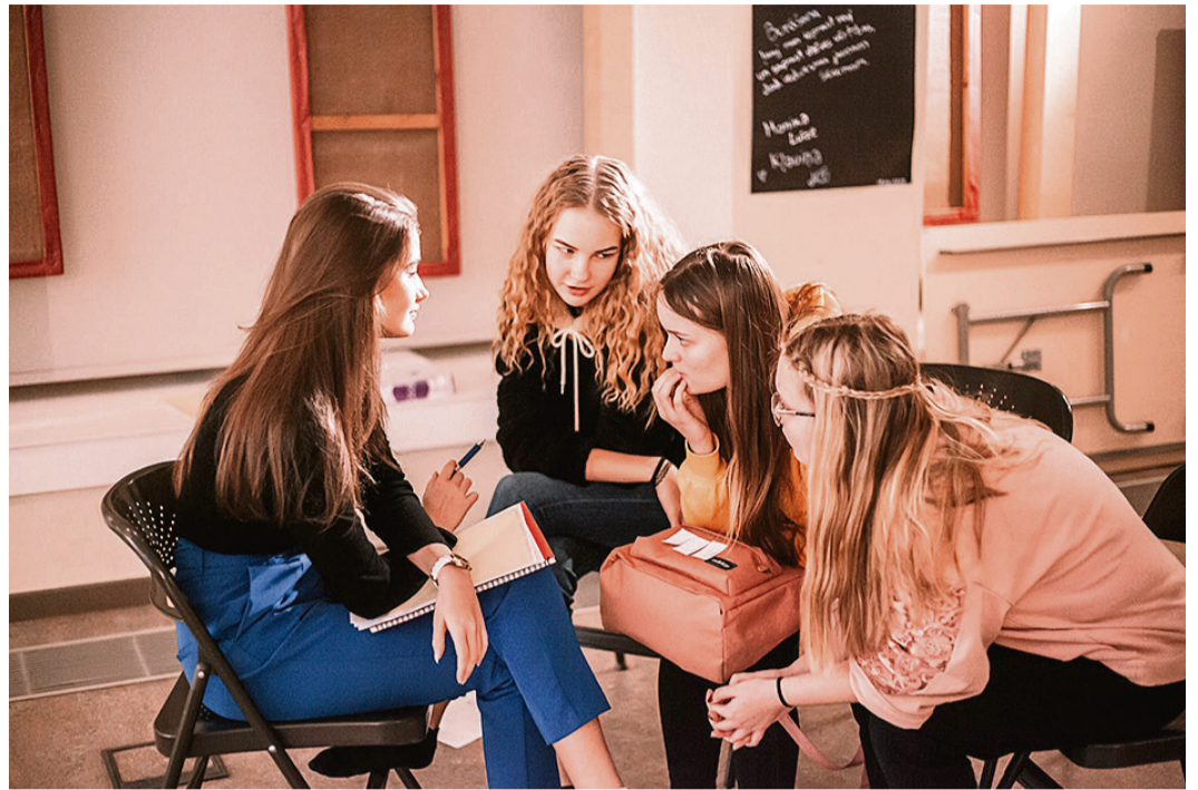
Mācību cikla „Jā uzņēmējdarbībai!” dalībnieces no Saulkrastiem un Carnikavas.

Projekta mērķis bija veicināt sabiedrības solidaritāti un līdztiesību mūsu novadā, piedāvāt jaunas iespējas Saulkrastu novada jauniešiem, lai paplašinātu jauniešu redzesloku, zināšanas