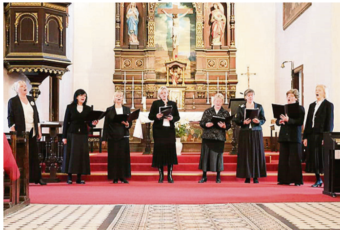
„Dziles” koncertā.