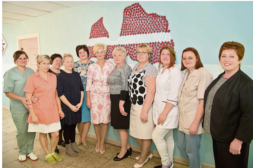
Kopā ar Valsts prezidenta kundzi Ivetu Vējoni Saulkrastu sociālās aprūpes mājas apmeklējuma laikā.

Kad pirms 20 gadiem zem Saulkrastu slimnīcas jumta atbrīvojās telpas sociālās aprūpes mājai, viss bija jāskāp no jauna, bija nepieciešams arī cits aprīkojums.