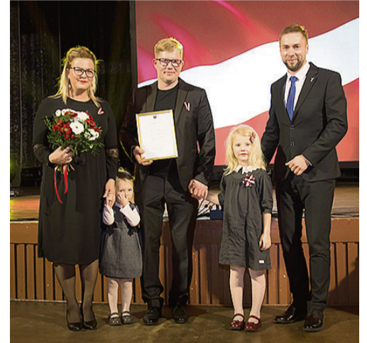
Burbergu ģimene un novada domes priekšsēdētājs Normunds Līcis.