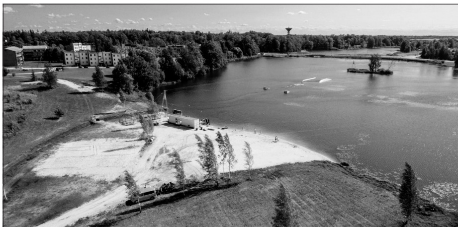
"Wake Mālpils" no putna lidojuma