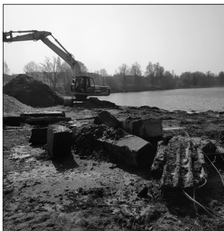
Sudas upes krasta tīrīšana