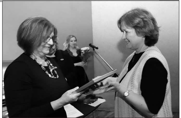
"Gada kolektīvs" – Mālpils Tautskola