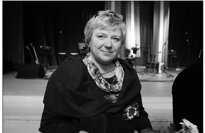
"Gada mecenāts" – SIA "Brūnu HES"