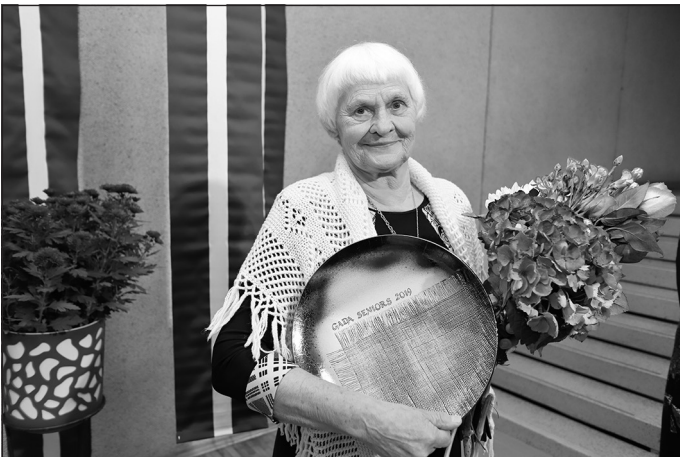
"Gada seniors" – Lauma Tomiņa