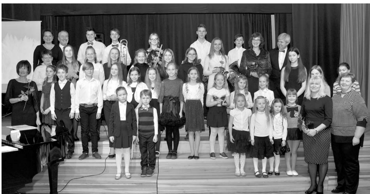
Līgatnes Mūzikas un mākslas skolas kolektīvs Ziemas koncerta izskaņā