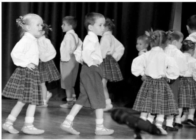
Pirmskolas bērnu deju kolektīva „Liepziedņi” uzstāšanās Vilzēnu tautas namā.