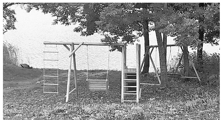
Realizējot projektu un izbūvējot rotaļu laukumu, Lielā Ostrovas ezera peldvieta kļūs par vēl iecienītāku atpūtas vietu novada iedzīvotājiem un viesiem.

Projekta mērķis – ne tikai izveidot peldvietas teritorijā nelielu bērnu rotaļu laukumiņu, bet kā papildus mērķi – veicināt bērnu